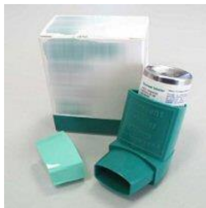
Slika 10.3.1.1. „Pumpica“ ili sprej

„Pumpica“ (slika 10.3.1.1.) je spremnik pod pritiskom u kojem se lijek nalazi pomiješan s potisnim plinom. Nakon potiska pumpice, lijek će iz spremnika izletjeti zajedno sa potisnim plinom.