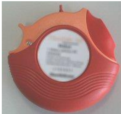
Slika 10.3.2.1. Diskus

Diskus (slika 10.3.2.1.) i Turbuhaler (slika 10.3.2.2.) ne sadrže potisni plin i nisu pod pritiskom. Lijek iz ovih spremnika neće sam izletjeti već ga korisnik mora u pluća unijeti vlastitom snagom udaha (usisati ga u pluća). Upravo zbog ovih razloga važno je znati pravilno primijeniti ove aplikatore kako bi lijek zaista došao u pluća.[8]