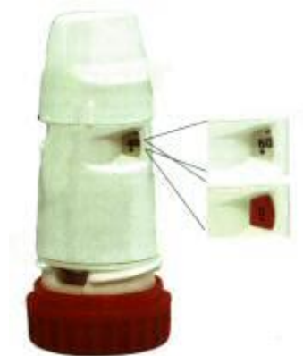
Slika 10.3.2.2. Turbuhaler