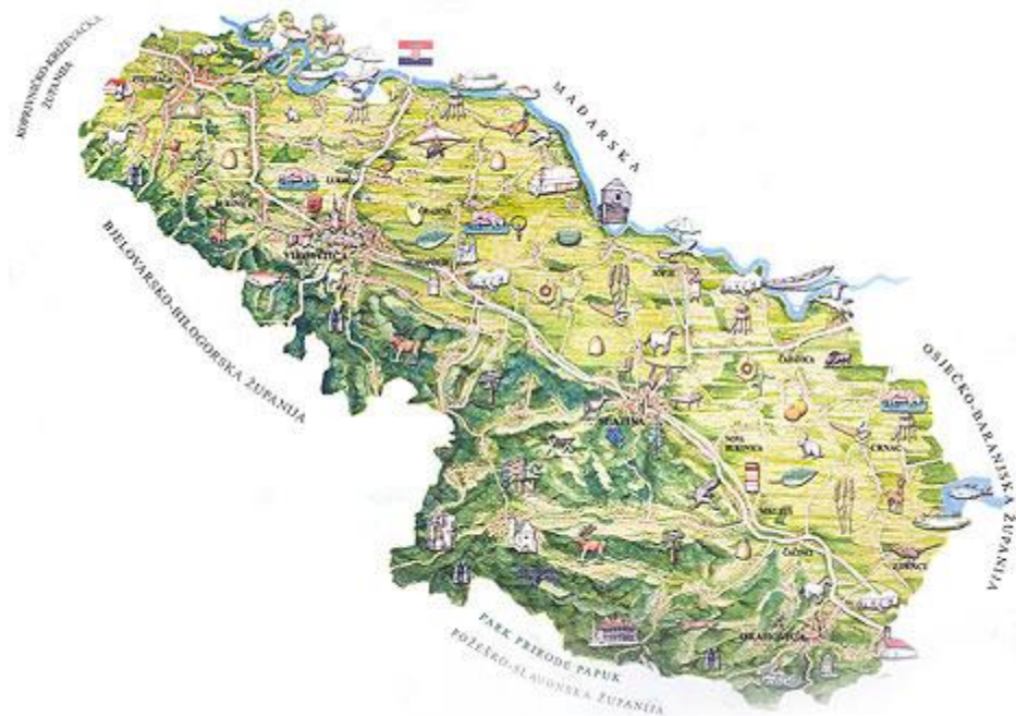
Slika 4. Karta Virovitičko-podravске županije