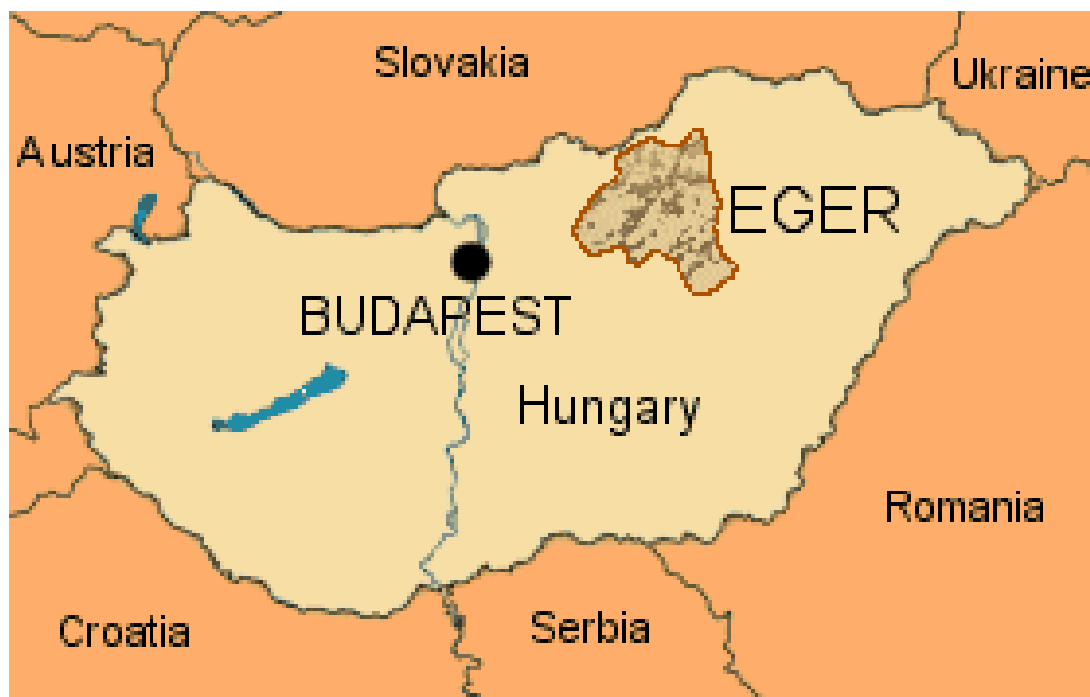
Slika 3. Vinska regija Eger u Mađarskoj