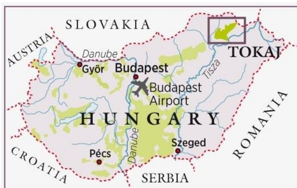
Slika 2. Vinska regija Tokaj u Mađarskoj