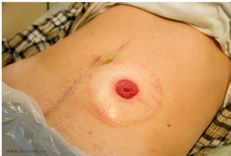
Slika 4.1. Prikaz kolostome

Najčešći uzroci formiranja kolostome mogu biti maligna oboljenja debelog crijeva, upalne bolesti debelog crijeva, ozljede i perforacije, urođene abnormalnosti i sl.