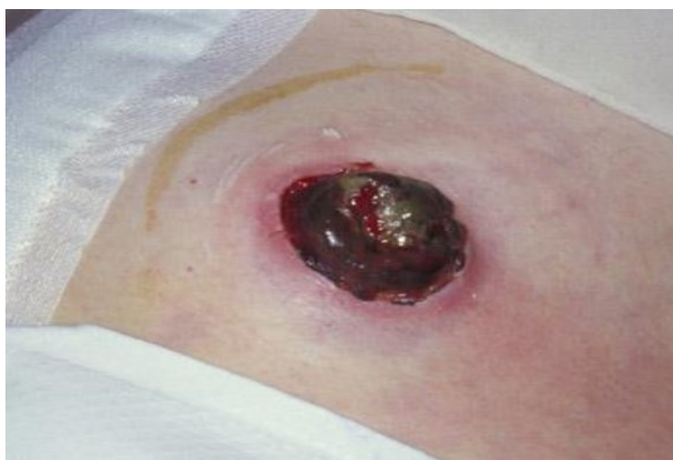
Slika 7.1. Prikaz nekroze stome

Nekroza stome je opasna komplikacija koja nastaje zbog nedovoljne krvne opskrbe crijevne vijuge. Najčešće se javlja u prva 24-72 sata iza operacije.[7] Velika uloga micinske sestre je da prepozna i na vrijeme obavijesti liječnika o novonastaloj komplikaciji. Nekroza nastaje zbog nedovoljnog dotoka krvi u stomu i nastaje odumiranje tkiva. To je vrlo ozbiljno stanje i ukoliko ne dođe do poboljšanja nastaje gangrena stome. Može nastati zbog premalo izrezanog otvora na pločici i njenog pritiska na sluznicu, pa je važno da svaka pločica bude pravilno izrezana. U početku se javlja blijeda boja stome. Na slici 7.1. vidi se da kasnije postaje tamnija, sve do crne boje kada više nema mogućnosti oporavka. Liječenje je kirurško.[7]