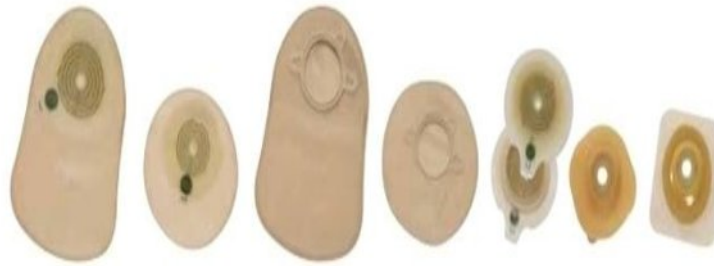
Slika 6.1. Prikaz vrećica za kolostomu

http://www.cemedic.ba/uploads/1/1/4/3/11431712/4158735.jpg?680