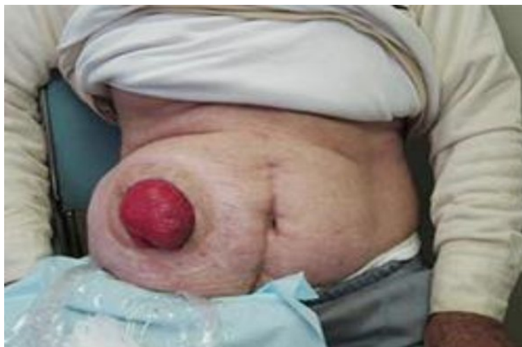
Slika 7.3. Prikaz parastomalne kile

https://www.almediaweb.jp/stomacare/medical/_shared/images/correspondence/img_05_03.jpg