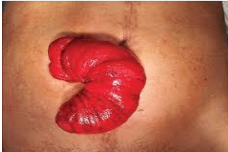
Slika 7.2. Prikaz prolapsa stome

Prolaps kolostome je predstavlja ispadanje svih slojeva crijeva kroz otvor stome što se vidi na slici 7.2. Nastaje zbog povećanja intraabdominalnog tlaka ili samog otvora stome. Uloga medicinske sestre je da prepozna stanje i obavijesti liječnika. Stanje najčešće zahtjeva korekcijski operativni zahvat. Svaka intervencija oko samog crijeva treba biti osobito pažljiva kako se crijevo ne bi ozljedilo.[6]