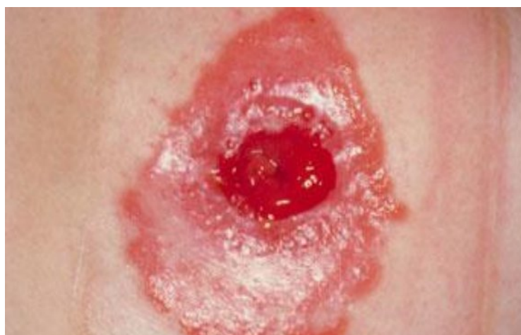
Slika 7.4. Prikaz oštećenja kože oko kolostome

Do oštećenja kože oko kolostome najčešće doaziva zbog kontakta kože sa stolicom. Kao što se vidi na slici 7.4. koža je crvena i sjajna, a za pacijenta vrlo bolna. Kako bi spriječili oštećenja, od velike je važnosti pravilna toaleta i točno krojenje otvora na pločici jer prevelik otvor omogućuje izravan kontakt stolice i kože. Oko takve kože treba vrlo pažljivo postupati, nježno očistiti i posušiti stomu, koristiti zaštitni puder i modelirajuće pločice.[13]