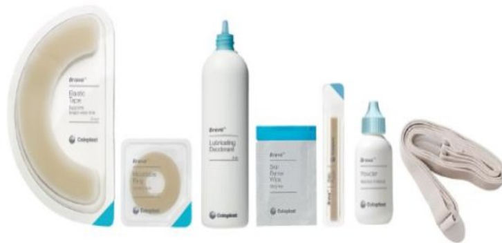
Slika 6.2. Prikaz stoma pomagala

http://www.cemedic.ba/uploads/1/1/4/3/11431712/4158735.jpg?680