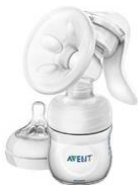
Slika 5.1. Prikaz mehaničke izdajalice

Mehanička izdajalica ili pumpica praktičan je izbor za majke koje nemaju problema i već su dobro uhodane te nemaju oštećenja bradavica. Funkcionira na principu vakuuma. Pažnju treba obratiti na elastičnost šeširića da ne bi oštetio tkivo dojke te na redovitu higijenu i pranje izdajalice. Mana im je nemogućnost kontroliranja jačine vakuuma koji se može regulirati jedino na električnoj izdajalici, ali ona je rijetko izbor majki zbog visoke cijene.