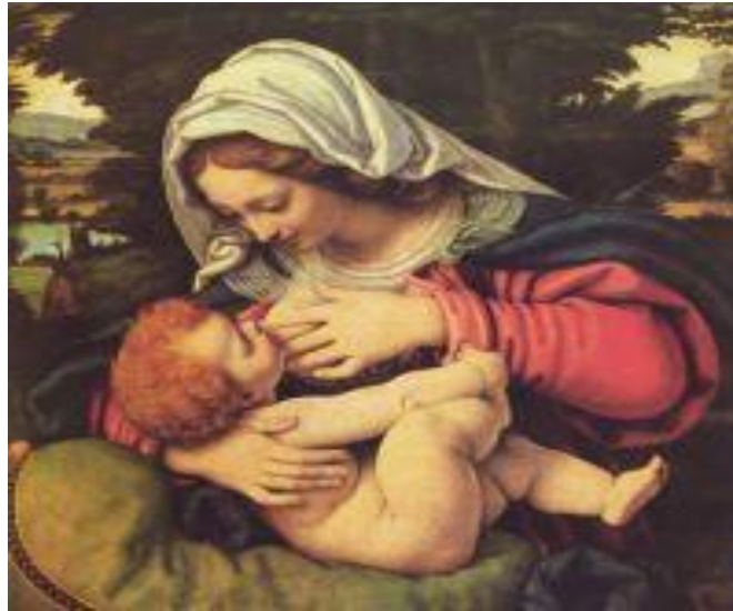
Slika 11.1. Prikaz umjetničke slike dojilje

Povijest dojenja povezana je s poviješću čovječanstva. Dojenje spada u prirodne vještine koje su prirodene ženama svih sisavaca pa tako i ženama. Dojenje je prirodno i oko toga ne bi trebalo biti nikakve rasprave. I kroz samu povijest, mnogi su se poznati umjetnici bavili motivom dojilja te stvorili brojna umjetnička djela u rasponu od starog Egipta pa do moderne, vjerno prikazujući majku s djetetom na prsima.