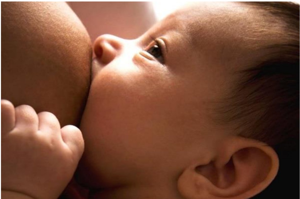
Slika 4.5.6.1. Prikaz djeteta na dojci

Sisanje je proces koji se uči, moraju ga savladati i majka i dijete. Dijelom je urođeno, a dijelom naučeno. Dijete uvlači bradavicu i dio areole u usta te valovitim pokretima jezika povlači mlijeko nakupljeno u sinusima te ono kroz izvodne mliječne kanaliće biva izbačeno u djetetova usta. Dijete obično jednu dojku siše 15 – 20 min. Na početku siše brzo, a zatim sporije i pravilnije. Ponekad za vrijeme dojenja majka može osjetiti blage trnce u dojci, a vezani su uz refleks otpuštanja mlijeka. Taj osjećaj je posljedica kontrakcija mišićnih stanica oko mliječnih kanalića kojima se mlijeko istiskuje iz alveoli. To ujedno rezultira većom navalom mlijeka, pa dijete ubrzava gutanje. Jako je bitno da dijete isprazni dojku kod svakog podoja kako bi dobilo ono tzv. skriveno mlijeko koje je bogato mastima. Ono će mu poslužiti kao glavni izvor energije. Kad podoj na jednoj dojci završi, treba mu ponuditi i drugu, ali vrlo vjerojatno će na drugoj sisati vrlo kratko jer se prethodno najelo. Idući podoj počet će na onoj dojci na kojoj je prethodni završio. Bez obzira je li se jedna ili obje dojke ispraznile kod jednog podoja, obje dojke se jednako stimuliraju na stvaranje mlijeka.