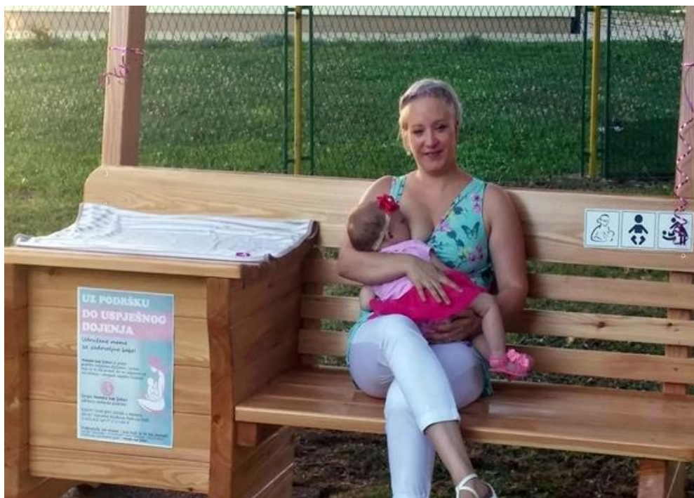
Slika 10.1.1. Prikaz klupe za dojenje

Ideju su osmislile članice grupe Humska kap ljubavi iz Huma na Sutli koju su popratile motom „Dojenje je in - dojimo svoju djecu posvuda“. Klupa je postavljena neposrednoj blizini osnovne škole gdje puno majki boravi sa svojom djecom.