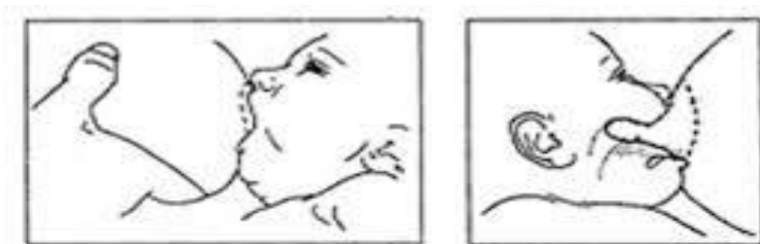
Slika 4.5.5.1. Prikaz pravilno zahvaćene bradavice

Da bi dijete dobro sisalo, u usta mora staviti ćitavu bradavicu i što veći dio areole. Ispod nje se nalaze mlijećni sinusi u kojima je skupljeno mlijeko. Najprije je potrebno bradavicom podrađiti djetetove usnice i kad otvori usta brzo mu glavu privući na dojku. Ako djetetu vrh nosića i brada dodiruju dojku znat ćemo da ju je dobro zahvatilo i da će dobro sisati. Dobro hvatanje bradavice može se postići i tako da se bradavicom podrađi djetetov obraz kod kuta usana. To će potaknuti dijete da okrene glavu na stranu odakle je došao podrađaj te ono otvara usta da uzme bradavicu. Ovo je urođeno ponašanje i naziva se refleks traženja usnama. Ako dijete nije dobro obuhvatilo bradavicu ne smije ga se ostavljati na dojci jer će ubrzo doći do oštećenja bradavice, sisanje će biti nedostatno i dijete se neće najesti.