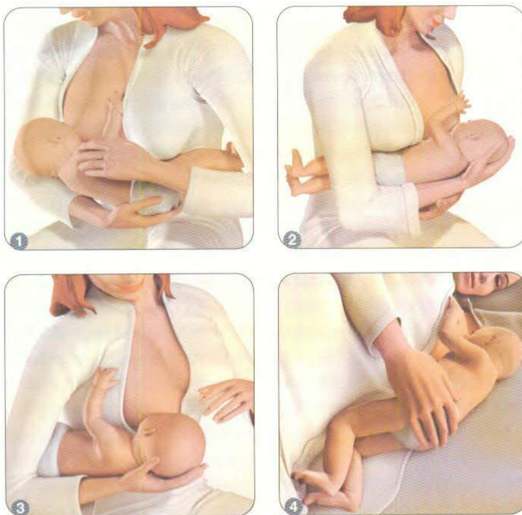
Slika 4.5.3.1. Prikaz različitih položaja dojenja

Manje poznat i manje korišten položaj je tzv. australski položaj kod kojeg majka leži na leđima, a dijete trbuhom na majci licem prema dojci. Majka djetetu ponekad mora pridržavati čelo kako glavica ne bi padala prema dolje. Taj položaj koristi se kod djece koja imaju mali i uvučeni jezik ili srašten jezik, tzv. frenulum.