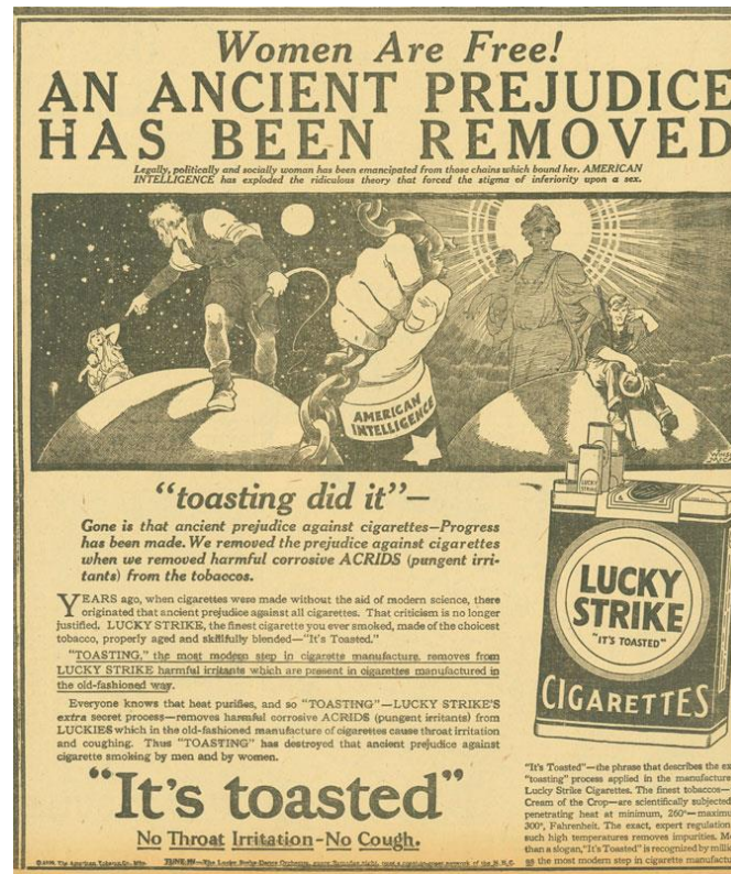
Slika 3.1 Primjer kampanje Lucky Strike cigareta s naslovom Žene su slobodne, stara predrasuda je uklonjena , izvor: http://www.appliedartsmag.com/opinions_details/?id=206

Propaganda nije imala negativno ili podcjenjivačko značenje sve do nakon Drugog svjetskog rata. Hitlerovo glavno oružje bilo je govorništvo, a glavni zadatak svoje stranke vidio je u propagandi. (Alić, 2009: 98) Nakon što su se svi mogli uvjeriti u moć nacističke propagande za promicanje ideje Nationalsocijalističke stranke i antisemitizma, naročito korištenjem filma 1 , ne čudi što su se komunikatori držali podalje od tog pojma. No, propaganda je dio našeg svakodnevnog života, a vezana je uz političku i ekonomsku moć. Danas se pojavljuje kao reklama ili politička kampanja.