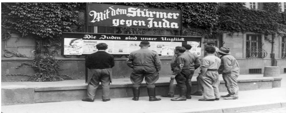
Slika 1. Građani čitaju propagandu s jednog od mnogobrojnih panoa koji su se pojavili nedugo nakon ustanovljenja propagandnog ministarstva.

Da bi se to ostvarilo bilo je nužno „predogojiti“ masu, a one koji su intelektualno sposobniji shvatiti njegove namjere (a ne žele mu se pridružiti) utišati ili čak obrisati s lica zemlje. Kao njegova desna ruka J. Goebbels dolazi na čelo ovog bitnog ministarstva (Šaran, www.matrixworldhr.com , 2016b).