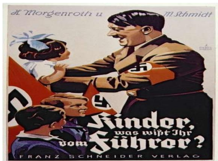
Slika 2. Djeca za vođu, plakat koji je Hitleru koristio neposredno nakon dolaska na vlast, jer se želio pokazati brižnim i miroljubivim političarom.

Prema podacima koje navodi Ljubica Šaran ( www.matrixworldhr.com , 2016b), Ministarstvo prosvjetiteljstva i propagande brojalo je 350 zaposlenika i svi su odgovarali Hitleru i Goebbelsu. Pod njegovim vodstvom, niti mjesec dana nakon osnutka Ministarstva počele su „čistke“ svega onoga što je bilo nepodobno. „Jedna od prvih akcija novog ministarstva bilo je spaljivanje oko 20.000 knjiga židovskih i antinacističkih autora. Spaljivanje je upriličeno na Oprenom trgu, tik do ulaza u poznato Berlinsko sveučilište. Između ostalih, spaljene su knjige Karla Marxa, ali i Thomasa Manna, Ericha Marie Remarquea i Heinricha Heinea“ ( www.povijest.hr , 2016).