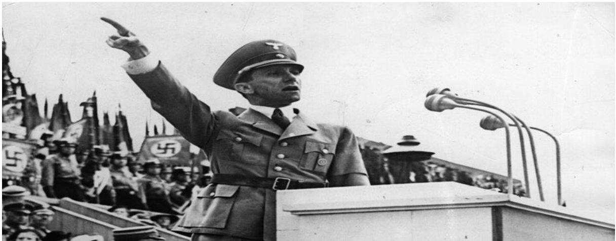
Slika 5. Joseph Gobbels – Hitlerov ministar propagande prilikom održavanja jednog od govora