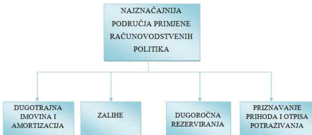
Slika 3. Najznačajnija područja primjene računovodstvenih politika

Od svega navedenog mogu se izdvojiti najznačajnija područja, područja koja su najčešće korištena, a to su dugotrajna imovina i amortizacija, zalihe, dugoročna rezerviranja te priznavanje prihoda i otpisa potraživanja (Slika 3.). U nastavku rada upravo ta područja biti će detaljnije obrađena. Razmatrat će se utjecaj računovodstvenih politika u tim područjima u kraćem i duljem razdoblju. Kratkoročna dimenzija razmatra jedan dio promjena neke pozicije, dok dugoročna uzima u obzir ukupne promjene.