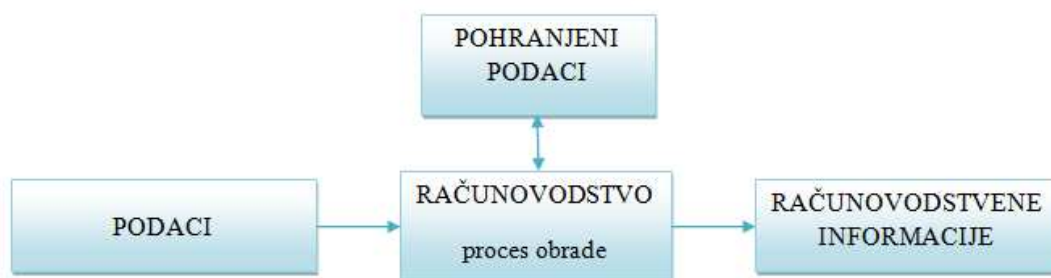
Slika 1. Transformacija podataka u računovodstvene informacije

Cilj je računovodstva kao informacijskog sustava pružiti korisnicima kvalitetne informacije o stanju i kretanju imovine, kapitala i obveza, prihoda i rashoda te u konačnici o poslovnom rezultatu. 4