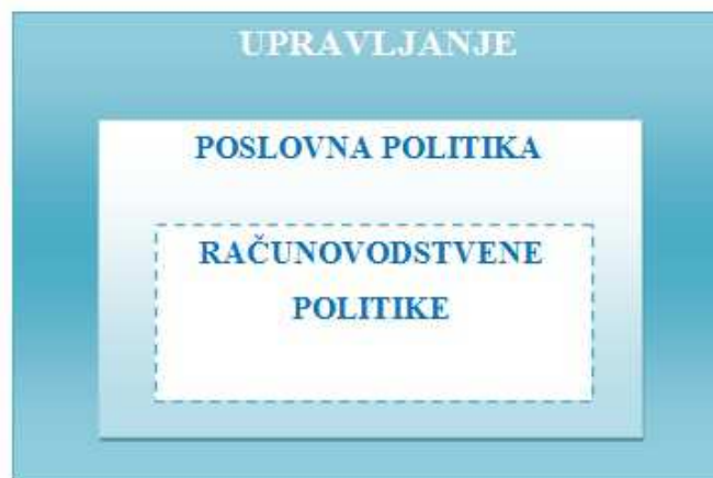
Slika 2. Odnos računovodstvenih politika, poslovne politike i upravljanja

U teoriji ne postoji jednoznačan stav o procesu upravljanja i poslovnoj politici, neki teoretičari ta dva pojma poistovjećuju, dok drugi smatraju da postoje prevelike razlike između ta dva pojma. No najčešće se smatra da je poslovna politika dio procesa upravljanja. Upravljanje je moguće na tri razine: strateškoj (najviša razina), taktičkoj (srednja razina) i operativnoj (najniža razina). Neovisno o razini upravljanja, za svaki proces upravljanja su potrebne informacije. Te informacije većinom nastaju u računovodstvu, što je i razlog zašto se računovodstvo smatra servisom, odnosno uslužnom funkcijom u procesu upravljanja. Možemo računovodstvo usporediti sa strojem koji kao ulaz dobije sirovinu (financijske transakcije i podatke), a u konačnici daje proizvod za upotrebu (informacija potrebna za donošenje odluka i upravljanje). Svaka informacija koju menadžeri koriste da bi donijeli odluke mora biti objektivna i realna, a u tome važnu ulogu imaju računovodstvene politike, kojima se može svjesno utjecati na određene vrijednosti pozicija financijskog izvještaja. Odabir određenih računovodstvenih politika, i njihovih metoda, kratkoročno utječe na poslovni rezultat, odnosno financijski položaj i uspješnost poslovanja. Računovodstvena politika je podskup poslovne politike i njezini ciljevi moraju biti usklađeni sa ciljevima poslovne politike. Odnos računovodstvenih politika, poslovne politike i upravljanja prikazuje Slika 2. 16