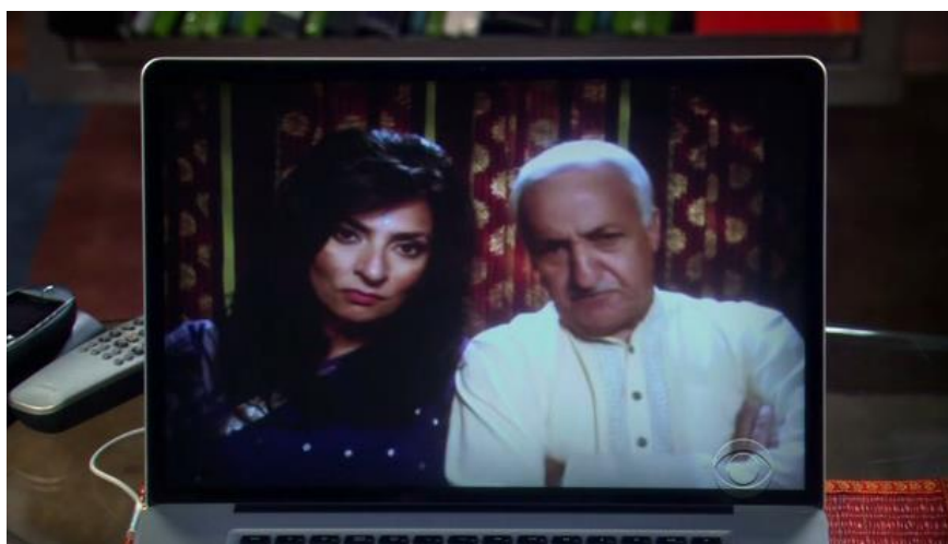
Slika 3. Rajevi roditelji

Rajevi roditelji u seriji su prikazani samo preko videopoziva te gledatelji nisu upoznati s njihovim imenima. U pozadini zaslona uvijek možemo vidjeti zastore koji odišu indijskim stilom dok su roditelji odjeveni u tradicionalnu indijsku odjeću. Gospodin i gospođa Koothrappali, u skladu sa svojim indijskim običajima, žele da njihov sin oženi Indijku i to po njihovom izboru. Usprkos tome, Raj želi sam pronaći ljubav svog života, iako mu to ne ide od ruke. U epizodi „The Grasshopper Experiment“/„Pokus sa skakavcem“, roditelji ga pošalju na „slijepi spoj“ s Indijkom u nadi da će se vjenčati. Nakon što je počeo gubiti nadu u ljubav, pristane na spoj, ali se ubrzo razočara. Naime, Indijka je pristala na spoj samo zato da prikrije svojim roditeljima činjenicu da ona zapravo voli žene. U epizodi „The Wiggly Finger Catalyst“/„Ispušni ventil vijugavog prsta“ saznali smo da su Koothrappaliji veoma bogati, Sheldon ih je nazvao bogatima kao „Richie Rich“ referirajući na dječji film o obitelji milijardera. Rajevi roditelji spominju također kako su veoma bogati u veoma siromašnoj zemlji te se stoga nemaju na što žaliti. S ostatkom Rajeve obitelji nismo upoznati, ali bitno je spomenuti još Rajevog rođaka Venkatesha koji se pojavio u epizodi „The Precious Fragmentation“/„Dragocjeno usitnjavanje“. Venkatesh radi kao odvjetnik u Mumbaiju pa ga je Raj htio angažirati, ali je ubrzo odustao od toga kada je vidio kako ima slabe pregovaračke sposobnosti.