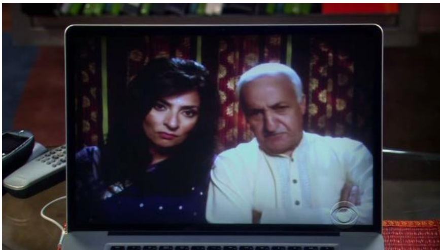
Slika 3. Rajevi roditelji

Rajevi roditelji u seriji su prikazani samo preko videopoziva te gledatelji nisu upoznati s njihovim imenima. U pozadini zaslona uvijek možemo vidjeti zastore koji odišu indijskim stilom dok su roditelji odjeveni u tradicionalnu indijsku odjeću. Gospodin i gospođa Koothrappali, u skladu sa svojim indijskim običajima, žele da njihov sin oženi Indijku i to po njihovom izboru. Usprkos tome, Raj želi sam pronaći ljubav svog života, iako mu to ne ide od ruke. U epizodi „The Grasshopper Experiment“/„Pokus sa skakavcem“, roditelji ga pošalju na „slijepi spoj“ s Indijkom u nadi da će se vjenčati. Nakon što je počeo gubiti nadu u ljubav, pristane na spoj, ali se ubrzo razočara. Naime, Indijka je pristala na spoj samo zato da prikrije svojim roditeljima činjenicu da ona zapravo voli žene. U epizodi „The Wiggly Finger Catalyst“/„Ispušni ventil vijugavog prsta“ saznali smo da su Koothrappaliji veoma bogati, Sheldon ih je nazvao bogatima kao „Richie Rich“ referirajući na dječji film o obitelji milijardera. Rajevi roditelji spominju također kako su veoma bogati u veoma siromašnoj zemlji te se stoga nemaju na što žaliti. S ostatkom Rajeve obitelji nismo upoznati, ali bitno je spomenuti još Rajevog rođaka Venkatesha koji se pojavio u epizodi „The Precious Fragmentation“/„Dragocjeno usitnjavanje“. Venkatesh radi kao odvjetnik u Mumbaiju pa ga je Raj htio angažirati, ali je ubrzo odustao od toga kada je vidio kako ima slabe pregovaračke sposobnosti.