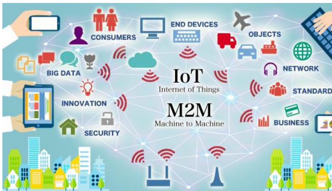
Slika br.4: Pametni sustavi za bolju učinkovitost i uštede

M2M tehnologija (Machine-to-machine) riječ je o automatskom prijenosu i razmjeni podataka između uređaja, strojeva ili aplikacija raznih namjena: npr. vozila, alarmnih sustava, bankomata, automata za prodaju robe ili naplatu usluga, nadzor udaljenih uređaja i postrojenja i dr. Isto tako, znate da sve te sustave jednostavno možete kontrolirati iz udaljenosti, koristeći samo mobilnu mrežu. Tu tehnologiju koriste operateri npr. T-com i dr.