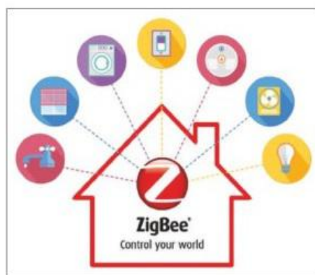
Slika br.1 : Shema ZigBee uređaja (13)

ZigBee je bežični komunikacijski protokol koji omogućuje da uređaji, bilo oni za kućnu ili poslovnu upotrebu, međusobno funkcioniraju i razmjenjuju podatke. ZigBee je osmišljen i ratificiran od strane tvrtki članica grupacije ZigBee Alliance u kojoj članstvo imaju više od 300 tehnoloških tvrtki i raznih proizvođača. Kao takav, ZigBee protokol je dizajniran i planiran da omogući bežične prijenose podataka između uređaja karakteriziranim sigurnošću i pouzdanošću. Osmišljen je još 1998. godine, zatim je standardiziran 2003. godine, a revidiran 2006. godine. (13)