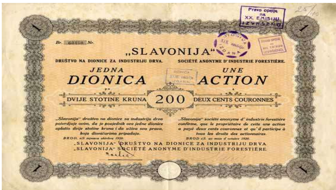
Slika 3.4 prikazuje dionicu "Slavonije" društva na dionice za industriju drva Brod na Savi, 1920 g.