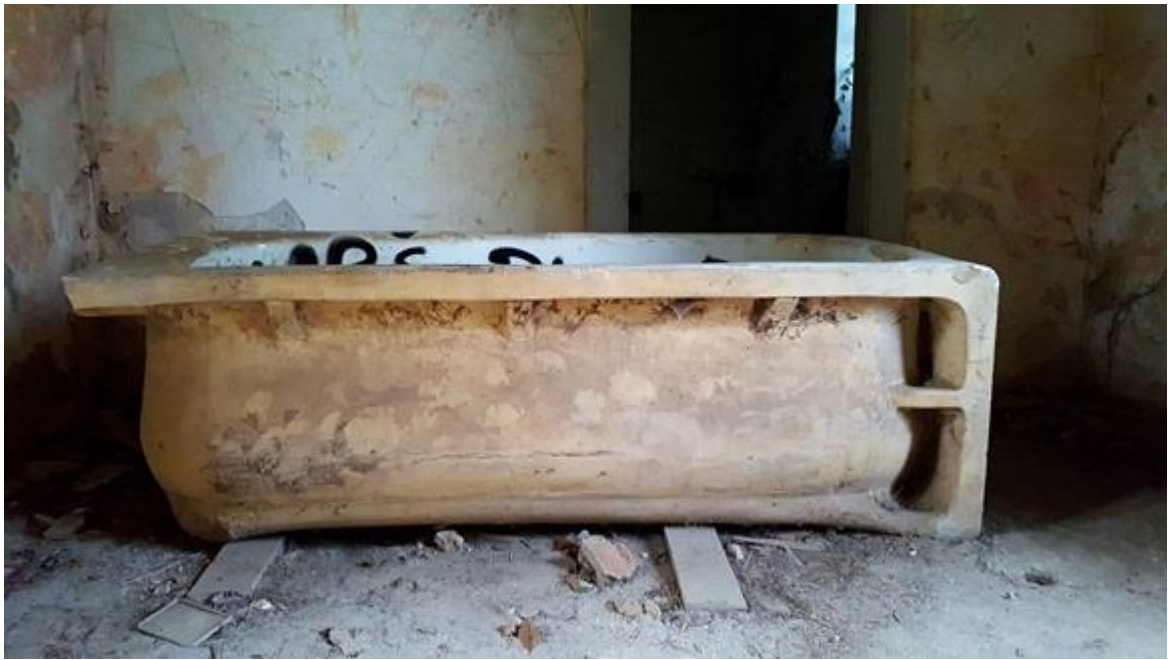
Slika 5.2. Kada ostavljena u dvorcu Opeka