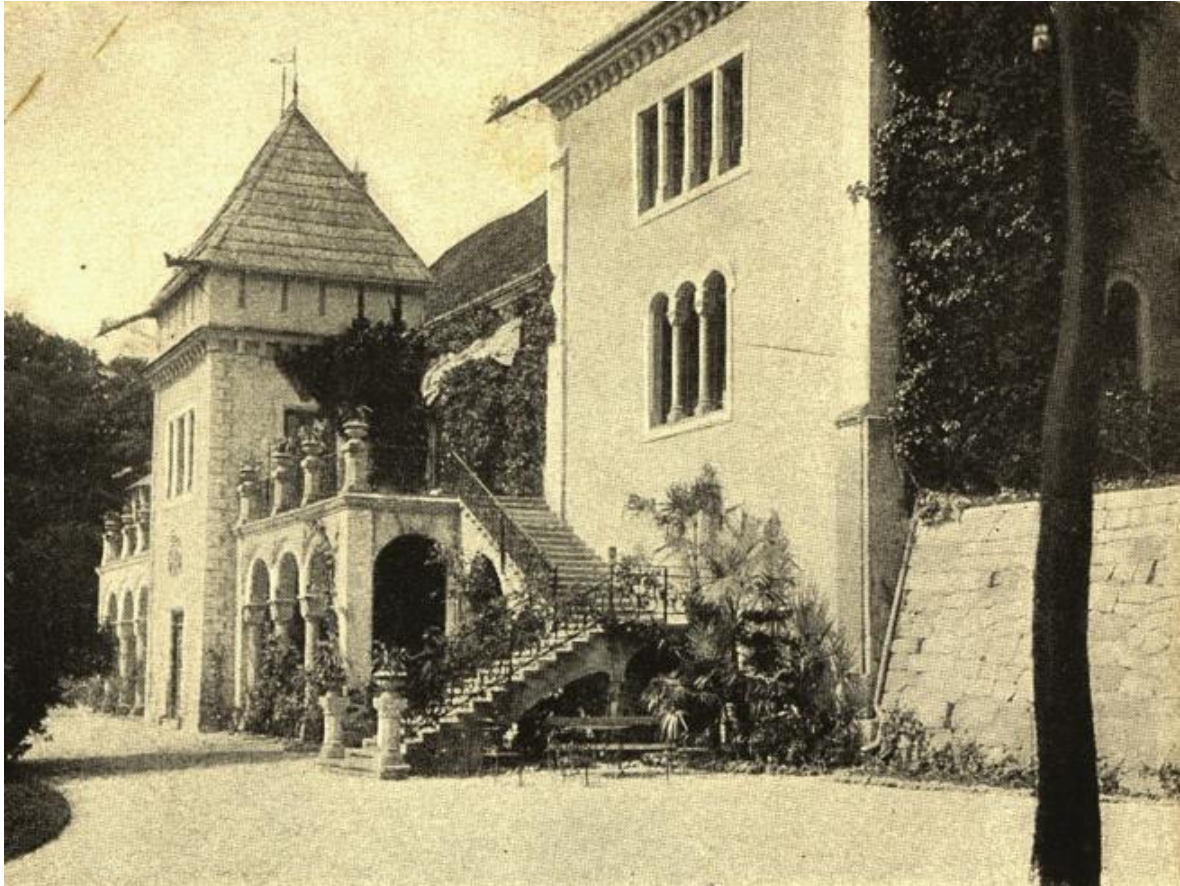
Slika 2.4. Detalj istočnog pročelja dvorca krajem 19. stoljeća

Nastupilo je višegodišnje učestalo devastiranje dvorca od strane lokalne mladeži, provale, razbijanje i palež, koji se nastavljaju do današnjih dana. [3]