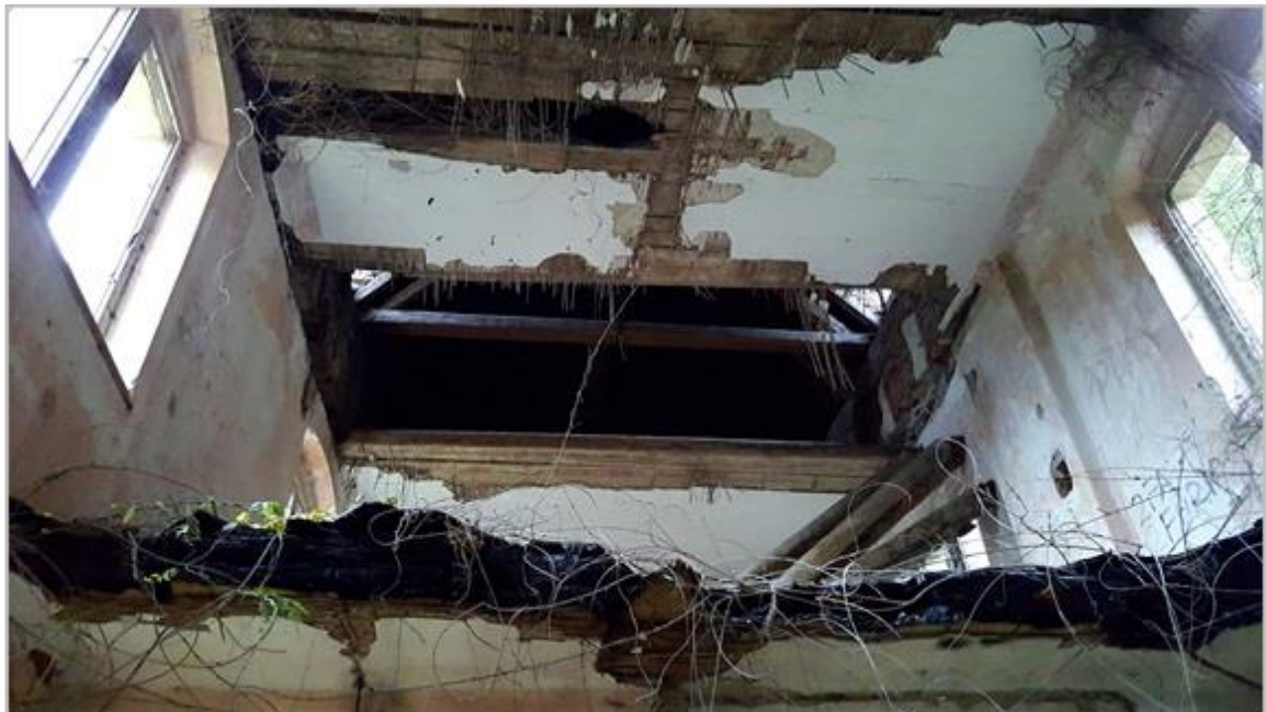
Slika 5.3. Spaljeni stropovi u dvorcu Opeka