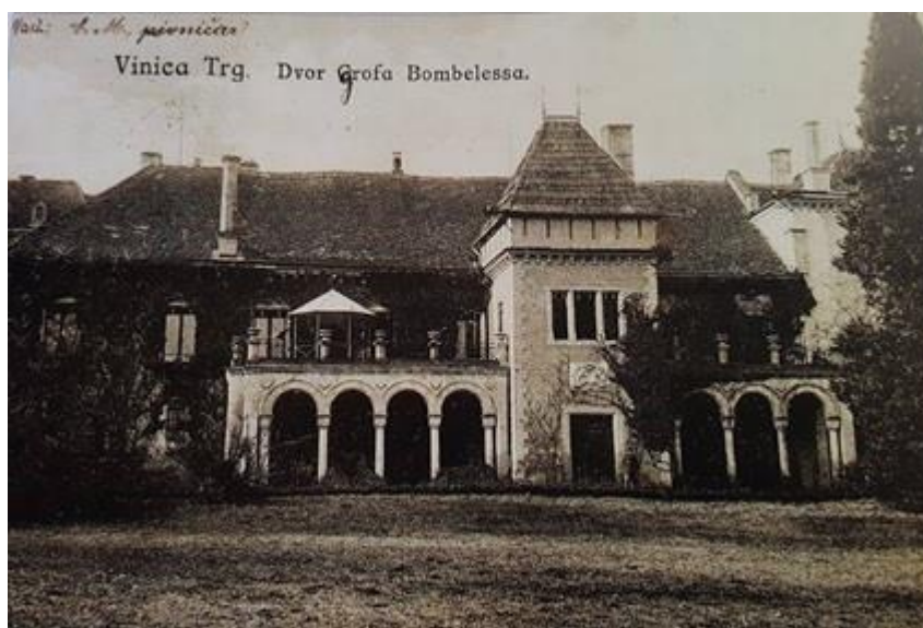
Slika 2.1. Dvorac Opeka