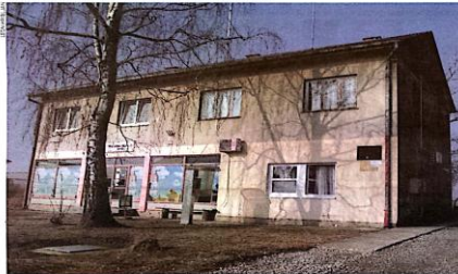
Zgrada u kojoj se nalaze ambulanta i liječnički stan