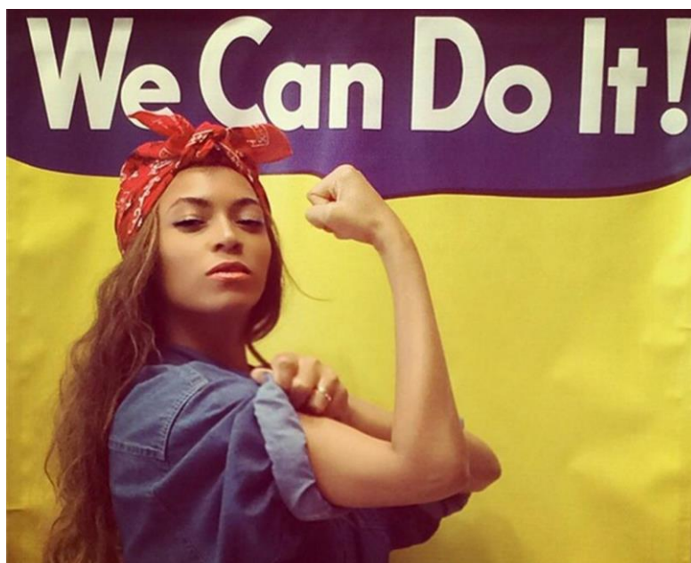
Slika 18 Beyonce