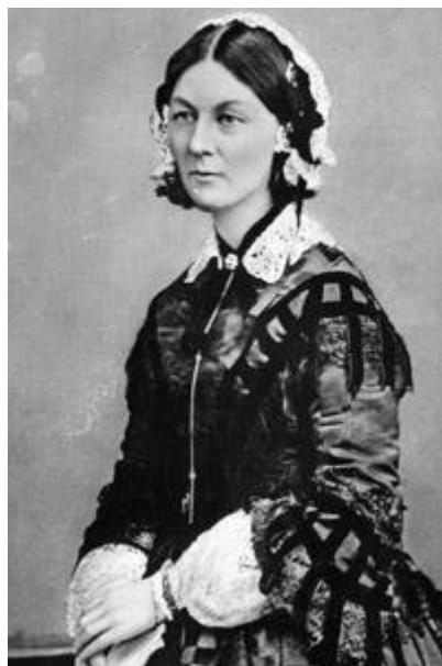
Slika 13 Florence Nightingale

„U Francuskoj je do 1914. godine radilo više od sedam milijuna žena, a do 1918. godine predstavljale su 40% ukupne radne snage“ (Zaharijević 2010: 378). Redateljica Sarah Gavron, 2015. godine, snima istoimeni film "Sufražetkinje", koji priča o tome kako obične žene postaju borci u borbi za pravo glasa u Velikoj Britaniji. Feministice poput Voltairine de Cleyre i Margaret Sanger bile su najaktivnije u borbama za ženska seksualna, produktivna i aktivna prava u to doba. Godine 1854., Florence Nightingale osnovala je pokret medicinskih sestara koje su bile dodatak vojsci. Prvi val feminizma uključivao je širok raspon žena, razne uzraste, rase i religije.