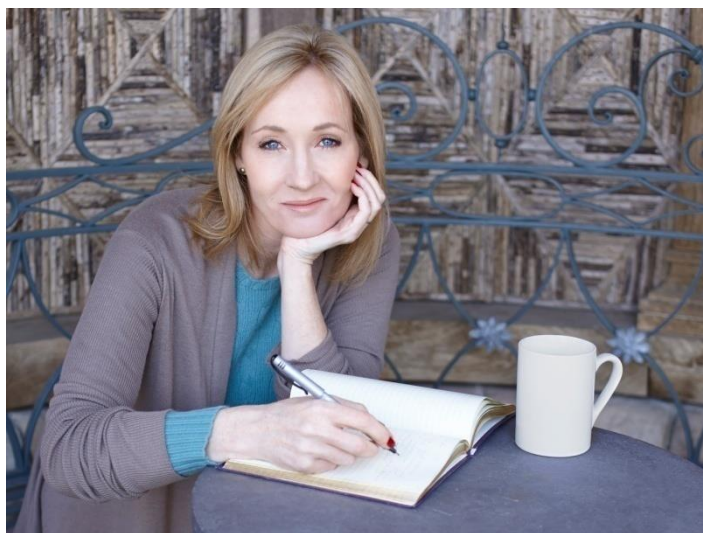
Slika 16 J. K. Rowling

Danas se J.K.Rowling smatra 13. najbogatijom Britankom.