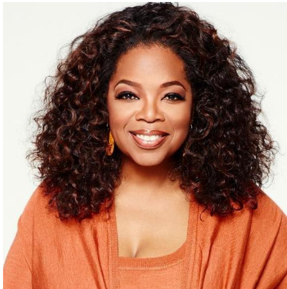
Slika 15 Oprah Winfrey