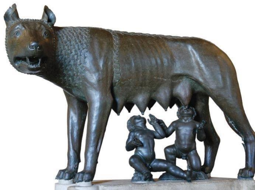
Slika 4 Romul i Rem

Ne postoji mnogo saznanja o ženama u Starome Rimu jer su povjesničari bili muškarci i pisali su samo o muškom rodu. Iz rimske mitologije i povijesti, važno je spomenuti Reu Silviu, majku Romula i Rema, Lukreciju i vučicu Martiu. Vjeruje se da je Rim nastao na sedam brežuljaka te da su ga osnovali braća Romul i Rem.