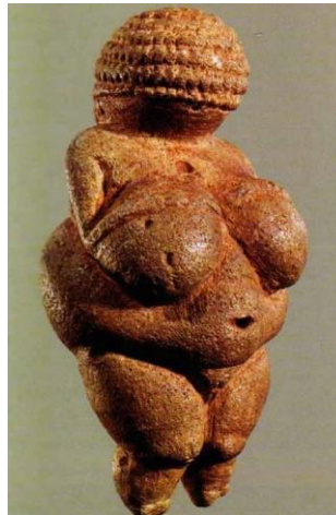
Slika 2 Božica plodnosti

Primitivna društva (kamenno, metalno, brončano doba) i njihova uređenja bila su obilježena matrijarhatom. Riječ matrijarhat dolazi od „lat.mater, genitiv matris : majka + -arh“, a smatra se vladavinom ili tradicijom u kojoj je društvena moć u rukama žena u zajednici.“ 8 Vjerovanje u matrijarhat i moć žena koja je proizlazila iz toga, postojalo je isključivo iz razloga što primitivni ljudi nisu poznavali vezu između spolnog općenja, trudnoće i rađanja, pa je tako došlo do poimanja da žene misteriozno proizvode djecu i kako su one po tome božice plodnosti.