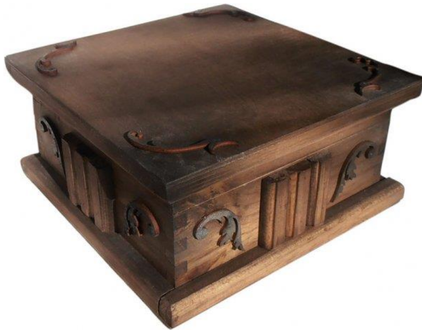
Slika 3 Pandorina kutija

prevarama, zločinom, starošću i bolestima. Pandora je ubrzo zatvorila kutiju i u njoj je ostala samo nada. Primijetila je kako je svijet bez nade vrlo hladan, pa je opet otvorila kutiju iz koje je izašla i nada. “ 13