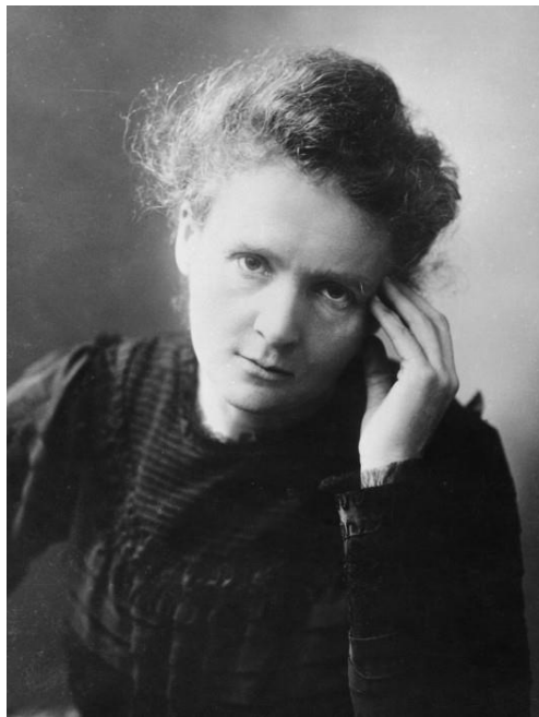
Slika 8 Maria Sklodowska Cuire

Albert Einstein i Max Planck. Godine 1911. Curie je osvojila još jednu Nobelovu nagradu, ovog puta za kemiju. Njeno otkriće polonija učinilo ju je prvom znanstvenicom koja je osvojila dvije Nobelove nagrade. Umrula je u Francuskoj, 4. srpnja 1934., bolovala je od anemije, za koju se pretpostavlja da je bila uzrokovana dugotrajnima izlaganjima zračenju. Maria Sklodowska Curie svojim je postignućima postavila temelje muškim i ženskim znanstvenicima i njezino otkriće je jedinstveno za tadašnje razdoblje s obzirom da nije imala primjerene radne uvjete u odnosu na druge muške znanstvenike.