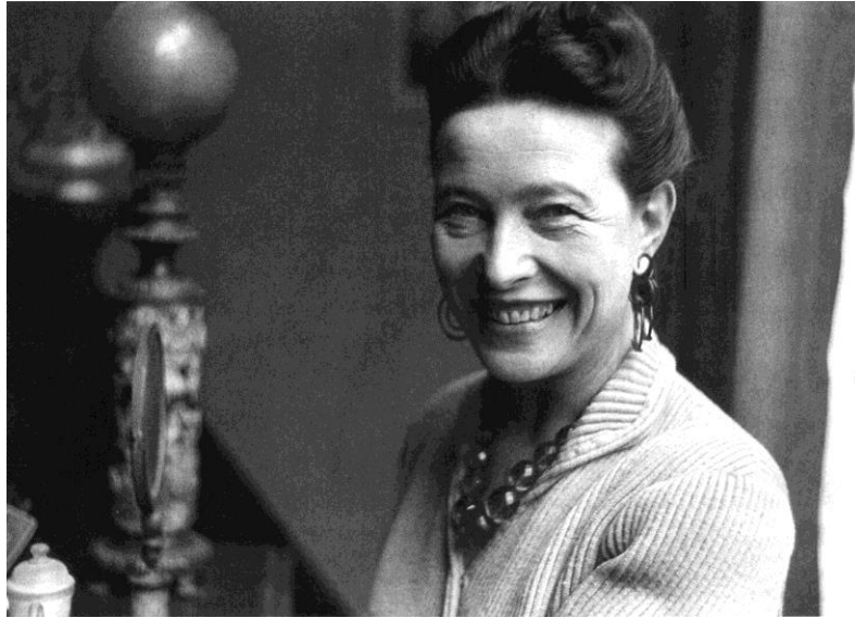
Slika 1 Simone de Beauvoir