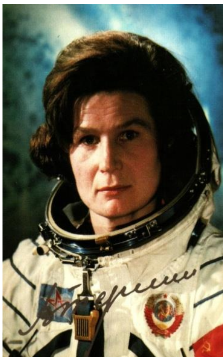
Slika 7 Valentina Tereškova