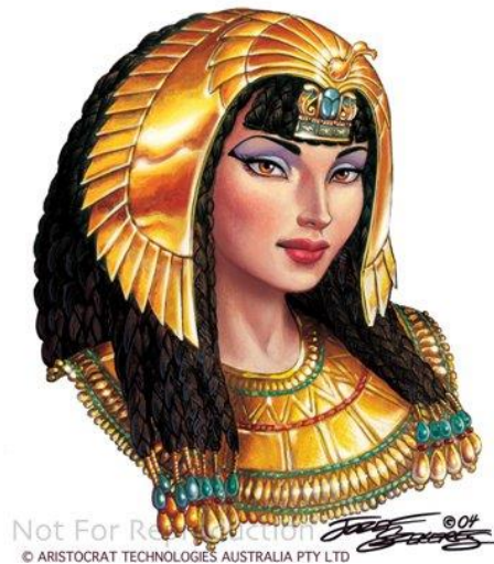
Slika 5 Kleopatra VII.

Nakon što je Cezar ubijen od strane svoga sina Brutusa, Kleopatra, kako bi očuvala svoj položaj, počela se nalaziti s Cezarovim generalom i pristalicom Markom Antonijem. S njim se vjenčala po egipatskim propisima te s njim dobila djecu. Kasnije će se Kleopatra boriti u ratu protiv Oktavijana Augusta te će izgubiti i Egipat će postati rimskom provincijom. Zbog poraza i poniženja od strane Oktavijana, Kleopatra je počinila samoubojstvo tako da je dala da ju ugrizu zmiје otrovnice, vjerujući da će joj to zbog egipatskih vjerovanja dati besmrtnost. Iako je bila iznimno sposobna vladarica te je Egipat u doba njezine vladavine napredovao, Kleopatra je u povijesti zapamćena samo kao iznimno lijepa žena, a ne superiorna kraljica.“ 16