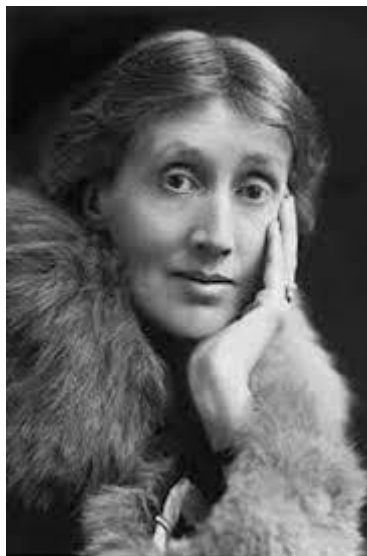
Slika 10 Virginia Woolf