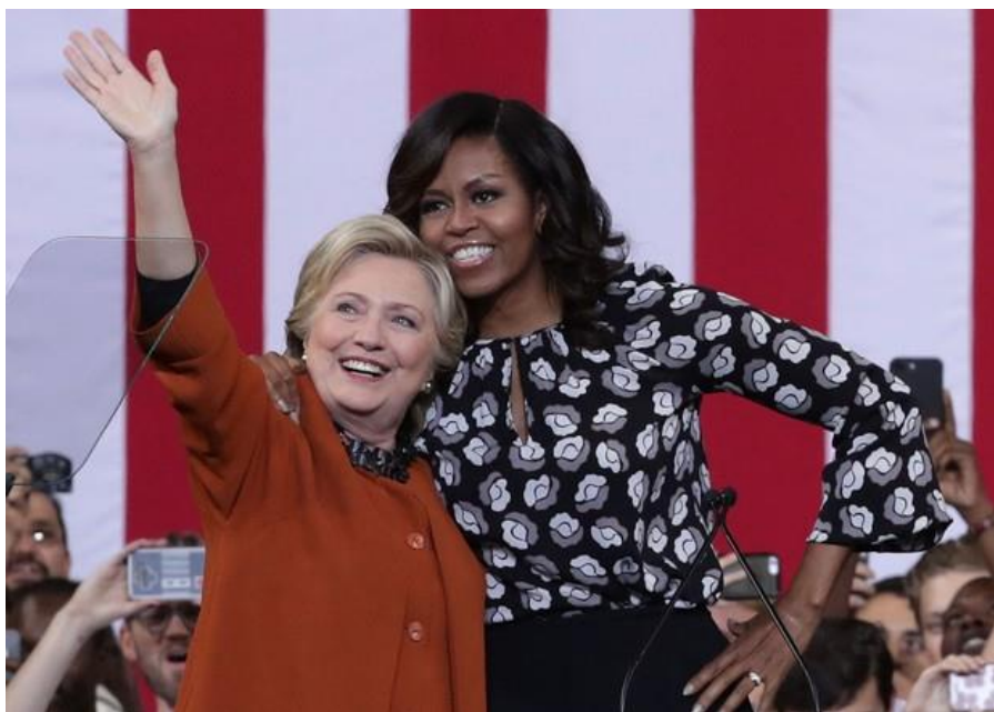
Slika 17 Hilary Clinton i Michelle Obama

I Clinton i Obama, obje vrlo uspješne i utjecajne ikone, cijeli život bave se humanitarnim radom i pomažu potrebitijima. Michelle Obama također se bori i za prava crkinja.