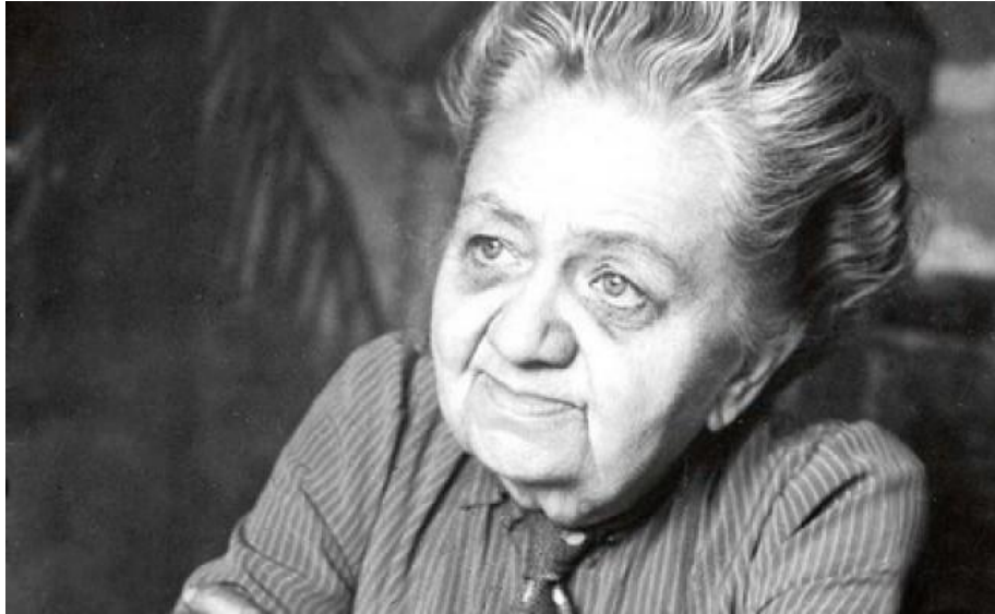
Slika 9 Marija Jurić Zagorka