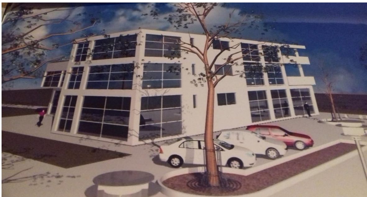
Slika 4. Edukativno rehabilitacijski centar