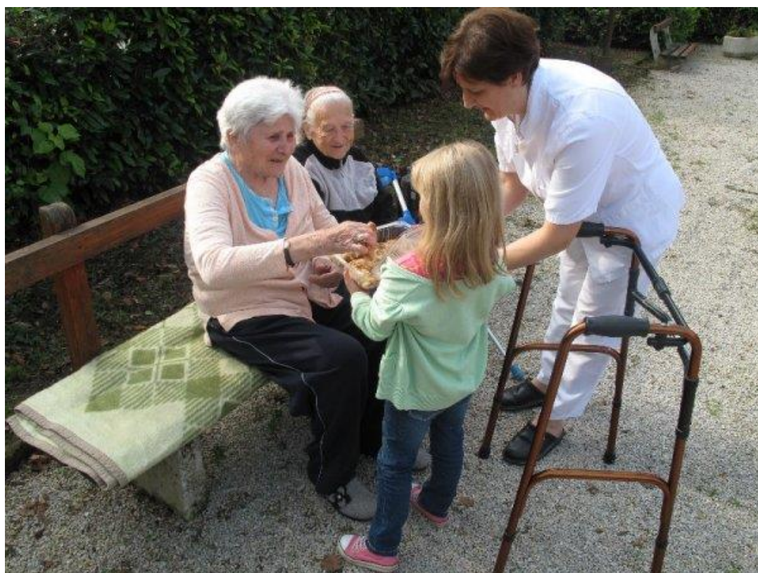
Slika 6. Posudionica pomagala

Posudionica pomagala u sklopu udruge za palijativnu pomoć Srce Novi Marof osnovana je sa ciljem poboljšanja fizičke udobnosti pacijenata te prava na bolju zdravstvenu i socijalnu skrb. Fizička udobnost pomoću raznih ortopedskih pomagala osnova je u poboljšanju kvalitete života pacijenata i velika pomoć obitelji i profesionalcima u pružanju adekvatne skrbi za oboljele.[10]