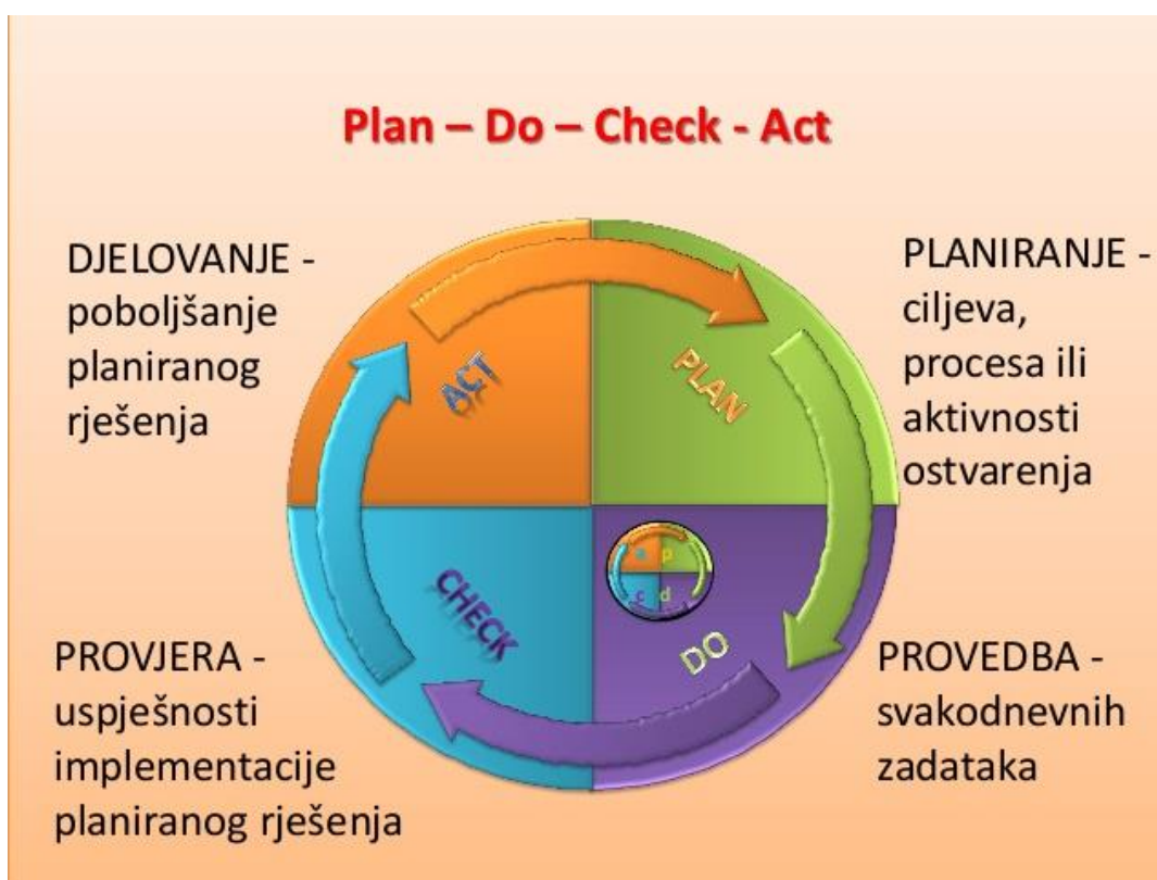
Slika 1. PDCA – Demingov krug

Kvalitetu u zdravstvenoj njezi je teško mjeriti zbog toga što zadire u fizičke, intelektualne, emocionalne, duhovne i socijalne aspekte ljudskog života.[1]