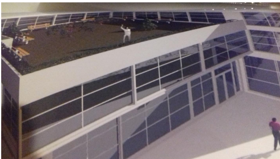
Slika 5. Edukativno rehabilitacijski centar