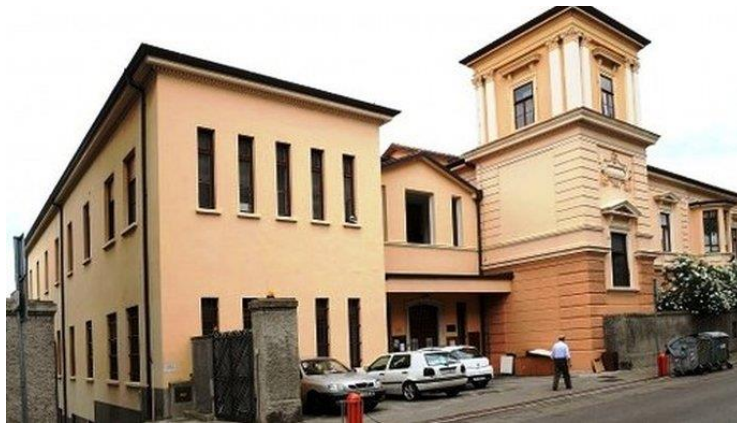
Slika 1.1. Prvi hospicij u Hrvatskoj.