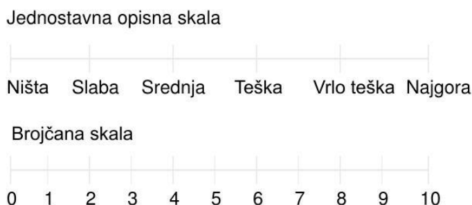
Slika 4.8.1.1 Skala procjene boli