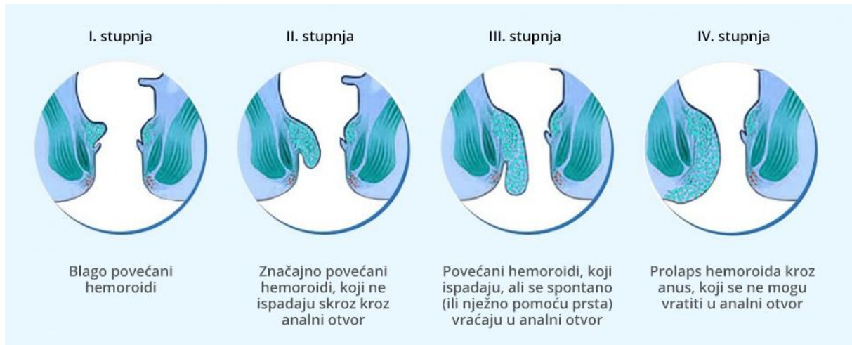
Slika 3.2.1 Stupnjevi hemoroida

Često se osjeća bol, stalna nelagoda, česta krvarenja nevezano za stolicu, te su obično praćeni velikim vanjskim hemoroidima [7,8,9].