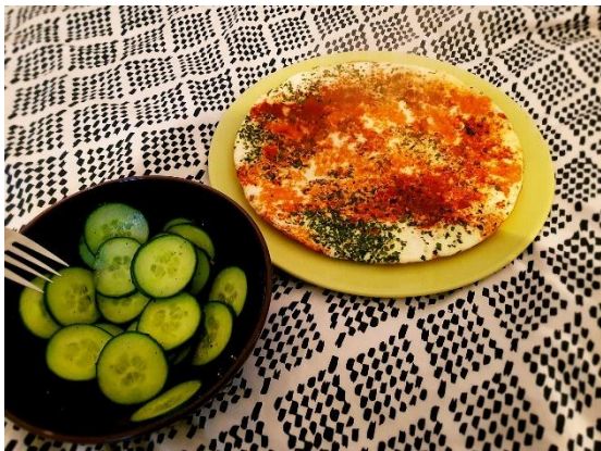
Slika 8.5.10.: Omlet uz salatu od krastavaca