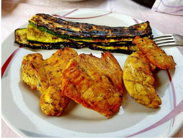
Slika 8.5.8.: Emin zdravi obrok: povrće i bijelo meso