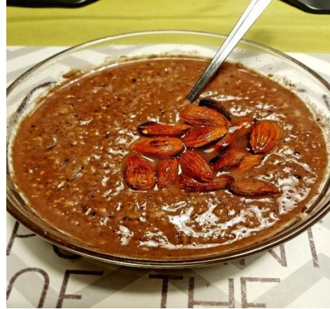
Slika 8.5.9.: Doručak : prokuhane zobene pahuljice i bademi