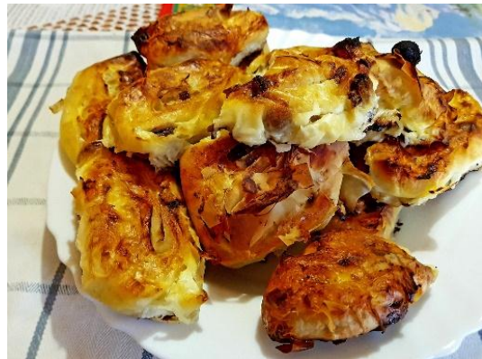
Slika 8.5.11.: Emino omiljeno jelo – štrudle