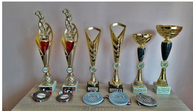
Slika 8.6.14.: Emini osvojeni pehari i medalji kroz razna natjecanja