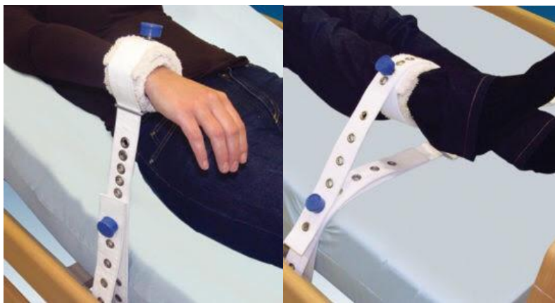
Slika 4.1. Prikaz metoda humanog sputavanja.

Primjena fizičkog obuzdavanja predstavlja rizik ozljeđivanja za osoblje i za pacijenta. [12] Sredstva za fizičko ograničavanje sačinjena su od tkanina, kože, metala i magneta u obliku pojaseva. Sputani pacijent je pod intenzivnim nadzorom, intenzivno mu se nadziru vitalni parametri i procjenjuje se njegovo psihičko stanje te čim dođe do smirivanja simptoma agitacije i agresije, sputavanje se prekida. Svako sputavanje se bilježi na za to predviđenom protokolnom obrascu. Radnim danom u 16h, a subotom i nedjeljom u 9h kod izmjenjivanja dežurne službe liječnika, odjelna služba dužna je obavijestiti dežurnog psihijatra ima li sputanih pacijenata na odjelu, a tijekom radnih dana (ponedjeljak – petak) tijekom smjenske primopredaje službe liječnik koji napušta službu dužan je obavijestiti liječnika koji nastavlja dežurstvo o svakom sputanom pacijentu. Ako pacijent odbija sudjelovati u poštivanju kućnog reda, odbija se presvući, odbija uzimanje terapije ili neke druge obveze u propisanom programu liječenja (predaja mobitela), ne treba primjenjivati fizičku silu već obavijestiti nadležnog liječnika – psihijatra o nesuradljivosti pacijenta.