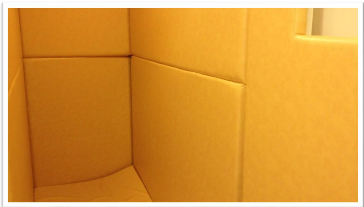
Slika 3.2.4.1. Ilustracija prikaza sobe za odvajanje.

Europski standardi za sobu za izdvajanje traže da soba mora biti dobro izolirana i ventilirana s mogućnošću kontrole temperature izvan sobe, pristupom toaletu i prostoru za mogućnost održavanje higijene te s namještajem, prozorima i vratima koji se ne mogu uništiti, niti koristiti kao oruđe za ozljeđivanje. [7] Prema članku 64. Zakona o zaštiti osoba s duševnim smetnjama, a o primjeni mjera prisile potrebno je obavijestiti osobu od povjerenja, zakonskog zastupnika i etičko povjerenstvo. [10]