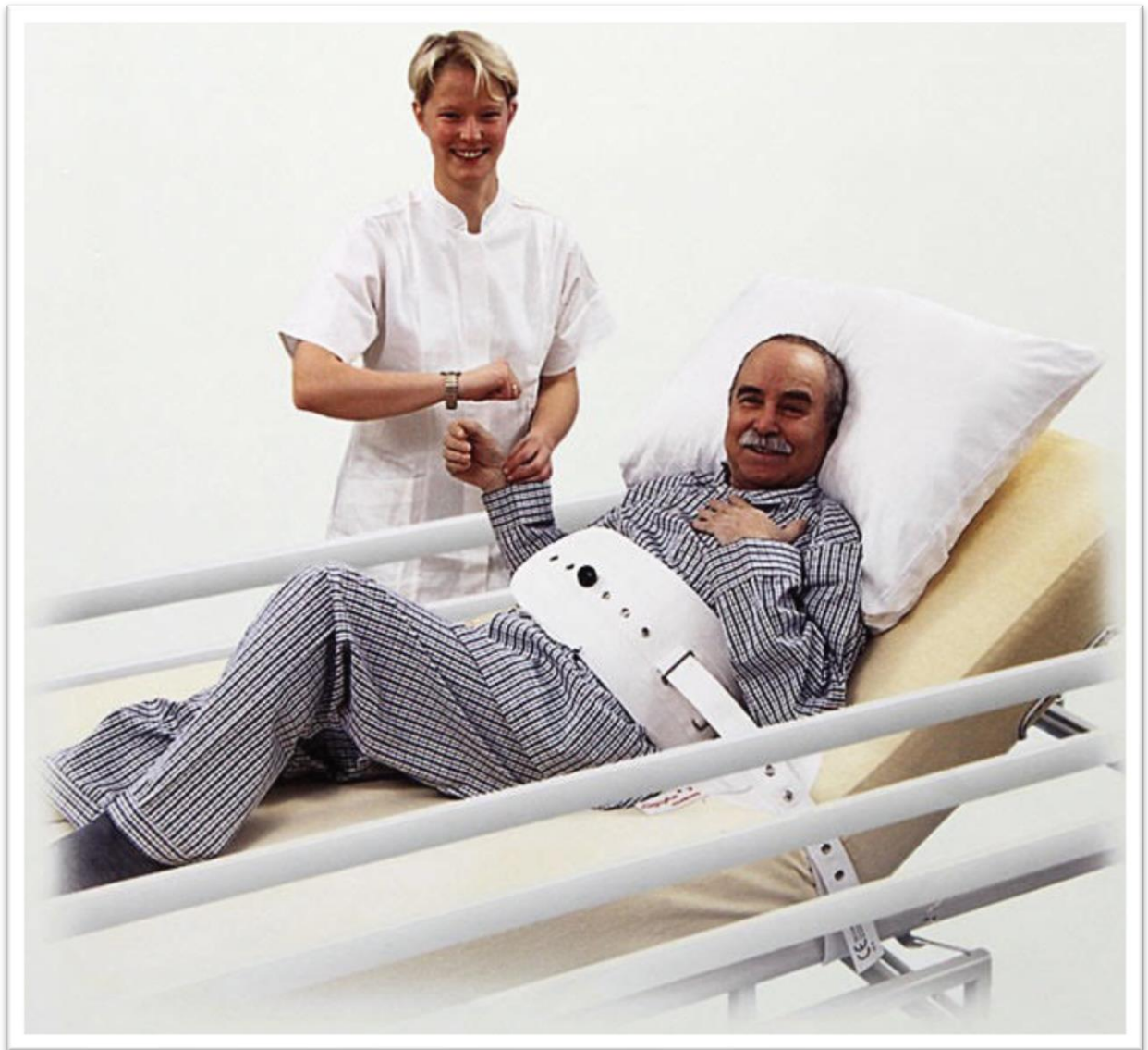
Slika 4.3. Sustav za humano sputavanje pacijenta.