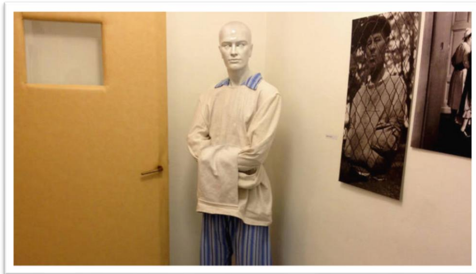
Slika 1.2. Stezulja.