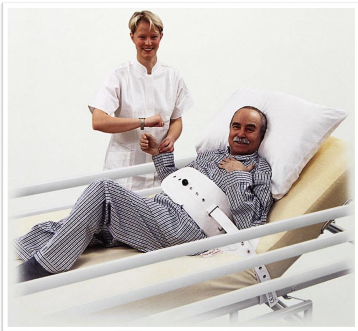
Slika 4.3. Sustav za humano sputavanje pacijenta.