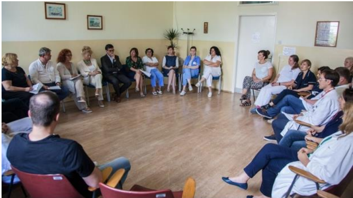
Slika 4.4.1. Prikaz grupne terapije.

Važno je analizirati faktore koje su dovele do incidenta. Važno je dati priliku pacijentu da iznese svoje viđenje incidenta, ako želi treba dobiti priliku i da pismeno opiše incident. Također je potrebno o incidentu razgovarati i sa drugim pacijentima koji su bili prisutni. Također treba dati priliku osoblju koje je sudjelovalo u incidentu da mogu iznijeti svoja iskustva, da mogu dobiti emocionalnu potporu i obnoviti osjećaj sigurnosti kako bi se mogli ponovno vratiti svojim obavezama na poslu. Važno je razgovarati o tome što osoblje/pacijent misli da je dovelo do incidenta i što bi se moglo napraviti drugačije, da li su postojale neke druge alternative. Ovo je posebno važno za evaluaciju strategije, edukacije osoblja i postupaka liječenja.