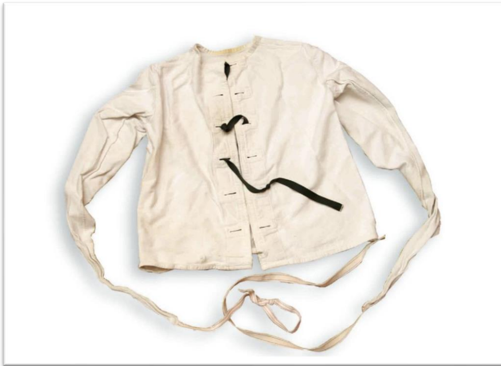
Slika 1.1. Stezulja.