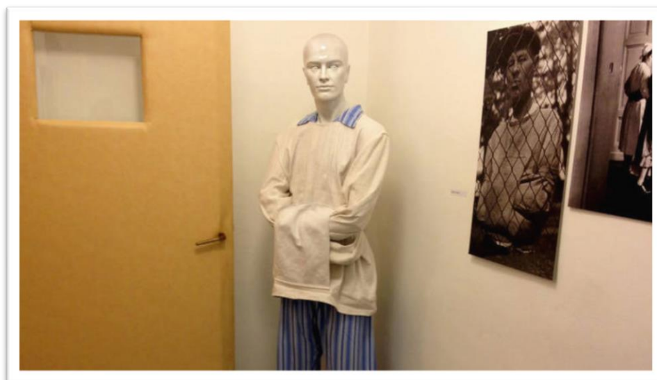
Slika 1.2. Stezulja.