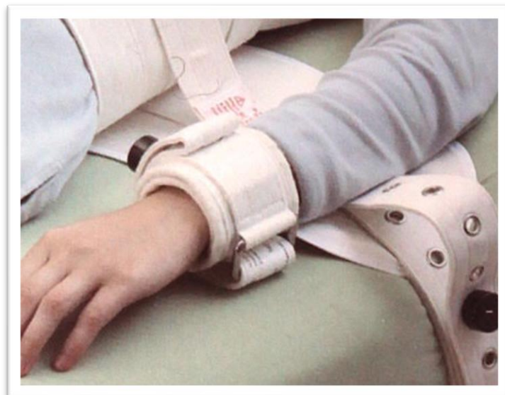
Slika 4.2. Prikaz metoda humang sputavanja. Izvor: http://www.panon-trade.hr/humano-vezanje-pacijenata.htm (Datum pristupa: 27.06.2018.)

Rizičnu situaciju koja ima potencijal za eskalaciju u fizičko nasilje treba prethodno procijeniti u kratkom vremenu. [13] Procjenjuje se stanje pacijenta kao i okolina u kojoj se situacija događa. Pacijentov govor tijela: tonalitet glasa, stiskanje šaka, stiskanje zubi, „prijeteći pogled“, sadržaj komunikacije (psovke, uvrede, prijetnje). Oblik prostorije i količina slobodnog prostora (vrata, prolazi, prozori), namještaj i oprema kao potencijalna prepreka ili opasnost za ozljedu (rubovi stolova, stolice, stalci za infuziju, ogradice bolesničkog kreveta, itd.)