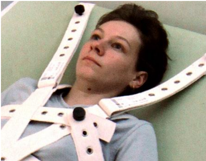
Slika 4.2.1. Sustav za humano sputavanje pacijenta.

Članovi obitelji psihijatrijskih bolesnika češće su u situacijama životne ugroze no što bismo zaključili iz anamneze, heteroanamneze ili informacija kojih dobivamo o pacijentu. Razlog tome je izbjegavanje priznanja o agresivnom ponašanju od strane pacijenta, a također i obiteljsko zaštitničko ponašanje prema pacijentu. Pacijent izbjegava reći istinu o svojem agresivnom ponašanju iz straha od posljedica i sukoba sa zakonom, dok obitelj izbjegava reći istinu zbog stigmatiziranja od strane društva ili također straha da člana obitelji ne bi doveli u probleme s zakonom. [3]