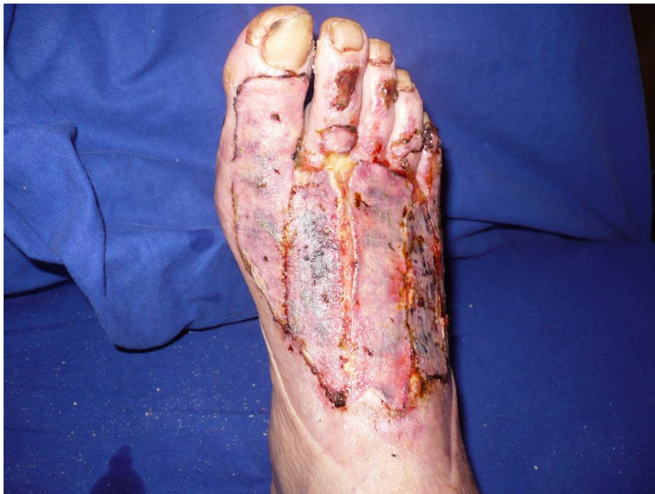
Slika 2.6.2. Uspješna transplantacija kože nakon opekline 3. stupnja