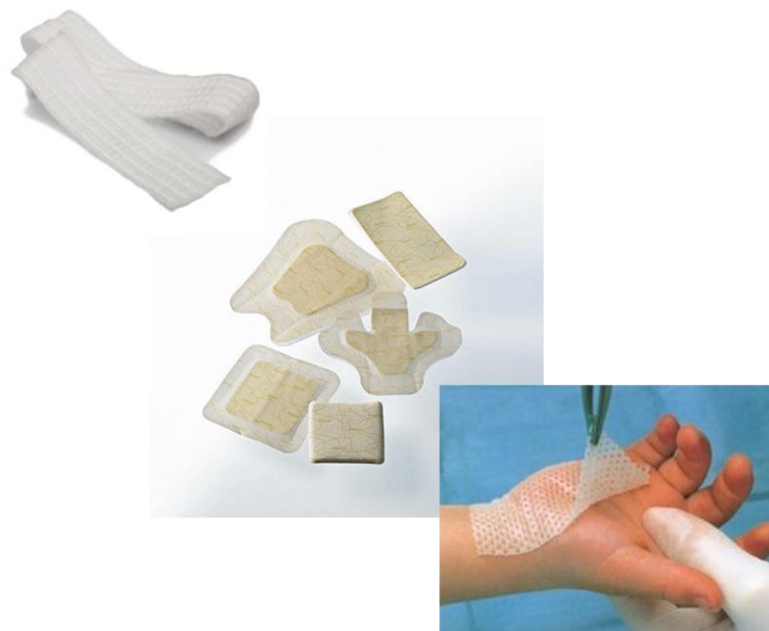
Slika 2.2.1. Neke vrste potpornih obloga

svim fazama cijeljenja. Hidrokoloidi su oblozi koji oblikuju nitasti polimeran matriks koji se koristi za cijeljenje rana u vlažnoj okolini. Hidrofiber obloge s visoko upijajućim svojstvom uz „zaključavanje“ ili geliranje vlage i sekreta iz rane. Mogu se primijeniti na sve oblike rana kao primarna i kao sekundarna obloga. Obloge s kolagenom sadrže kolagen koji pospješuje stvaranje granulacijskog tkiva. Upotrebljavaju se kod rana s umjerenom sekrecijom dna i granulacijskim tkivom. Poliuretanski filmovi su tanke polupropusne poliuretanske ljepljive obloge koje ne propuštaju bakterije te tako smanjuju rizik za sekundarne infekcije, a omogućavaju prolaz plinova i disanje kože. Kontaktne neljepljive mrežice sadrže parafinske masti ili kremu na bazi sintetičkih masti. Obloge sa srebrom . Srebro ima širok antibakterijski spektar djelovanja i antimikrobni učinak. Upotrebljavamo ih kod inficiranih rana. Obloge sa aktivnim srebrom i ugljenom utječu na većinu patogenih mikroorganizama uključujući i MRSU tako da vežu na sebe toksine i smanjuju neugodan miris. Postoje još razne obloge, a svima im je zajedničko ubrzavanje procesa cijeljenja te osiguranje dobrih uvjeta za kvalitetno cijeljenje.