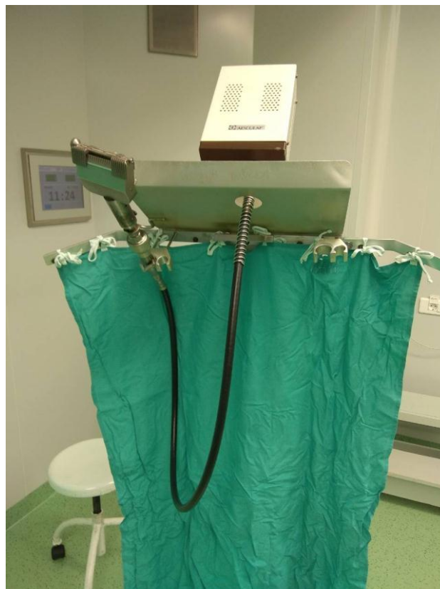
Slika 3.2.1. Sterilizirani instrumentarij - dermatom na stalku

mrežicom se kasnije apliciraju na ranu (slika 3.4.). Donorsko mjesto se zbrine od većih krvarenja odnosno na donorsko mjesto se postavlja prema nahodjenju operatera oblog. S obzirom na brojne suvremene potporne obloge, preporučljivo je staviti visoko upijajuće hidrofiber obloge te preko njih deblji sloj kompresa uz mekanu imobilizaciju. Donorsko mjesto se ostavlja spontanoj sanaciji kroz nekoliko dana. Na mjestu rane se postavlja neobrađeni ili obrađeni slobodni kožni transplantat (ovisno o tome da li se tijekom operacije radi meshiranje kože ili ne). U slučaju kada se nema mesh uređaja tada je moguće oštrim zarezivanjem malih proreza na transplantatu omogućiti kožnom transplantatu da secernira i drenira eventualnu krv i serom. Presadak kože se fiksira šavima, kopčama ili drugo, no u posljednje vrijeme se koristi jednostavnija i učinkovitija intra operacijska terapija negativnim tlakom. Naime, nakon postavljanja kožnih transplantata na predviđeno mjesto isti se mogu i fiksirati i drenirati aplikacijom sistema za negativnu terapiju odmah u operacijskoj sali. Nakon aktivacije negativnog tlaka i provjere operacijskog i donorskog mjesta, završava operacijski postupak.