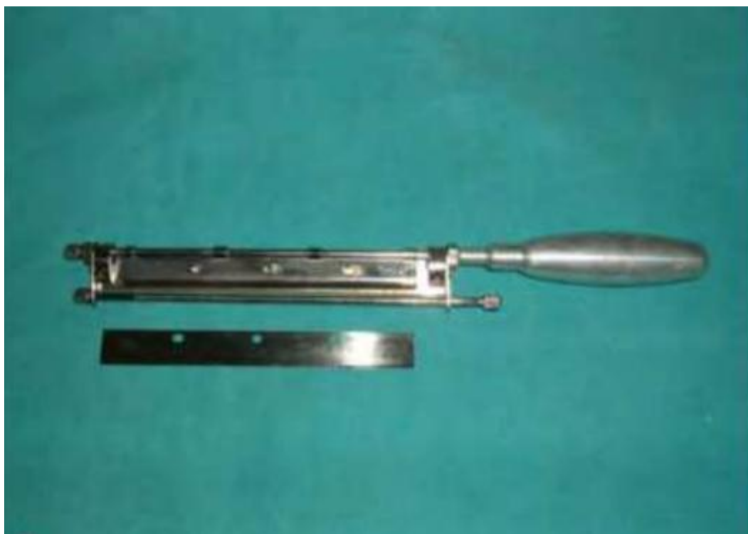
Slika 2.4.2. Watsonova modifikacija Humbyevog noža