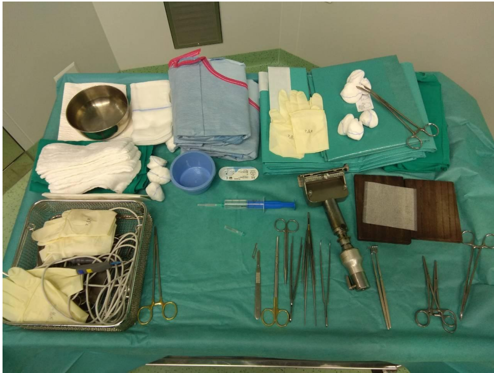
Slika 3.2.2. Sterilizirani instrumentarij na stolu instrumentara