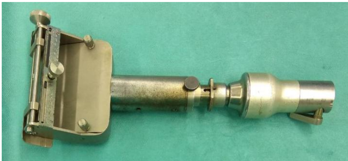
Slika 2.4.1. Dermatoma

Hambijevog nož ili modifikacije (slika 2.4.2.) ili posebnog kirurškog instrumenta tzv. dermatoma (slika 2.4.1.)