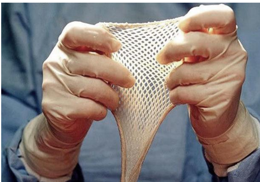
Slika 2.4.4.. Meshirani transplantat kože

se pokriva i veća površina od inicijalne površine uzetog Thierscha [21]. Ovaj način prilagođavanja kožnog transplantata potrebama je posebno pogodan za vrlo velike površine i za one na kojima se očekuje mnogo seroznog sekreta ili krvarenja iz rane s obzirom da je propustan. Na taj način se na mjestu odnosno ispod transplantata ne akumulira seroma niti hematoma, kao dobre podloge za infekciju. Mana ovog načina transplantacije je nepogodan kozmetički efekt jer se uvijek nakon završene epitelizacije vidi mrežasti uzorak i nije pogodan za vidljive dijelove tijela [22].