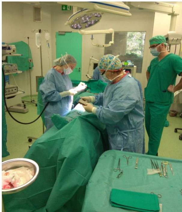
Slika 3.2.3. Operacijski položaj pacijenta, tima i opreme