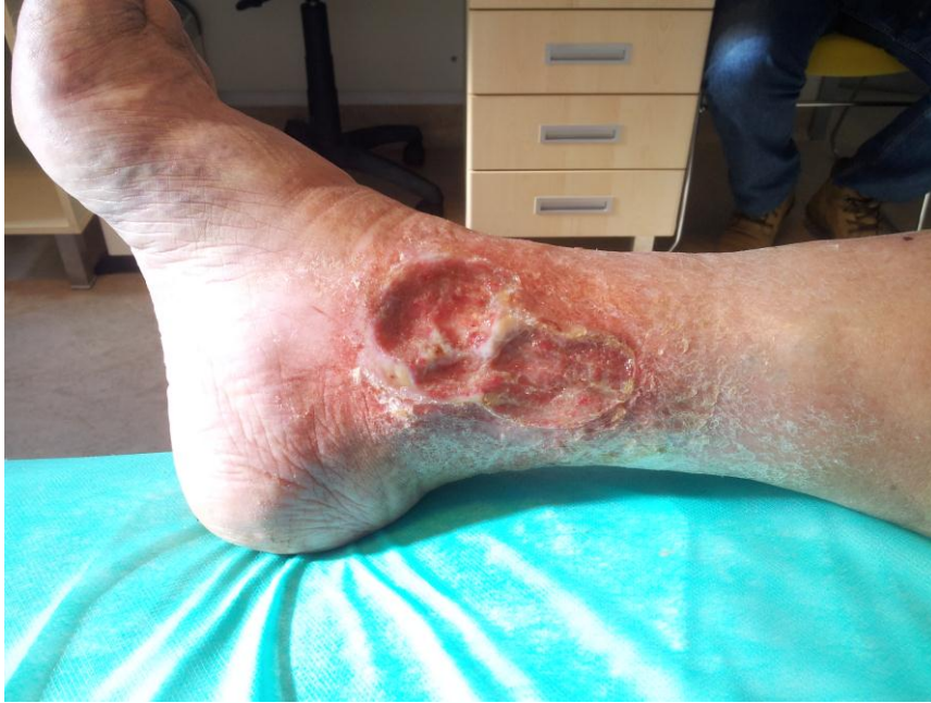
Slika 2.1.1. Kronični venski ulkus