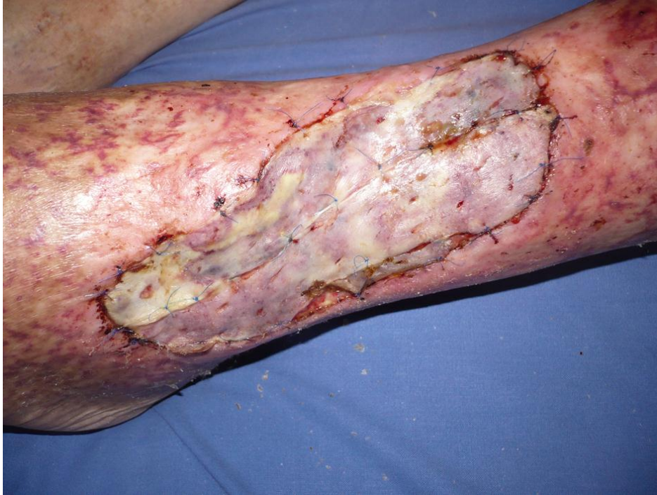
Slika 2.6.1. Uspješna transplantacija na potkoljeničnom ulkusu