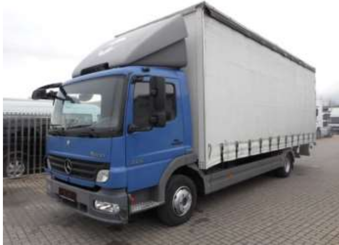
Slika 3.4 Kamion bez prikolice