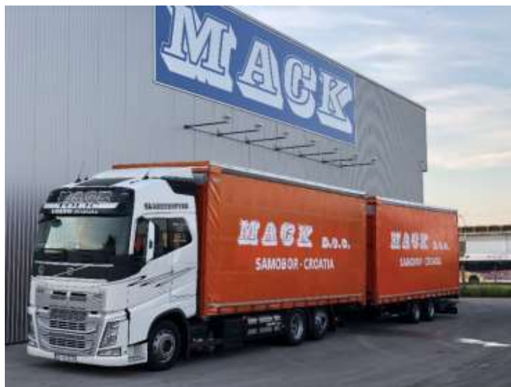
Slika 3.5 Kamion s prikolicom