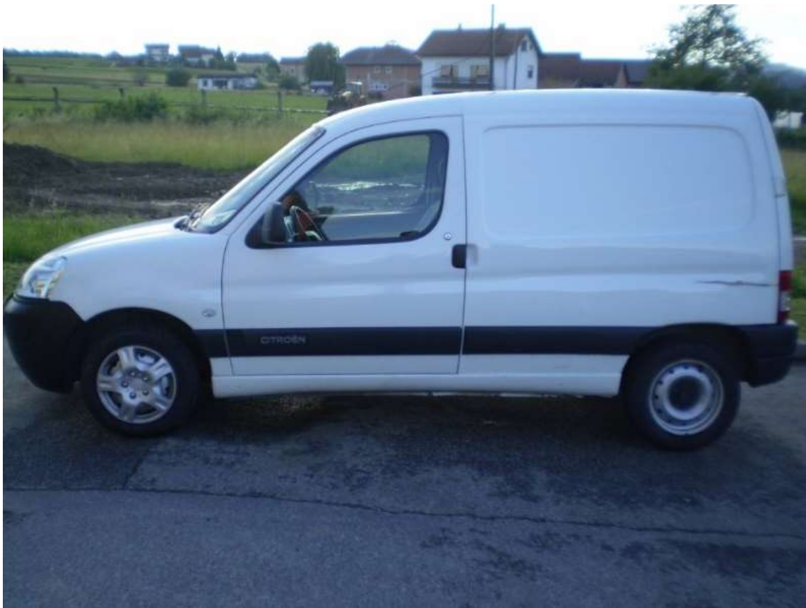
Slika 5.10 Citroen Berlingo