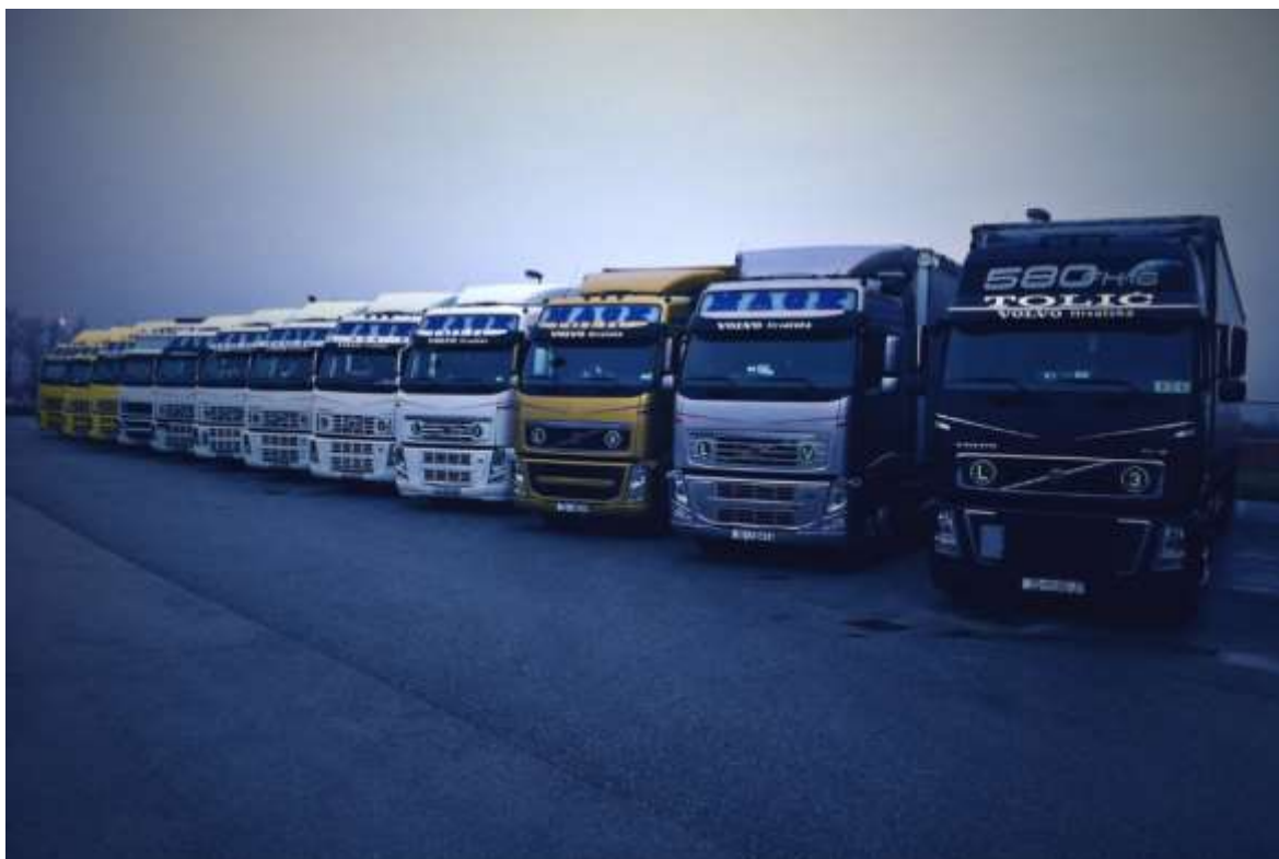
Slika 4. 9 Vozni park