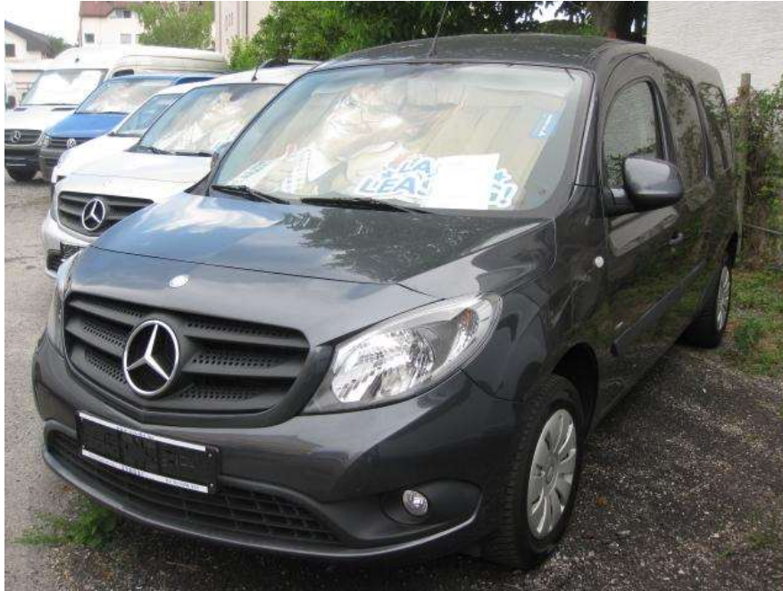
Slika 3.2. Dostavno vozilo