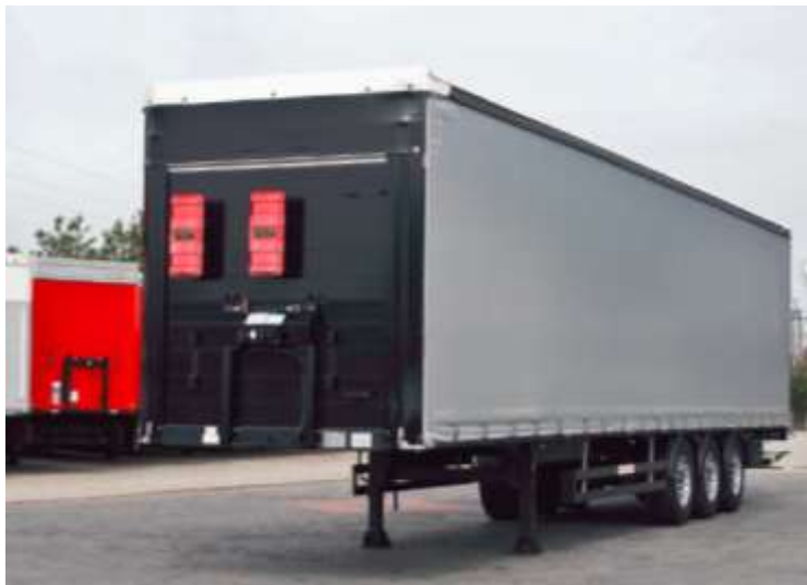
Slika 3.7 Poluprikolica