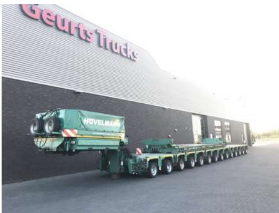
Slika 3.8 Poluprikolica za prijevoz specijalnih tereta