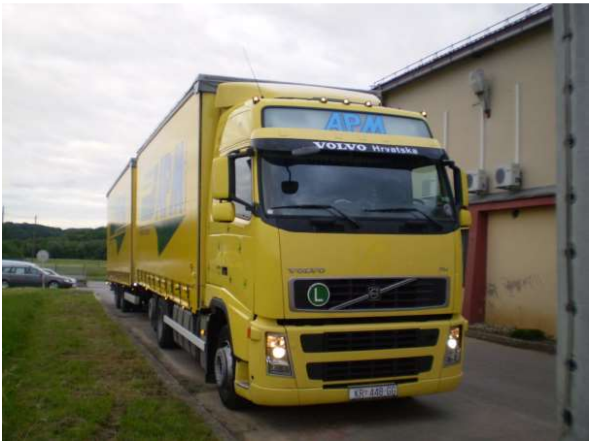
Slika 5. 13 Kamion Volvo