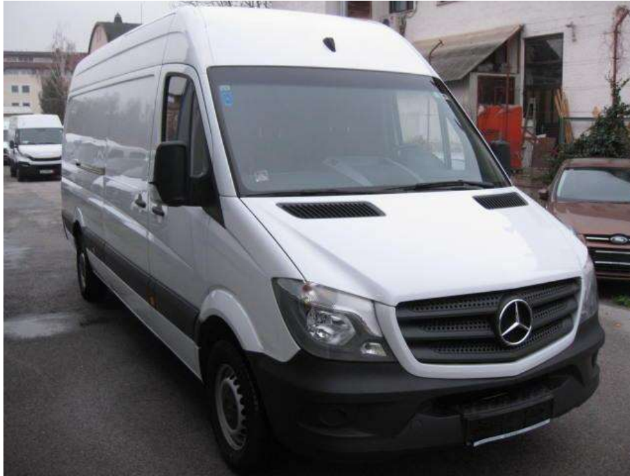
Slika 3.3 Kombi vozilo