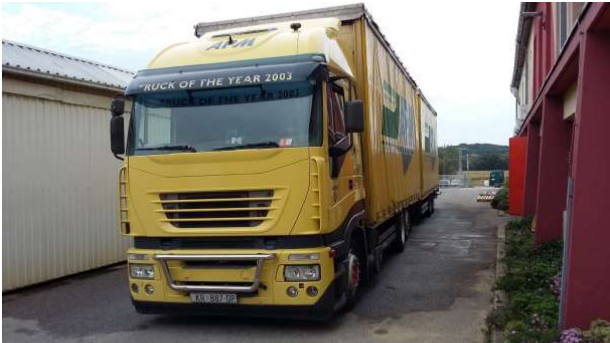
Slika 5. 12 Kamion Iveco