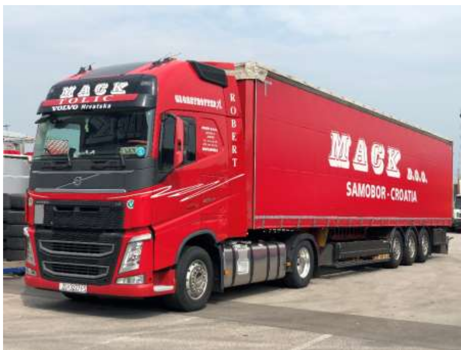
Slika 3.6 Tegljač s poluprikolicom