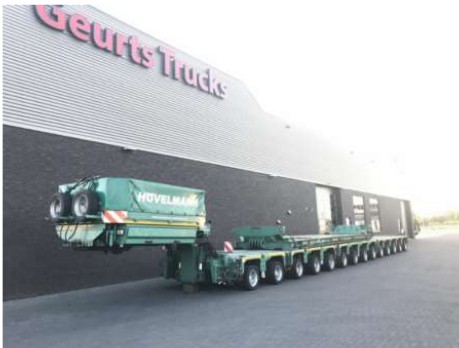
Slika 3.8 Poluprikolica za prijevoz specijalnih tereta