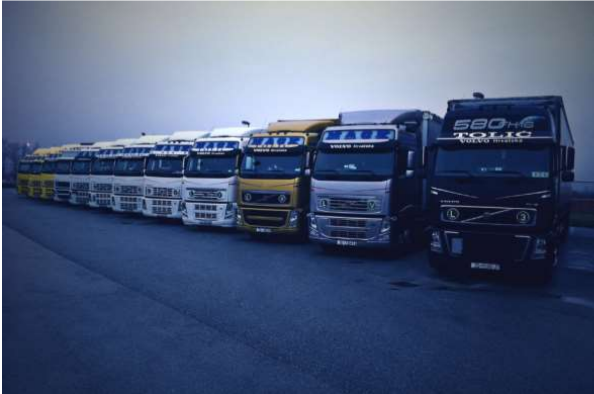
Slika 4. 9 Vozni park