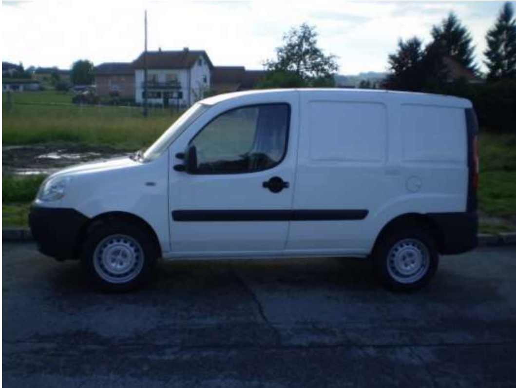
Slika 5. 11 Fiat Doblo