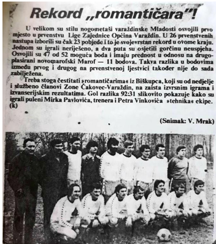
Slika 3: Članak u lokalnim medijima

U počecima djelovanja kluba jedini načini promoviranja su bili plakati koji su se lijepili na ogradu oko nogometnog igrališta i na popularnom reklamnom stupu u središtu naselja Biškupec. Besplatnu promociju je klub dobivao od strane lokalnih tiskanih medija koji su pratili uspjehe kluba tekstom i fotografijama te su izvještavali o situaciji sa terena.