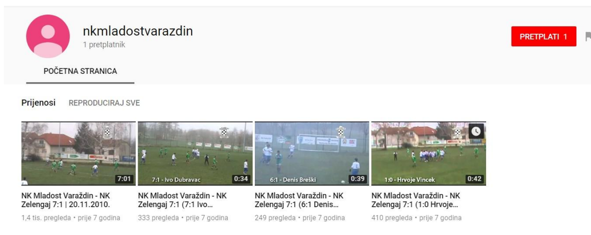
Slika 4: Youtube kanal

S početkom rada škole nogometa kluba, 2005. godine, jedan od tadašnjih trenera započinje sa pisanjem bloga u kojem izvještava o rezultatima utakmica mlađih kategorija i njihovim uspjesima. 2010. godine pokreće se Facebook stranica na kojoj su se objavljivale slike sa treninga i utakmica te je pokrenut i YouTube kanal na kojem su objavljivani videi sa najboljim trenutcima i golovima sa utakmica.