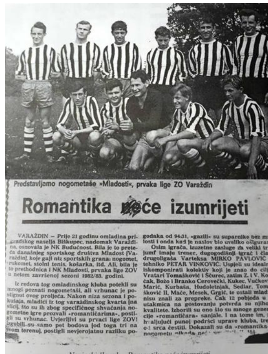
Slika 5: Prikaz članka u novinama

U ranijim fazama postojanja, zaštitni znak kluba bila je garnitura prepoznatljivih crno-bijelih dresova te nadimak „Romantičari“ koji su igrači stekli svojim izvanrednim izvedbama na terenu.[4]