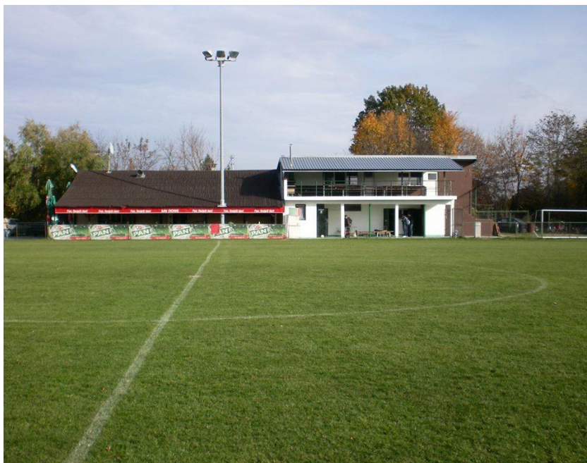
Slika 2: Teren i klubske prostorije