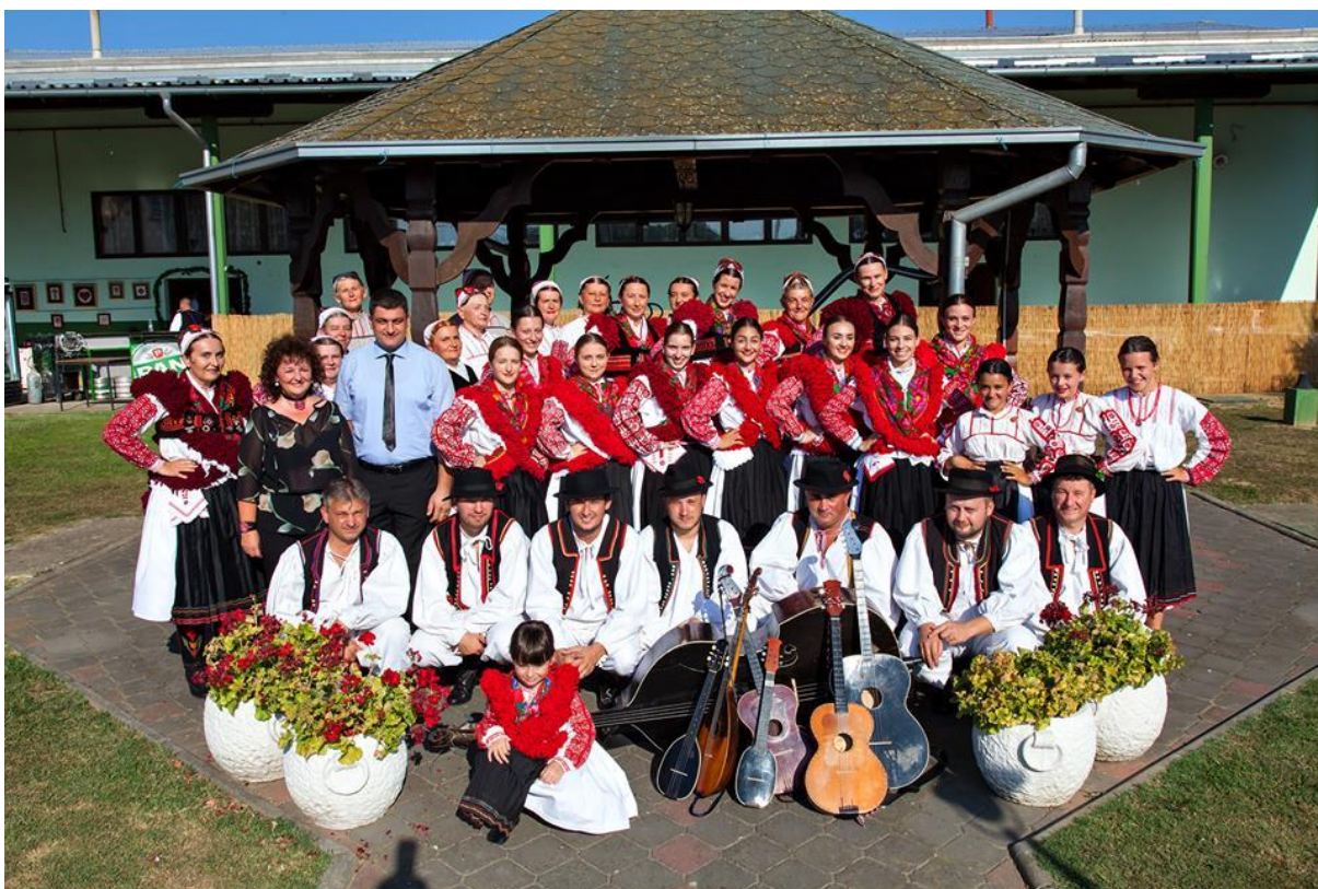
Slika 11. DIF Koprivnički Ivanec

naglasak na očuvanje izvornosti narodne nošnje, pjesama, plesova i običaja Župe Koprivničkog Ivanca. Nakon osamostaljenja Republike Hrvatske DIF Koprivnički Ivanec se ponovno aktivira i od tada djeluje neprekidno. Kroz odraslu i dječju folklornu skupinu, tamburašku skupinu i skupinu vezilja broji stotinjak članova. Najpoznatije i najznačajnije nasljeđe im je izvorna i živopisna narodna nošnja koja je posebno bogata ivanečkim vezom . „Ministarstvo kulture RH 2011. godine dodijelilo je umijeću izrade izvornog veza Koprivničkog Ivanca status nematerijalnog kulturnog dobra, na što su u DIF-u izuzetno ponosni i angažirani na predstavljanju ivanečkog veza te njegovom njegovanju i čuvanju od nestajanja.“ 27