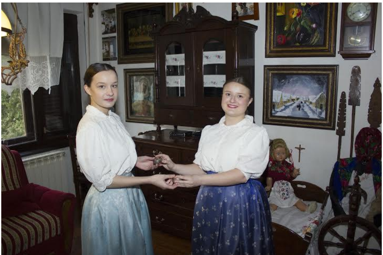
Slika 12. Članice KUD-a Delovi prikazuju običaj matkanja

Godine 2016. na inicijativu nekoliko entuzijasta osnovano je Kulturno-umjetničko društvo Delovi . U Društvu djeluje pedesetak članova koji tvore veliku i malu folklornu sekciju, veliku i malu tamburašku sekciju, dramsku sekciju, mali vokalni sastav te likovno-kreativnu sekciju. Važno je napomenuti kako su 2015. godine u suradnji s Udrugom žena iz Delova snimili običaj matkanja. To je običaj koji se još uvijek provodi u Delovima, a specifičan je za uskršno razdoblje i razmjenu pisanica. KUD Delovi su primili priznanje za izuzetna postignuća u području kulture i odgoju mladih te izniman doprinos razvoju i ugledu općine Novigrad Podravski. 28