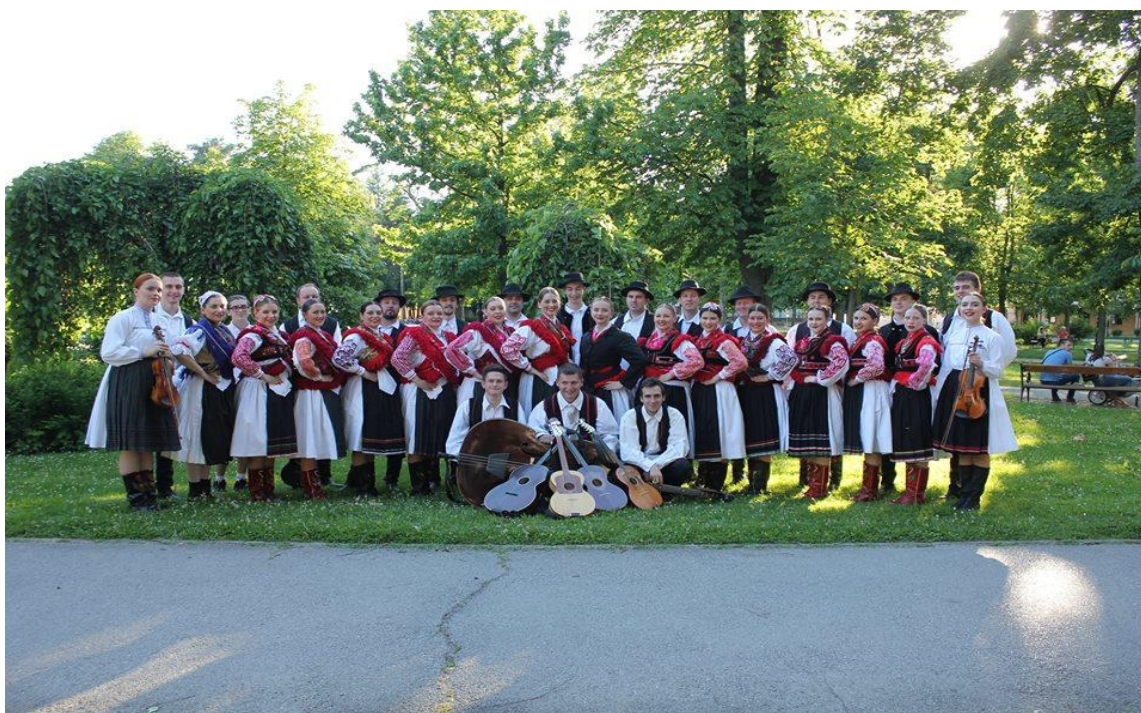
Slika 9. Folklorni ansambl Koprivnica