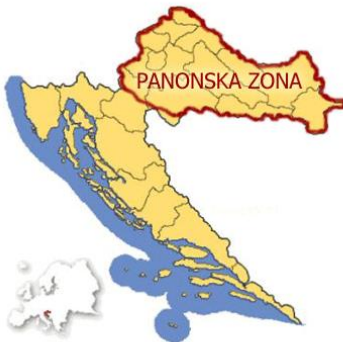
Slika 2. Panonska etnografska zona

Panonska etnografska zona obuhvaća Bilogoru, Posavinu, Turopolje, Slavoniju, Baranju i Vojvodinu. 20 Tamo pripada i područje koprivničke Podravine. Gledajući kartu može se uočiti utjecaj susjednih zemalja. Naime, susjedne zemlje (posebice Mađarska) imale su određeni utjecaj na tradicijske segmente i obilježja.