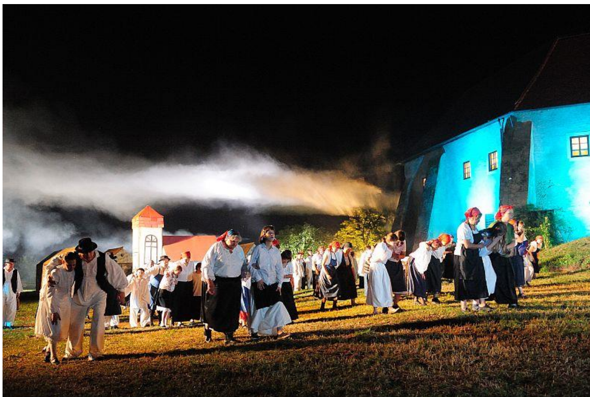
Slika 13. Picokijada