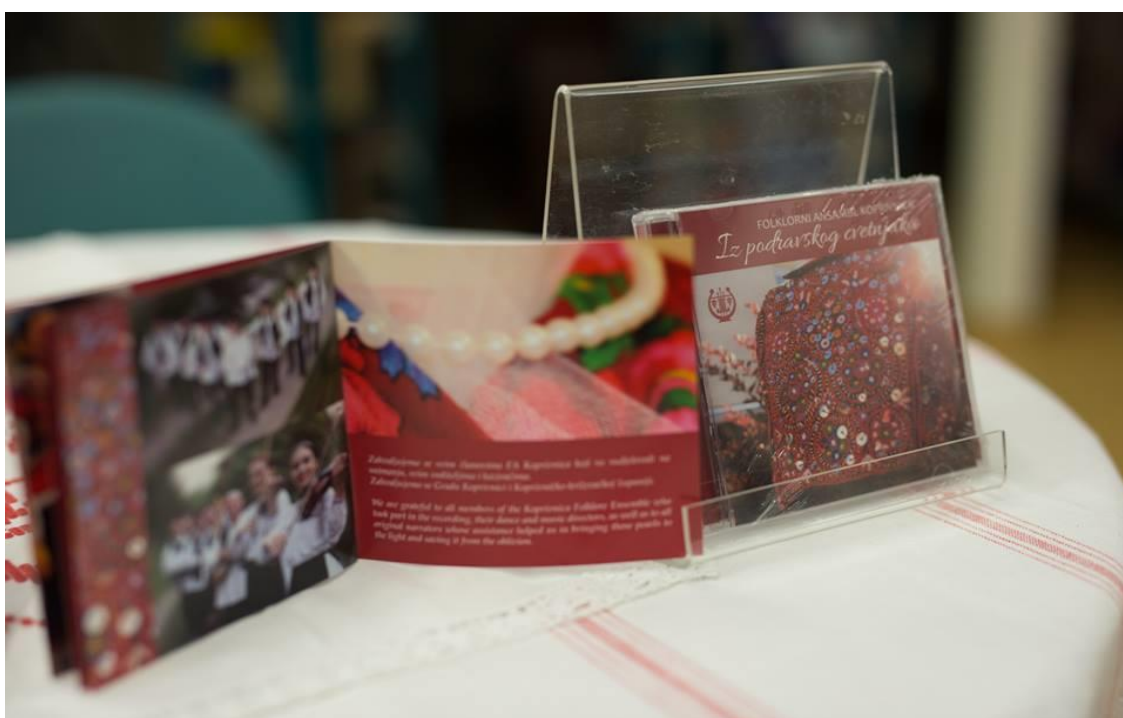
Slika 10. Nosač zvuka Iz podravskega cvetnjaka