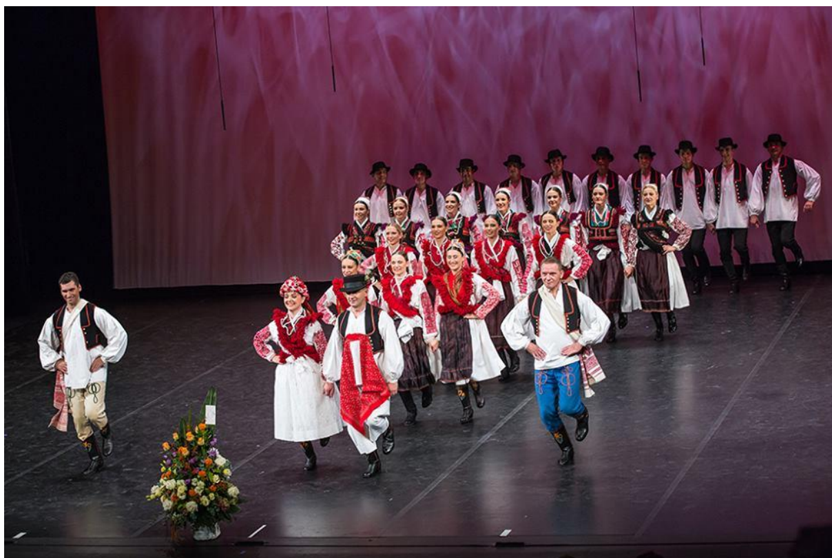
Slika 4. LADO – koreografija Podravski svati

U koprivničkoj Podravini često se mogu vidjeti prikazi različitih obreda poput odlazaka momaka u vojsku ili svatova. „Svadba je svakako najvažnija životna prigoda pojedinca u kojoj plesanje ima ritualan karakter“ (Zebec 2016: 225). Zanimljivo je kako se tijekom svadbenih običaja ispituju mladenkine kvalitete, a najčešće se provjerava je li šepava tako što se plešu drmeši, polke ili neki drugi plesovi (isto, 225–226). Stanovnici koprivničkog kraja s ponosom mogu reći kako i jedini profesionalni folklorni ansambl u Hrvatskoj Ansambl narodnih plesova i pjesama LADO izvodi poznatu koreografiju dr.sc. Ivana Ivančana nazvanu Podravski svati koja zorno prikazuje običaj svatova u koprivničkoj Podravini.