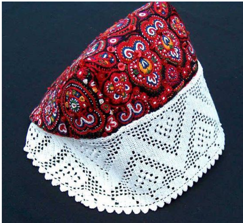
Slika 7. Poculica ukrašena ivanečkim vezom i čipkom

Važno je spomenuti i rukotvorstvo izrade čipke. Naime, Podravke su svoje kapice (poculice) ukrašavale čipkom odnosno (kako su one to nazivale) špicama. „Vještijim ispreplitanjem niti čipkarice su izrađivale čipku u raznim motivima i ornamentima“ (Benc-Bošković 1986: 8).