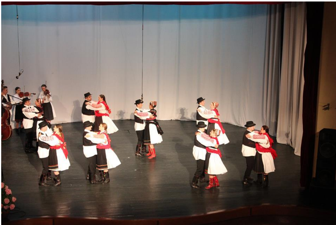
Slika 3. Podravski drmeš (ples u paru)

Najvažnija stilaska karakteristika tradicijskih plesova panonske plesne zone jest drmanje. Upravo prema toj osobitosti se takvi plesovi nazivaju drmeši. Navedeno plesanje karakteriziraju izraziti vertikalni titraji. Mogu se razlikovati dvije vrste titraja, a to su oštri i blagi. Naime, u Podravini se pleše vrlo oštro. Plesovi se često izvode u zatvorenom kolu koje može biti veće ili manje. Plesači u kolu pružaju ruke ne prvoj, već drugoj osobi do sebe te su tako tijela zbijena jedno do drugoga. Rukama se hvataju sprijeda ili iza struka te se najčešće kreću u smjeru kazaljke na satu. Naravno, mogu se susresti i plesovi u paru kao što su na primjer drmeš i grizlica , ali i solistički plesovi poput moldovana (usp. Ivančan 1971: 32–35 i 64).