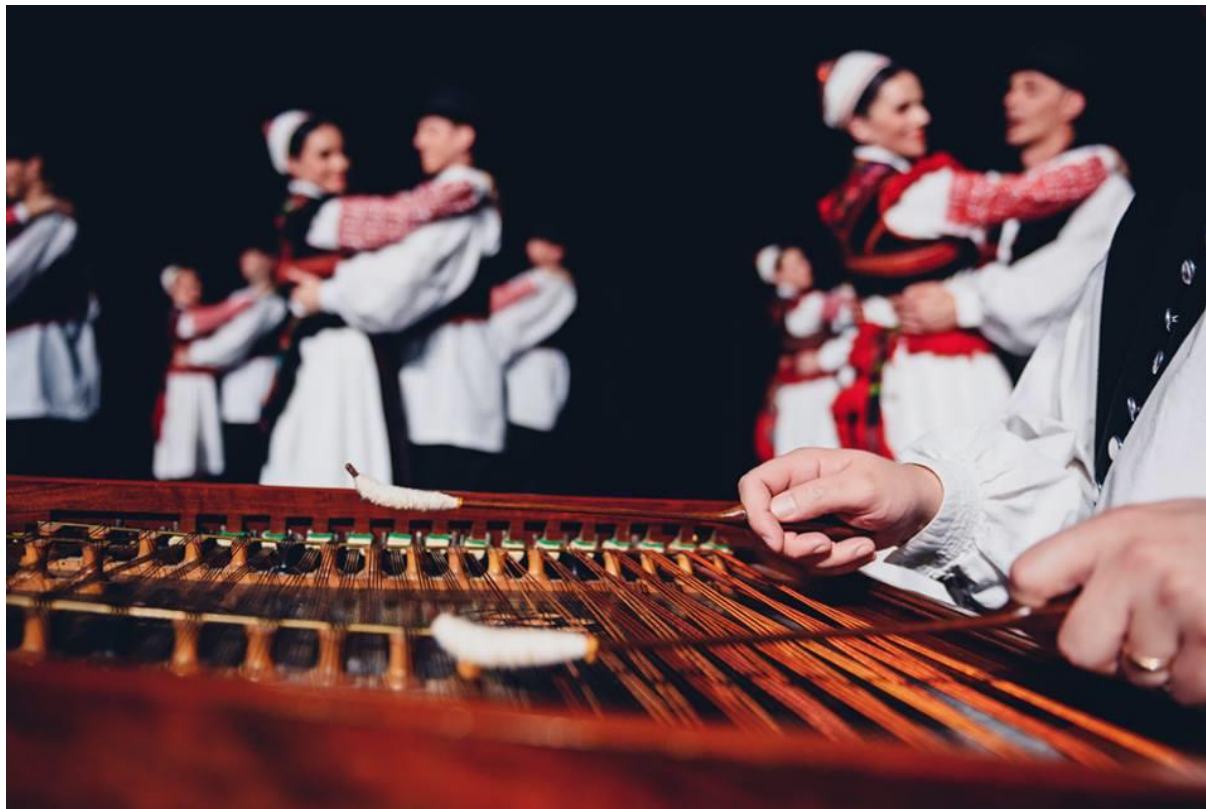
Slika 5. Cimbal

kojoj svirač melodiju izvodi trzanjem određenih žica kojima dužinu skraćuje pritiskom prstiju ili drvenog štapića. Nadalje, cimbal je žičano glazbalo trapezoidnog tijela. Svirač o žice udara dvama batićima omotanim tkaninom. Katkad se svira solistički no ipak češće u sastavu s drugim glazbalima (isto).