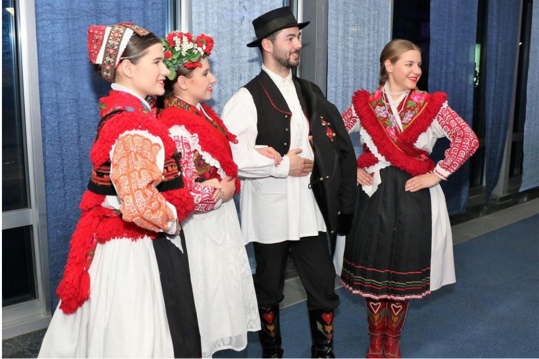
Slika 8. Narodna nošnja Koprivničkog Ivanca