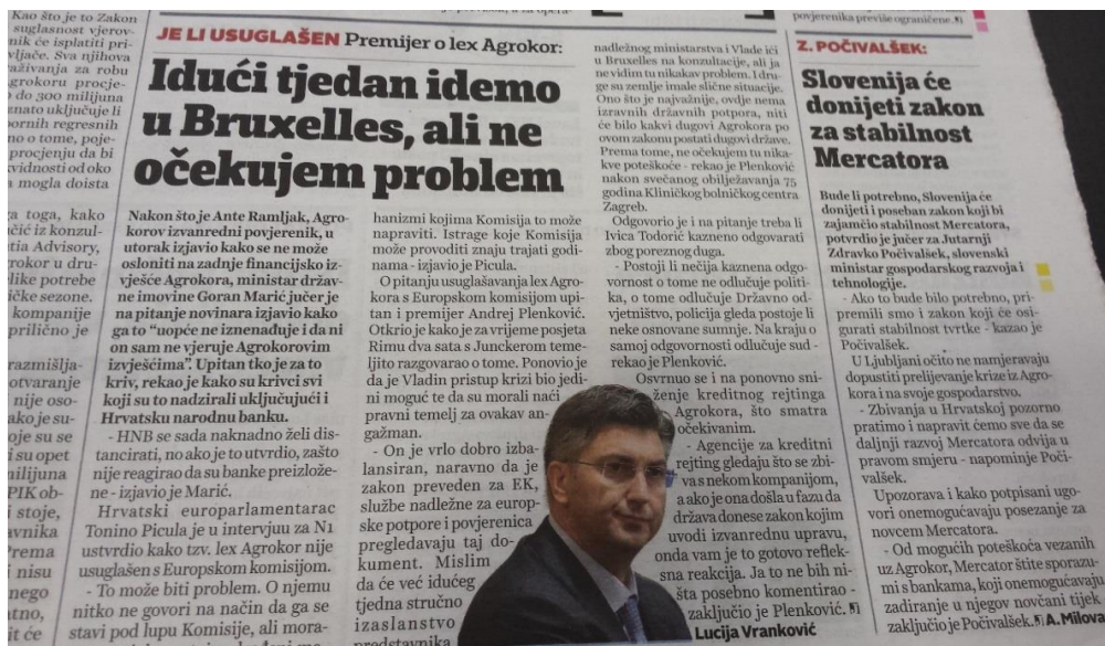
Ilustracija 3.4. Presnimka teksta o „ aferi Agrokor“ u Večernjem listu