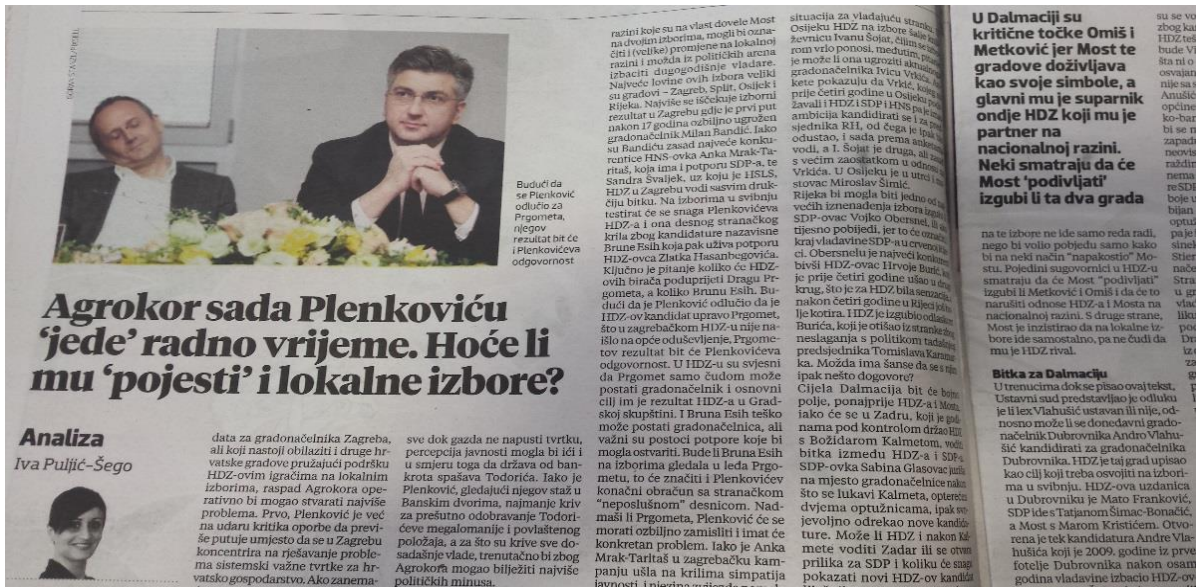
Ilustracija 3.4. Presnimka izvještaja iz Jutarnjeg lista

Arbitraža, treba platiti troškove takse, nakon toga se plaća i angažman arbitra, a plaćaju i troškovi tajništva arbitražnog suda. U Hrvatskoj, kada pravnik, sud ili arbitar, a da je to osoblje, to su i običajni, pravni stručnjaci koji, također, treba platiti. Ipak, ne može se očekivati troškovi koji su 20 milijuna dolara i nije uobičajeno "prekomjerno granatiranje od MOL-a", kako neki optičari vladu troškove koje je MOL prikazivao. To je bio, kako nam izvori bliski MOL-u, i jedan način nastajanja plaćanja stranu. Isteći je ujed oduzima i razlika rekao da troškovi mogu biti razumljivi. Ovi su podaci, prema nezadivnim informacijama od izvora upoznatih sa slučajem Ina-MOL, upola manji od iznesenih, ali su i dalje arbitraža, treba platiti troškove takse, nakon toga se plaća i angažman arbitra, a plaćaju i troškovi tajništva arbitražnog suda. U Hrvatskoj, kada pravnik, sud ili arbitar, a da je to osoblje, to su i običajni, pravni stručnjaci koji, također, treba platiti. Ipak, ne može se očekivati troškovi koji su 20 milijuna dolara i nije uobičajeno "prekomjerno granatiranje od MOL-a", kako neki optičari vladu troškove koje je MOL prikazivao. To je bio, kako nam izvori bliski MOL-u, i jedan način nastajanja plaćanja stranu. Isteći je ujed oduzima i razlika rekao da troškovi mogu biti razumljivi.