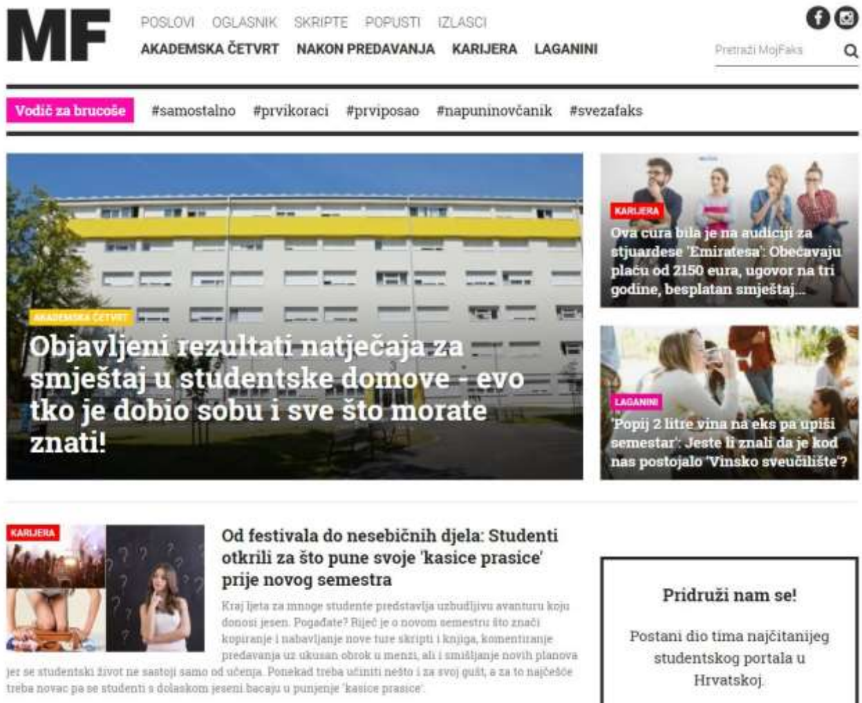
Slika 4. Naslovna stranica portala MojFaks

Na samom vrhu stranice portala MojFaks s lijeve strani nalazi se logo. Desno od njega nalaze se oglasi, poslovi u ponudi, popusti, izlasci, ali skripte. Ispod toga navedene su rubrike portala: Akademski četvrt, Nakon predavanja, Karijera i Laganini. U istoj ravnini se nalazi i tražilica te poveznice za društvene mreže Facebook i Instagram. Ispod naslovne trake nalazi se rubrika Vodič za bruce s popularnim oznakama kao što su #prvuposao #svezafaks i tako dalje. Navedena rubrika vrlo malo se koristi, stoga smatram da nema potrebe biti toliko izražena na stranici. Ispod navedene rubrike nalaze se tri izdvojena teksta, po jedan iz svake rubrike, odnosno radi se o posljednje objavljenim tekstovima u tim rubrikama. Ispod istaknutih tekstova nalaze se i ostali nedavno objavljeni tekstovi te poziv za one koji žele postati dio njihovog tima. Za razliku od dva prethodno navedena portala, MojFaks nema mogućnost povratka na početak stranice s jednim klikom već se to mora napraviti putem klizne trake ili kotačićem na mišu.