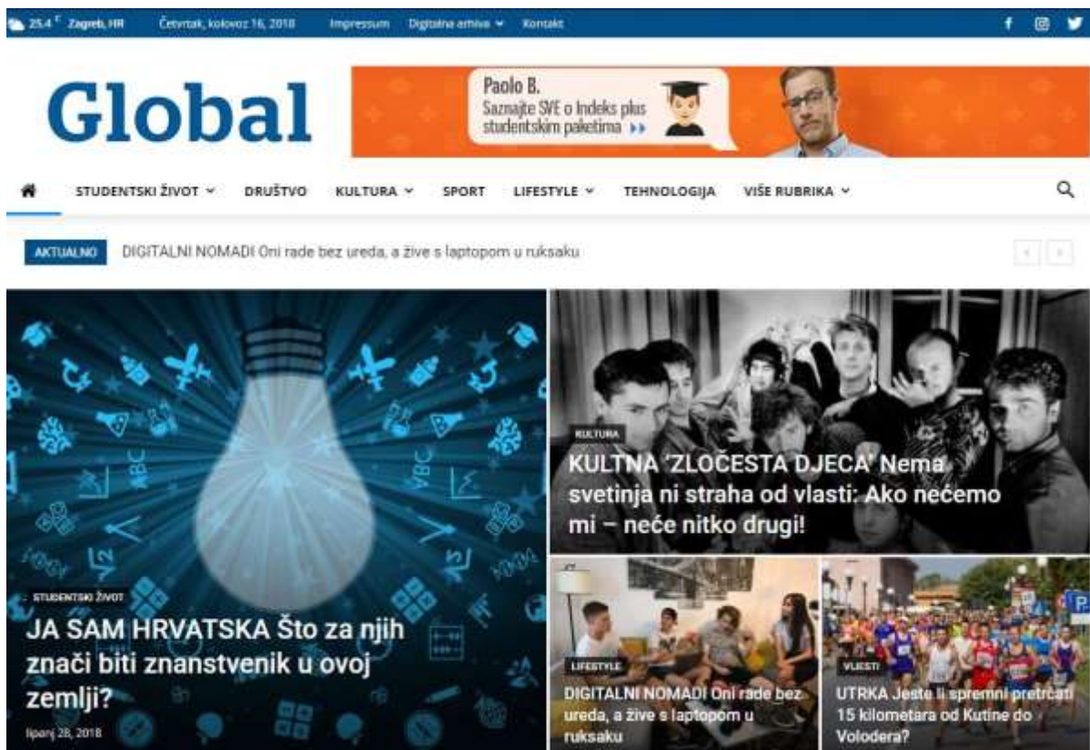
Slika 3. Naslovna stranica portala Global

Na stranici portala Global na samom vrhu nalaze se informacije o trenutnoj vremenskoj prognozi u Zagrebu te datum i godina. Zatim slijede poveznice na Impressum, digitalnu arhivu, kontakt i poveznice na društvene mreže: Facebook, Instagram i Twitter. Ispod se nalazi njihov logo i banner s oglasima. Zatim dolazimo do trake s rubrikama i podrubrikama, kućicom za povratak na početnu stranicu te tražilice. Portal Global ima sedam rubrika te 22 podrubrike. Prva rubrika je Studentski život s podrubrikama: Erasmus, HumansofUniZG, Što te muči, Prouči i Studensk@psiha. Druga je Društvo, zatim slijedi Kultura: Film, Glazba, Kazalište, Književnost i Vizualna umjetnost. Sljedeći je Sport te Lifestyle: Hrana, Moda, Putovanja, Zdravlje. Na posljertku se nalazi Tehnologija i dio označen Više rubrika koji sadrži podrubrike: Vijesti, Intervju, Svijet, Karijera, Novac, Srednja, Reportaža, Fotoreportaža, Komentari. Ispod trake s rubrikama nalaze se izmjenjujuće aktualnosti te posljednje objavljeni tekstovi. Kada se spuštate na stranici portala naslovna traka vas ne slijedi, ali se pojavljuje plava strelica koja omogućava povratak na početak. 36