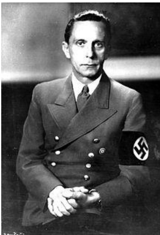
5.2. Joseph Goebbels

Upravitelj kulturnog života i šef propagande u Trećem Reichu bio je Paul Joseph Goebbels. Službeno je nosio titulu ministra narodnog prosvjete i propagande. Na tu dužnost stupio je 13. ožujka 1933. godine, odmah po dolasku nacista na vlast. Bio je u Hitlerovom najužem krugu i njegov veliki obožavatelj. Njegovi su govori bili energični i sadržavali su antisemitske stavove. On je svoje govore koristio kao propagandno sredstvo. Bio je nejake građe, a zbog bolesti kosti od koje je obolio u djetinjstvu doživotno je šepao. Školovao se u uglednim školama, a na kraju završava fakultet i to s diplomom iz povijesti i književnosti, a kasnije stječe i doktorat pod mentorstvom profesora koji je bio Židov. (Knopp, 2007: 26)