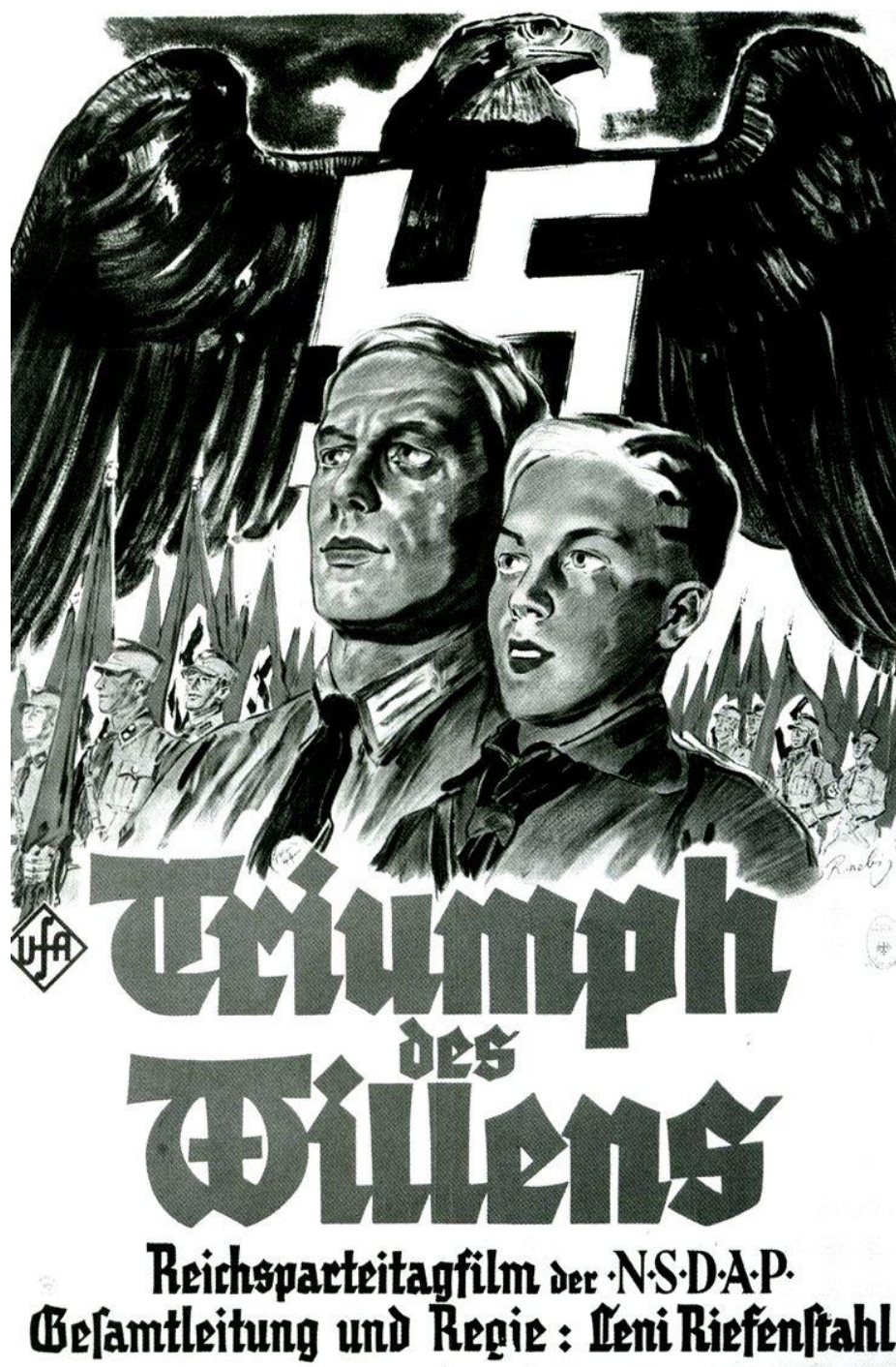
5.4. Plakat za film Trijumf volje

Sam film je bio snimljen na kongresu NSDAP-a u Nürnbergu koji se održao od 5. do 10. rujna 1934. godine.