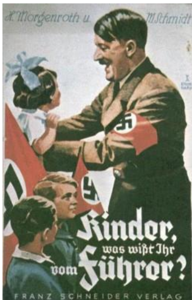
5.3. Primjer propagandnog postera

Propaganda je definirana kao „organizirano širenje usmenim ili pismenim putem ideja radi oblikovanja javnog mnijenja i ostvarenja planiranih ciljeva. (Anić, Goldstein, 2004: 758.) Kod propagande je važno da je njena poruka dostupna, privlačna, razumljiva svakome i uvjerljiva. Također, bitno je da i ciljana osoba obrati pozornost na nju, shvati je i prepusti se, odnosno prihvati je. (prema: Komar i Sokolić, 1992.) Kako bi se poruka uspješno širila potrebni su mediji.