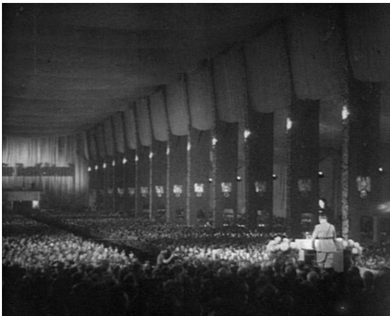
5.1. Hitler drži govor

Nakon što je Hitler završio u zatvoru poslije neuspjelog puča, od tamo Rudolfu Hessu diktira poglavlja svoje knjige koja je kasnije objavljena pod nazivom Mein Kampf . Knjiga je krajnje zbunjujuće napisana i uređena, no jedna je stvar u njoj jasna: Hitler je imao svoje zamisli o kulturi, filmu, kazalištu, ali i osobnim odnosima ljudi pa tako i o spolnim bolestima i slično. On u knjizi piše i o tome kako se Njemačka mora vratiti na putove stare slave te zauzeti teritorije koji im, prema njegovom razmišljanju, pripadaju. Tako je propaganda bila uglavnom usmjerena prema Lebensraum , odnosno životnom prostoru za Nijemce, potpunom istrebljenju Židova, uništavanju slavenske kulture i korištenju Slavena kao robova. Naravno, ta je ideologija i propaganda kasnije postala okosnicom u Trećem Reichu.