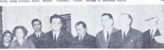
Slika 3: Varaždinske vijesti br. 1304 (10. 12. 1969.), str. 3. Izvor: