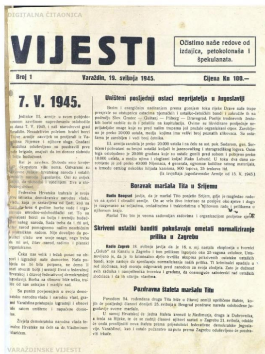
Slika 1: Naslovna stranica prvog broja Vijesti, (19. 5. 1945.).

https://library.foi.hr/novine/broj1.aspx?v=0&z=563&C=3&godina=1945&broj=000001&F=&H=&vrsta=&grupa=&lang=&stranica=001 , pristupano rujan 2018.