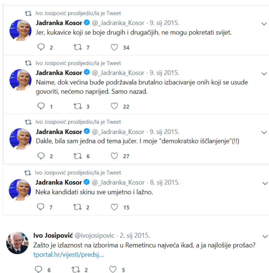
Slika 4: Josipovićeve objave kao „podbadanje“, izvor: https://twitter.com/ivojosipovic , dostupno na dan 04.02.2019.