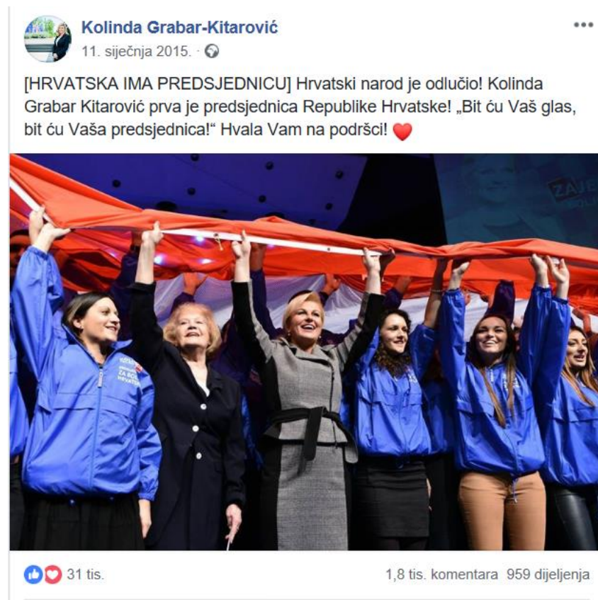
Slika 8: Zahvala predsjednice na podršci

Uspješnom i vrlo skupom izbornom kampanjom, Kolinda Grabar-Kitarović pobijedila je na izborima za predsjednika, te tako postala prva ženska predsjednica Republike Hrvatske u povijesti te zemlje. Nakon emotivnog nastupa u medijima koji su uživo prenosili stanje iz stožera kandidata, objavom na Facebooku se predsjednica Republike Hrvatske zahvalila svima na podršci te obećala da će biti prije svega predsjednica građana.