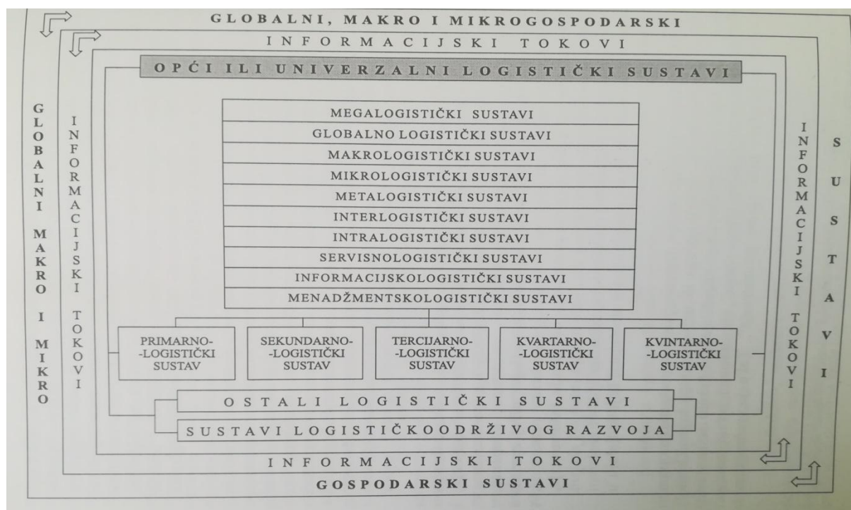
Shema 1. Struktura općeg ili univerzalnog logističkog sustava.

Izvor: Zelenika, R. (2005): "Logistički sustavi", Rijeka: Ekonomski fakultet Sveučilišta u Rijeci, str.216