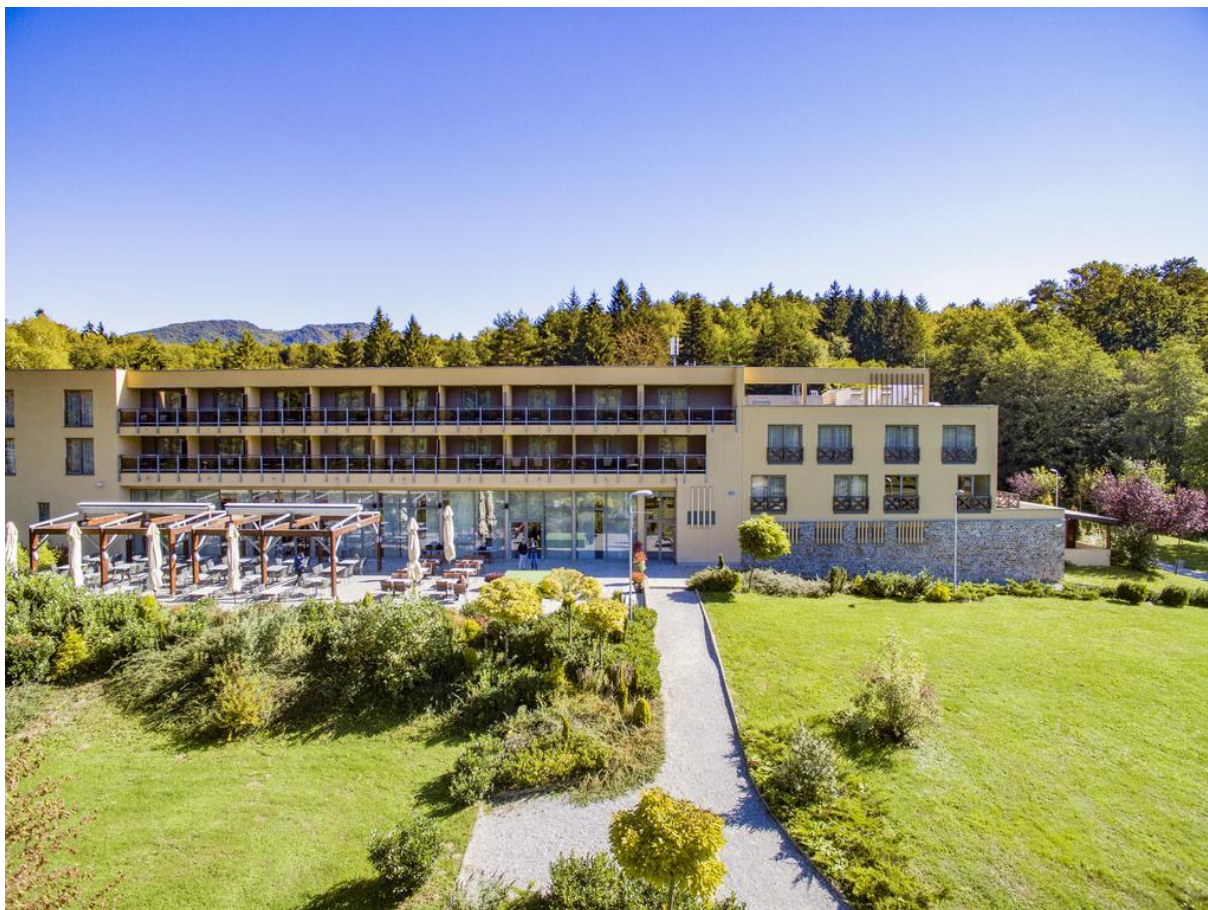
Slika 6 Hotel Trakošćan