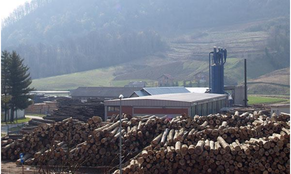
Slika 1 Skladište trupaca pilana Bednja