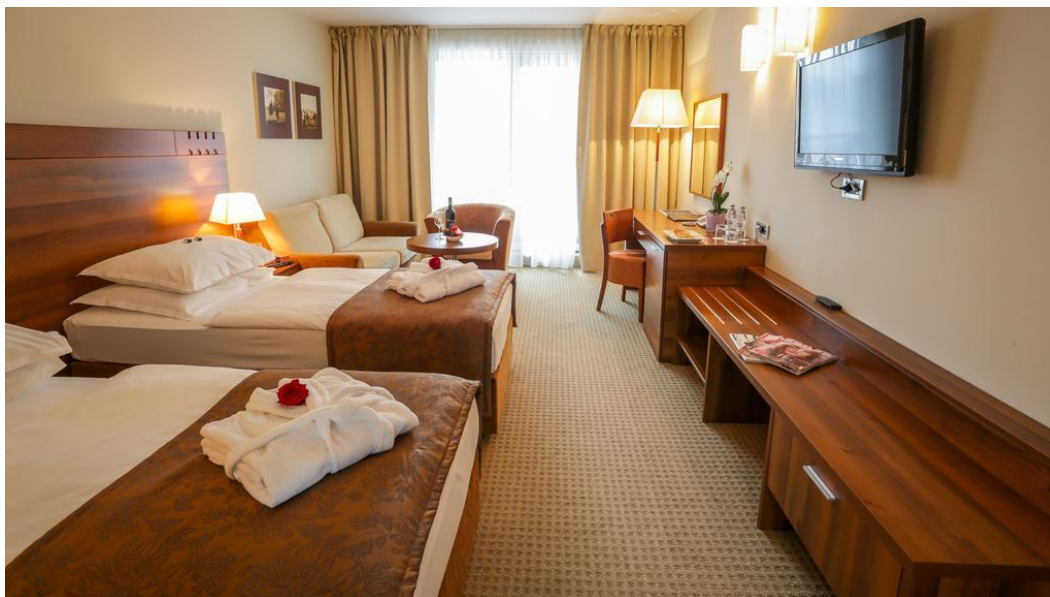
Slika 7 Soba Hotela Trakošćan