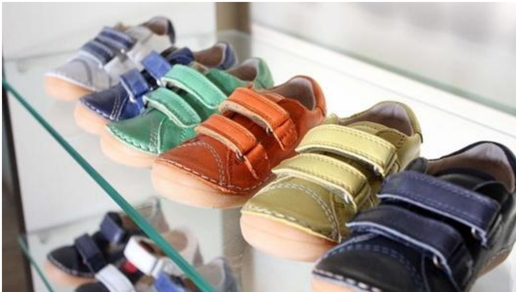
Slika 5 Proizvodi Ivančice d.d.

Vlastiti proizvodi se prodaju kroz vlastitu maloprodajnu mrežu i web shop u RH, te kroz off i on-line veleprodajne kanale u inozemstvu. Froddo proizvodi izvoze se u 42 zemlje, a prodaju se na više od 1.200 prodajnih mjesta. Najznačajnija izvozna tržišta su zemlje EU, prije svega Njemačka, Ujedinjeno Kraljevstvo, Francuska i Češka, te tržišta BIH i Srbije. Značajne marketinške i prodajne aktivnosti usmjerene su na jedinstveno tržište EU gdje je veća kupovna moć, a kupci su orijentirani na kvalitetu proizvoda. Strategija rasta poslovanja bazira se na povećanju prodaje na inozemnim tržištima. Sukladno tom cilju prisutni su na svim značajnijim sajmovima obuće u Europi, te su povećane aktivnosti prodaje direktno i putem zastupnika za pojedina tržišta. Rast prodaje podržan je brigom i odgovornošću prema kupcu. Krajem 2017. godine maloprodajna mreža brojala je 29 prodajnih mjesta uključujući WEB shop koji zauzima značajnu poziciju u ukupnom prometu maloprodajne mreže. Glavne kategorije robe u Froddo shopovima su Froddo obuća te dječja odjeća, a na nekim lokacijama i ženska obuća i modni dodaci. Slika 5 prikazuje proizvode Ivančice d.d., Froddo dječja obuća.