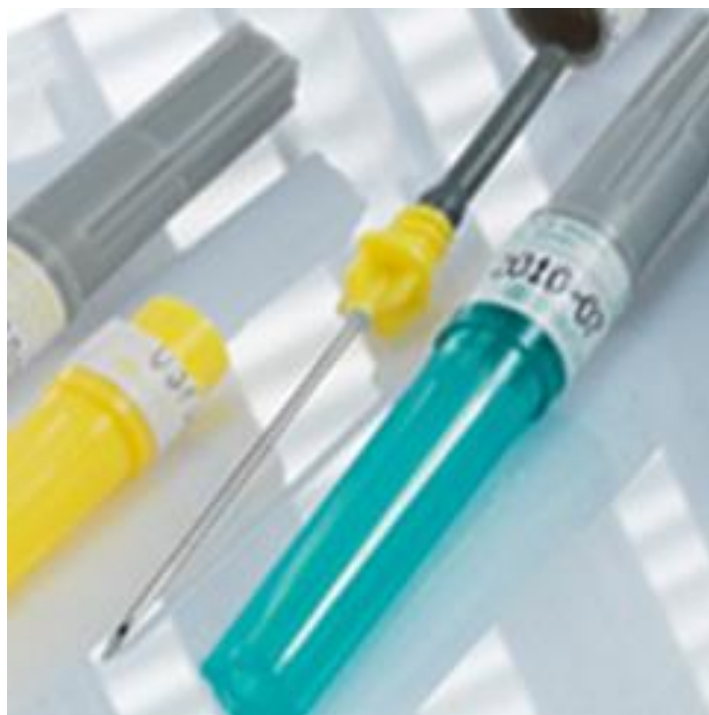
Slika 6.1. Vacurette® igle