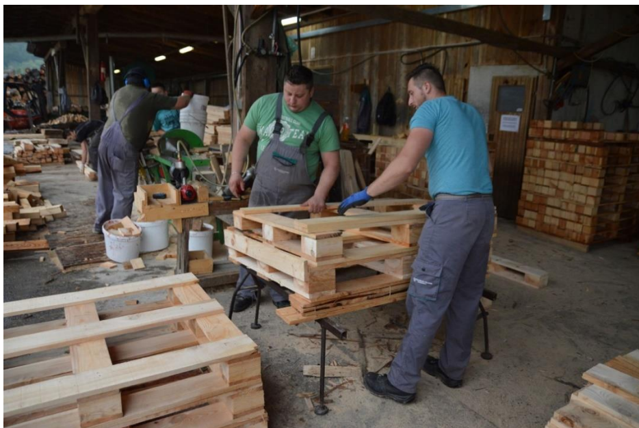
Slika 23. Spajanje dijelova u gotov proizvod – paletu

Daske izrezane na određene dimenzije koje su propisane narudžbom kupca kreću u fazu spajanja. (Slika 23.).