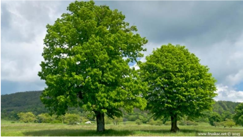
Slika 1. Drvo bjelogorice – lipa