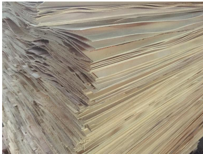
Slika 10. Ljušteni furnir

Furniri (Slika 10.) ili oplatica su listovi drveta debeli 0,05 do 10 mm, izrađeni ljuštenjem, rezanjem ili eventualno piljenjem. Sirovine za izradbu furnira furnirski su trupci i trupci za ljuštenje, koji moraju imati karakteristike propisane standardima. Od domaćih vrsta drva to su najčešće: hrast, bukva, topola, orah, trešnja i ostale voćkarice te jasen, brijest i javor. Od ostalih vrsta poznatiji su mahagoni, abaki, okume itd. Furniri se dijele na: plemeniti rezani furnir, plemeniti piljeni furnir s prirodnom teksturom, konstrukcijski ljušteni furnir, plemeniti lijepljeni furnir s tehničkom strukturom i spojeni furnir u sastavu. Zahtjevi glede tehn. svojstava furnira jesu: boja i tekstura, ravnost i hrapavost površina, točnost dimenzija, dopuštene grješke, sadržaj vode, poroznost, potrebna mehan. svojstva, točnost sastavljanja, čvrstoća lijepljenja i grješke lijepljenja, posebno tehn. furnira. Iz furnirskih listova mogu se izrađivati otpresci i furnirske ploče. Savijeno uslojeni furnirani otpresci mogu biti usporedno ili križno uslojeni. Najčešće se upotrebljavaju u stoličarstvu.