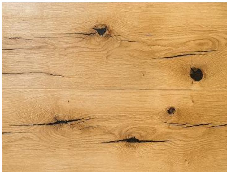
Slika 5. Prirodna greška drva – kvrge