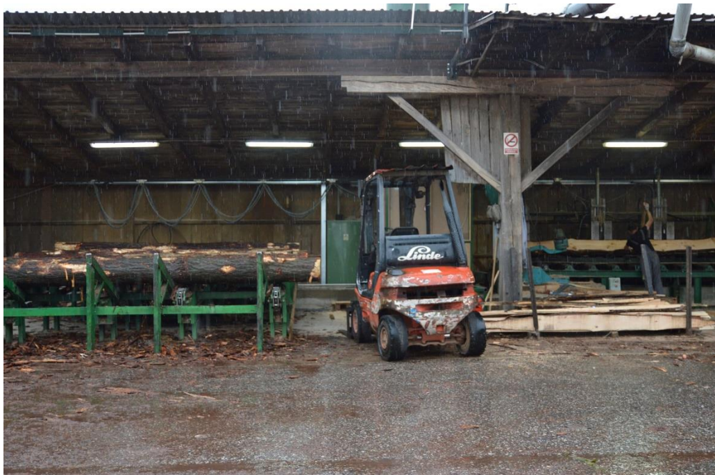
Slika 17. Početna faza izrade paleta