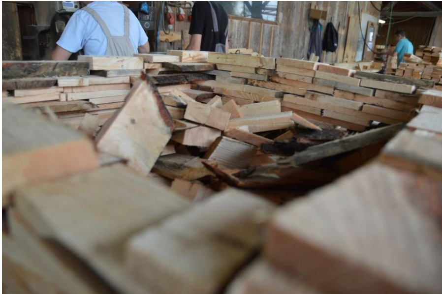
Slika 22. Neiskoristivi dijelovi u procesu izrade paleta

Dijelovi koji se ne mogu iskoristiti u izradi paleta se sakupljaju te iskorištavaju u druge svrhe, primjerice za ogrjev. (Slika 22.)