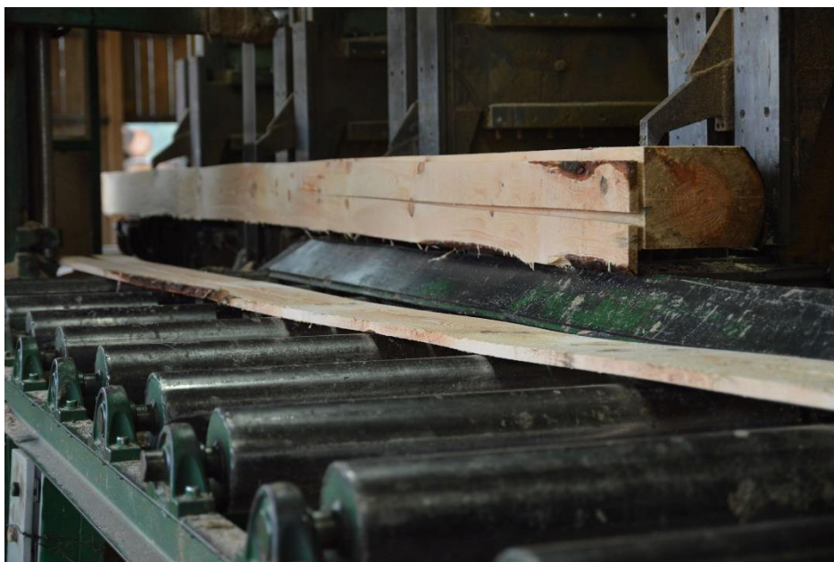
Slika 19. Piljenje trupaca u drugoj fazi