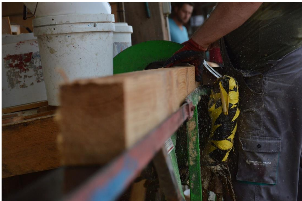
Slika 21. Rezanje građe na određene dimenzije

Sljedeća faza koja je prikazana na slici „Slika 21.“ je rezanje dobivene sirovine na točno određene dimenzije.