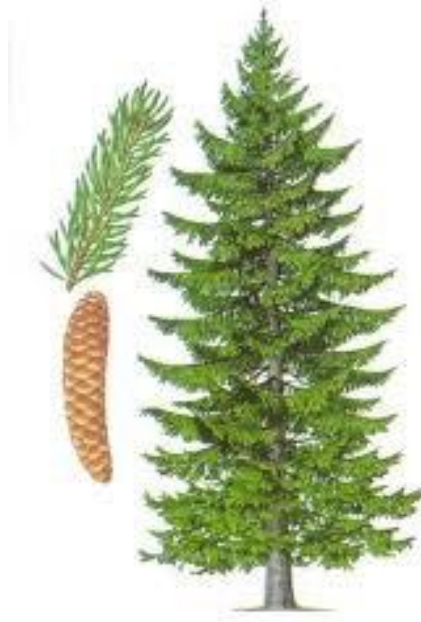
Slika 2. Drvo crnogorice – smreka