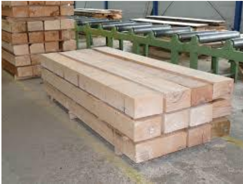
Slika 9. Željeznički pragovi

Željeznički pragovi (Slika 9.) se dijele na obične pragove, pragove za mostove i pragove za skretnice. Obični željeznički pragovi su poprečne grede ugrađene u željezničku prugu koje nose željeznički kolosijek. Skretnički pragovi su duži od običnih, a služe za pričvršćivanje skretnica. Mosni pragovi su gušće poredani i postavljeni na grede mostova i propusta, a služe za pričvršćivanje željezničkih tračnica. Mosni pragovi pilom su oštrobrižno obrađeni sa sve četiri strane, a skretnički i obični pragovi obrađeni su ili ručnim tesaњem ili piljenjem.