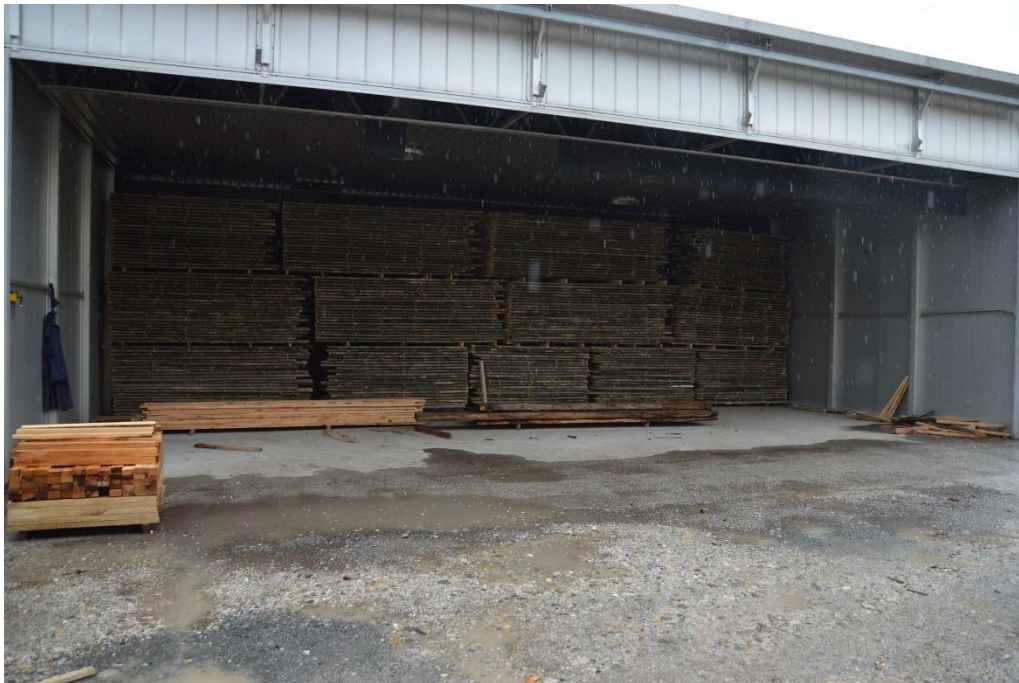
Slika 24. Sušnica – pariona, tretiranje drva

Toplinsko tretiranje se sastoji od zagrijavanja drva za ambalažu ili gotove ambalaže (kao što je prikazano na „Slika 24.“) do postizanja minimalne temperature od 56 °C u sredini najdebljeg drvenog elementa te održavanja navedene temperature u trajanju od najmanje 30 minuta.