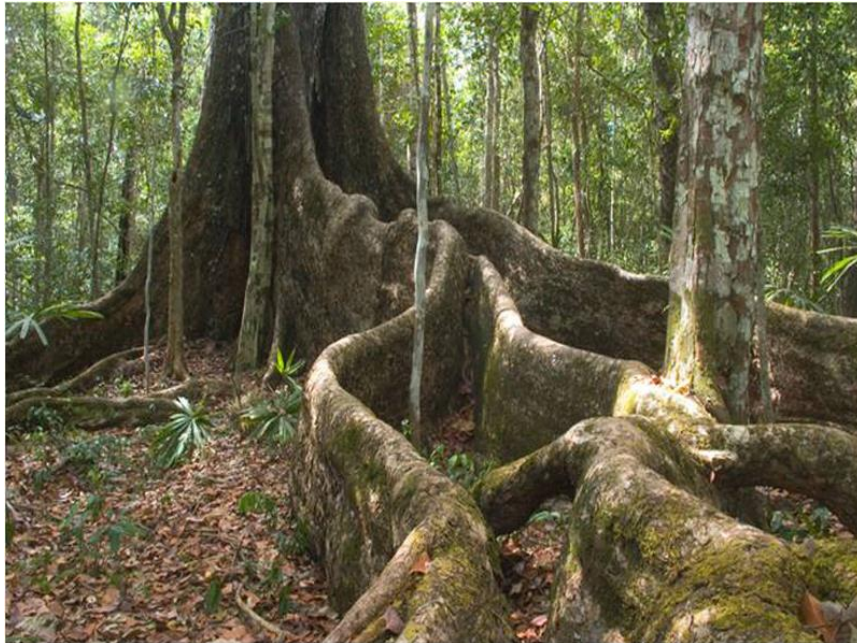
Slika 3. Egzotično drvo – mahagonij