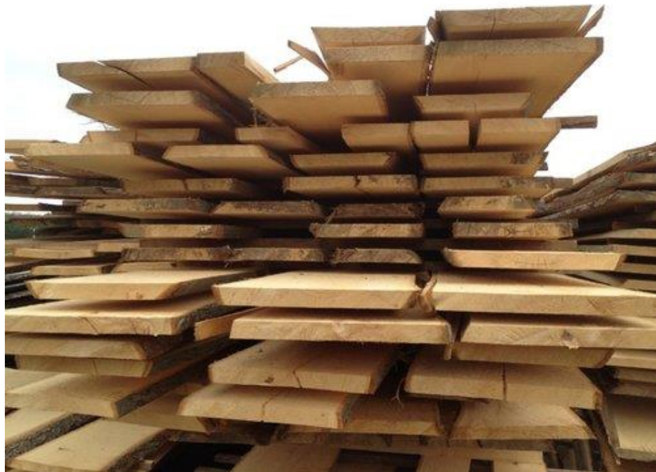
Slika 8. Piljeno drvo

Pilanski ostatak nastaje kao sporedni proizvod pri različitim fazama pilanske obradbe, a može biti krupni (okorci, okrajci, otpiljci i porubci) i sitni pilanski ostatak (kora, piljevina, iverje, blanjevina i drvena prašina). Pilanski ostatak najčešće se koristi za proizvodnju toplinske ili električne energije, za proizvodnju briketa i drvnih peleta (prešani drvni ostaci bez dodataka kem. veziva), kao sirovina u proizvodnji drvenih ploča od usitnjenoga drva te u kemijskoj preradbi drva za proizvodnju papira.