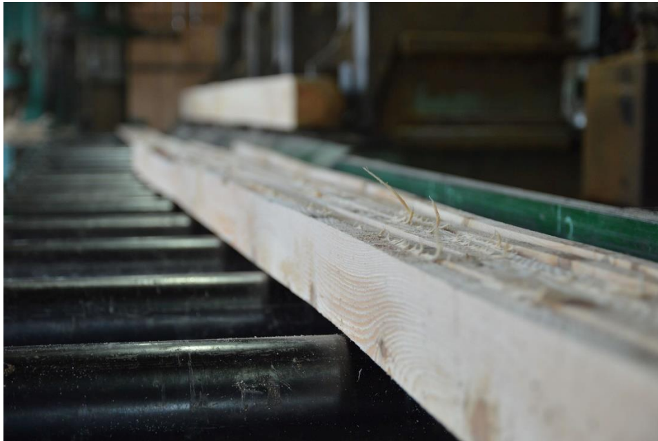
Slika 20. Piljenje rezane građe u manje dijelove