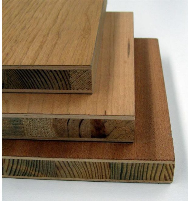
Slika 12. Panel ploče

Panel ploče (Slika 12.) sastoje se od srednjice sastavljene od letvica ili ljuštenih furnira i od obloženog furnira kojima je smjer vlakanaca okomit na smjer vlakanaca letvica. Letvice i obloženi furniri su spojeni ljepilom. Panel ploče debele su od 13 do 45 mm.