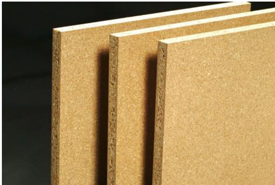
Slika 13. Iverica

Iverica (Slika 13.) je ploča od iverja drva ili drugih lignoceluloznih tvari slijepljenih organskim vezivom pod djelovanjem topline, pritiska, vlage i katalizatora. Prema volumnoj težini razvrstavaju se na lake, srednje teške i teške. Lake ili izolacijske se malo proizvode, imaju volumnu težinu od 0,25 do 0,40 g/cm 3 . Upotrebljavaju se za izolaciju zvuka i topline, te kao srednjice koje se oblažu furnirom ili drugim materijalom. Najviše se proizvode srednje teške iverice koje mogu biti jednoslojne ili višeslojne. Imaju volumnu težinu od 0,40 do 0,80 g/cm 3 . Upotrebljava se za namještaj, vrata, unutrašnja uređenja, pregradne zidove, unutrašnjost brodova i gradnju kuća. Teške ili tvrde iverice imaju volumnu težinu od 0,80 do 1,20 g/cm 3 . Izrađuju se od sitog iverja, malo se proizvode.