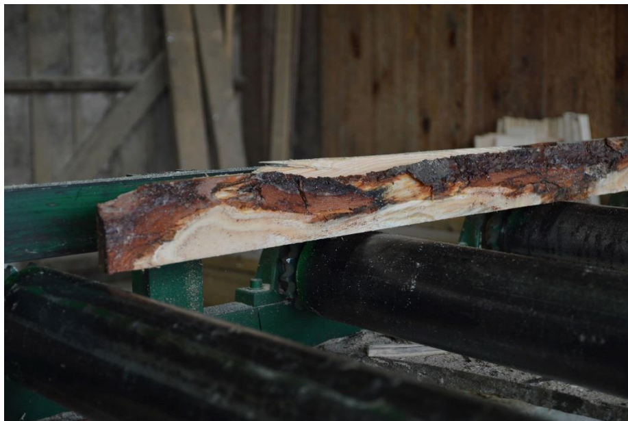
Slika 18. Piljenje trupaca u prvoj fazi

Trupci se tada režu, tj. pile pomoću mehaničkih pila. Trupac se rastavlja na više dijelova u neobrađenu piljenu građu, te se dalje obrađuje, tj. pili na sitnije dijelove, određene dimenzije, kao što prikazuju „Slika 18.“, „Slika 19.“ i „Slika 20. – vidi str.38)“.