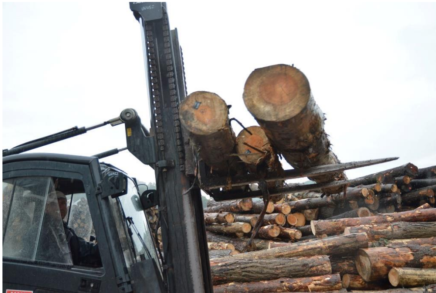
Slika 16. Prijenos trupaca viličarom

Paleta se izrađuju iz mekog drva, najviše od trupaca jele, smreke, bora, topole i dr. Nakon što su trupci stigli u pilanu i napravljen je iskrcaj iz specijaliziranih prijevoznih sredstava, viličarima se prevoze do odgovarajuće pozicije, kao što i prikazuju „Slika 16.“ i „Slika 17.“.