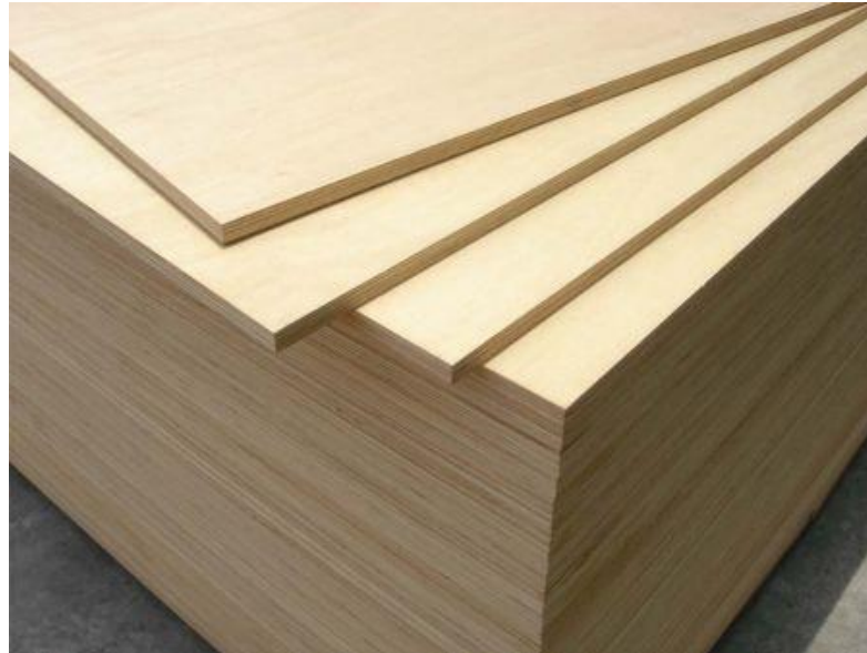
Slika 11. Šperploče

Šperploče (Slika 11.) su sastavljene od neparnog broja unakrsno slijepljenih furnirskih listova. Dijele se na brodske, avionske i obične. Šperploče se razvrstavaju prema kvaliteti i skladište do otpreme u suhe i zračne prostorije. Slažu se jedna na drugu u snopove podignute otprilike desetak centimetara od poda da zrak može strujati ispod njih.