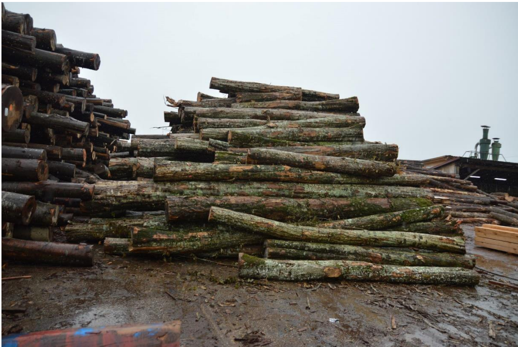
Slika 14. Trupci bukve i graba

Trupci se nabavljaju iz Hrvatskih šuma d.o.o., i to cca 70000 m 3 godišnje (najviše bukve, jele, graba, trešnje i dr.).