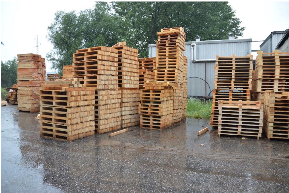
Slika 15. Europaleta

Europaleta (Slika 15.) je paleta izrađena od drveta s određenom dimenzijom. Standardna dimenzija je 1200 x 800 x 144 mm, a težina iznosi 20 – 24 kg. Nosivost palete iznosi 1500 kg. Služi olakšavanju rukovanja i prosljeđivanju roba viličarom kao i primjerice u cestovnom, željezničkom i zračnom prijevozu robe. Paleta u prosjeku traje 5 – 7 godina.