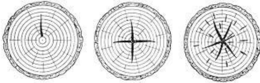
Slika 6. Jednostrana, unakrsna i zvjezdasta paljivost