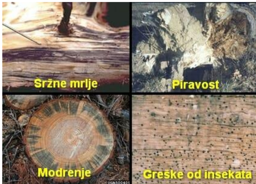
Slika 7. Greške drva