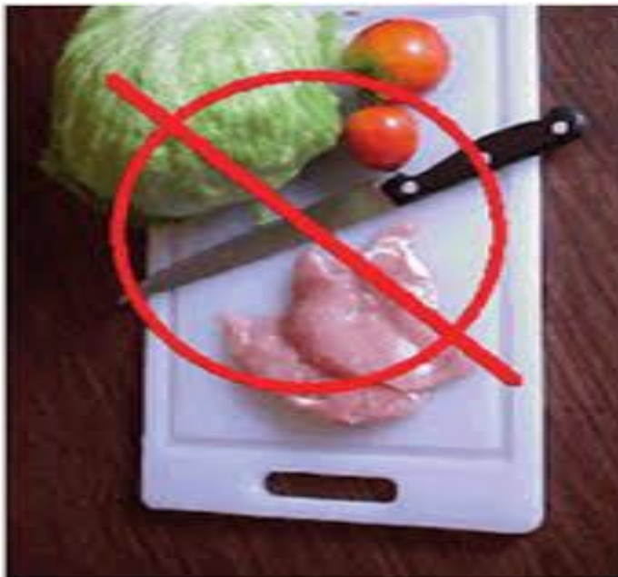
Slika 4.3.1. Neprimjereno korištenje istog noža za obradu mesa i povrća