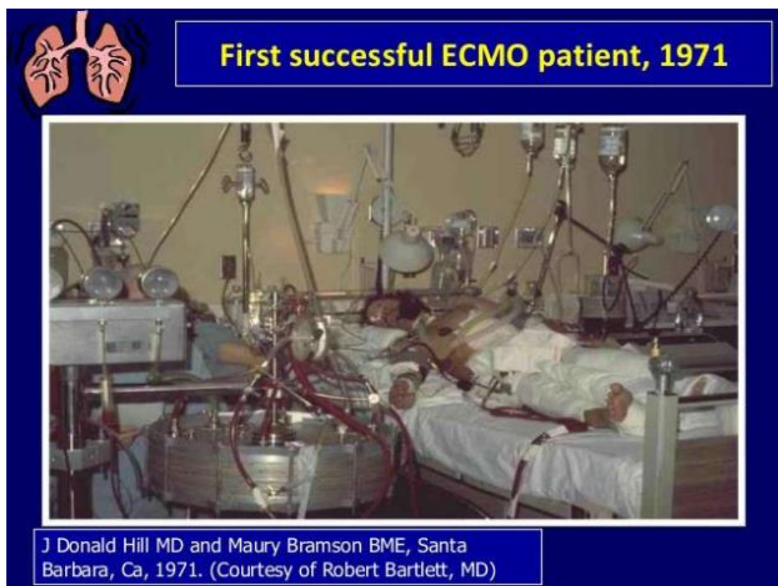
Slika 2.1.1 Pacijent na prvom uspješnom ECMO sustavu, 1971.

No, i u narednim godinama usprkos znanstvenicima i njihovim istraživanjima na području ECMO potpore, interes za ECMO sustav bio je malen. Tek 2009. godine, kod pandemijske gripe H1N1 kada su objavljeni rezultati CESAR (eng. Conventional Ventilation or ECMO for Severe Adult Respiratory Failure) i rezultati liječenja ECMO potporom doveli su do novog porasta interesa za ECMO sustav. Uz te rezultate, za povećan interes i uporabu ECMO sustava zasigurno je zaslužan i tehnološki napredak koji je omogućio sigurnije i jednostavnije korištenje ECMO sustava [18].