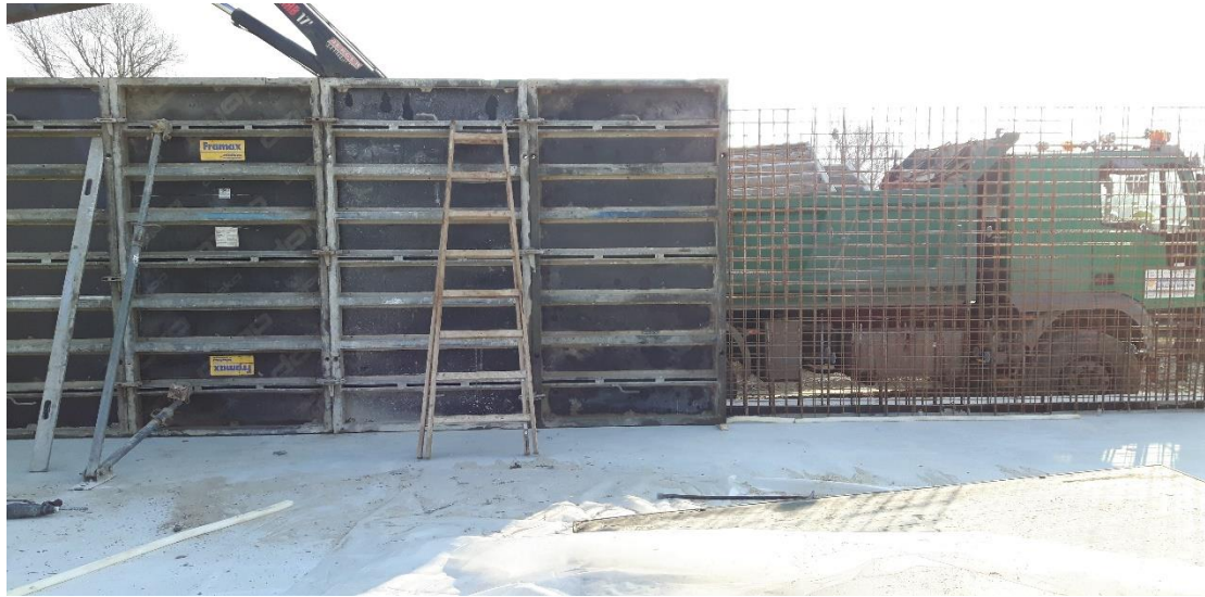
Slika 10. Postavljanje oplata za vertikalne armaturne zidove