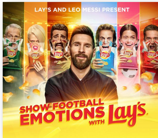
Slika 3.4. Lionel Messi reklamira čips „Lays“ (izvor: https://www.virtualnemedija.pl/artykul/leo-messi-reklama-lay-s-na-mundial-wideo )

Neki od najpoznatijih primjera poznatih osoba u reklamama su nogometaši (Lionel Messi u reklami za „Lays“ čips, Neymar za „Gilette“ britvice, Robert Lewandowski za „Head & Shoulders“ šampon za kosu...), manekenke (Adriana Lima za „Maybeline“ ruž, Barbara Palvin za „L'oreal Paris“ liniju za čišćenje kože lica, Heidi Klum za vlastitu liniju odjeće u trgovačkom lancu „Lidl“...), glumci i glumice (Rene Bitorajac, Goran Navojec i Goran Bogdan za „Ožujsko pivo“, Gla Gadot za smartphone „Huawei“, Eva Longoria za „L'oreal Paris“ puder, Chris Hemsworth i Jamie Dornan za parfem „Hugo Boss“...), pjevači i pjevačice (Cardi B za „Reebok“ tenisice, Camila Cabello za „Skechers“ tenisice, Shawn Mendes za „Armani“ satove...) i dr. Ova vrsta promidžbe proizvoda korisna je za tvrtke, a pogotovo celebrityje . I jednima i drugima povećava se bankovni račun, publicitet kroz medije te cjelokupni javni imidž. Ono što je također važno izdvojiti je način na koji se slavni putem reklama približavaju publici. Oni svoj postojeći imidž prenose na proizvod kojeg promoviraju i time kreiraju određenu simboliku, a to utječe na kupce koji to prepoznaju i na temelju toga kupuju proizvod. Logika je sljedeća: ako je dovoljno dobro za celebrityje , onda je i za ostale.