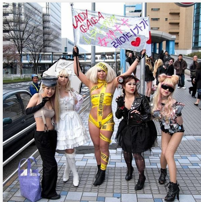
Slika 3.2. Obožavatelji Lady Gage, tzv. „Little Monsters“

veoma traženi, a ta pojava se nastavila i modernizirala u današnje vrijeme putem aukcija i dražbi na kojima se nalaze razni personalizirani predmeti poznatih. Nerijetko se desi da neki otiđu i predaleko sa zahtjevima koji znaju biti čudni, krše privatnost slavnih ili su čak i opasni. Oni najvjerniji znaju gotovo sve o svojim zvijezdama, čak i stvari koje ne dijele s javnošću. No postoje i obožavatelji koji celebrityje štiju izdaleka te ih nemaju namjeru upoznati, već grade kućne posvete – oltare kojima odaju počast svojim idolima. Osnivaju se klubovi u kojima se okupljaju milijuni obožavatelja koji dijele strast prema istoj umjetničkoj ili sportskoj zvijezdi. U tom slučaju javlja se zanimljiva pojava davanja naziva određenim skupinama, pa tako postoje „Little Monsters“ (Lady Gaga), „Beyhive“ (Beyonce), „Beliebers“ (Justin Bieber), „Swifties“ (Taylor Swift) i sl. Svijet slavnih osoba i obožavatelja međusobno se isprepliće kroz popularnu kulturu već stoljećima, počevši s filozofima i pjesnicima koji su uživali u slavi i poštovanju društva. No i među obožavateljima postoji natjecateljski duh koji se manifestira kroz dokazivanje odanosti prema slavnima. Svatko želi pokazati da je baš on najvjerniji i najiskreniji obožavatelj.