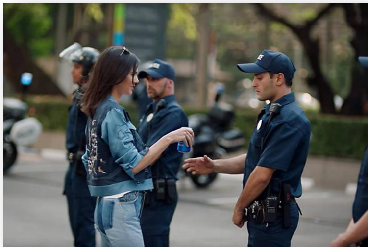
Slika 3.5. Kontroverzna Pepsi reklama s Kendall Jenner