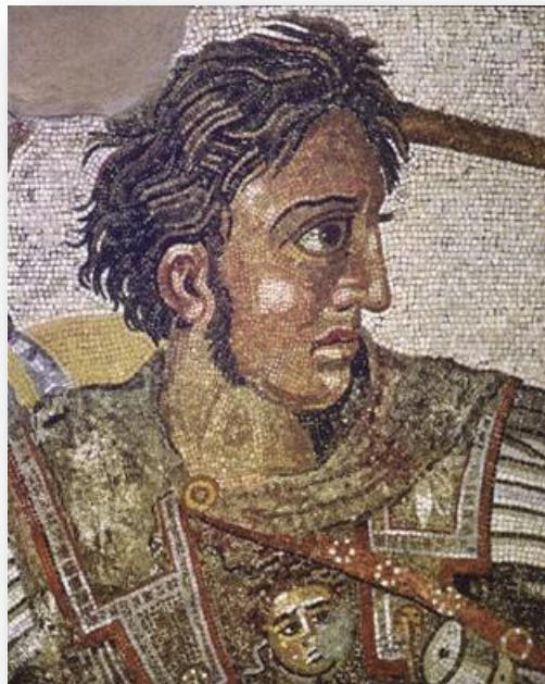
Slika 2.1. Aleksandar Veliki

O tome tko je prva slavna osoba u ljudskoj povijesti vodilo se dosta rasprava i stvorila su se različita mišljenja. Ipak se većina autora, među njima i Braudy, slažu kako je to bio vojskovođa i osvajač Aleksandar Veliki. Iako nije bio prva osoba koja je htjela pokoriti svijet putem vojnih osvajanja, svakako je bio prvi koji je htio svu čast i slavu pribaviti za sebe kao pojedinca. Htio je postati opće prisutan dio svakodnevnog života tadašnjih ljudi. Inspirirali su ga grčki junaci i ostali heroji čija je djela htio ponoviti te na taj način od sebe napraviti statusnu ikonu i simbol besmrtnosti. U tome je i uspio (2000: 14). Među prve slavne osobe mogu se još uvrstiti i rimski carevi koji su bili štovani poput bogova te su uživali u poštovanju i moći koju su posjedovali. Tome su pridonijeli i gladijatori koji su svojim borbama na život i smrt odavali počast caru i njegovom liku. I antička Grčka je imala svoje gladijatore, tj. sportaše koji su se natjecali na Olimpijskim igrama, a pobjednici bi svojom spretnošću i snagom bili dugo slavljani među narodom.