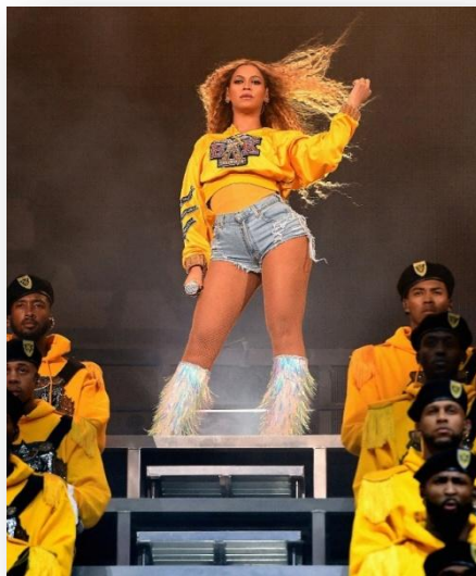
Slika 2.2. Nastup Beyonce na glazbenom festivalu Coachella