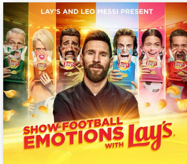
Slika 3.4. Lionel Messi reklamira čips „Lays“

Neki od najpoznatijih primjera poznatih osoba u reklamama su nogometaši (Lionel Messi u reklami za „Lays“ čips, Neymar za „Gilette“ britvice, Robert Lewandowski za „Head & Shoulders“ šampon za kosu...), manekenke (Adriana Lima za „Maybeline“ ruž, Barbara Palvin za „L'oreal Paris“ liniju za čišćenje kože lica, Heidi Klum za vlastitu liniju odjeće u trgovačkom lancu „Lidl“...), glumci i glumice (Rene Bitorajac, Goran Navojec i Goran Bogdan za „Ožujsko pivo“, Gla Gadot za smartphone „Huawei“, Eva Longoria za „L'oreal Paris“ puder, Chris Hemsworth i Jamie Dornan za parfem „Hugo Boss“...), pjevači i pjevačice (Cardi B za „Reebok“ tenisice, Camila Cabello za „Skechers“ tenisice, Shawn Mendes za „Armani“ satove...) i dr. Ova vrsta promidžbe proizvoda korisna je za tvrtke, a pogotovo celebrityje . I jednima i drugima povećava se bankovni račun, publicitet kroz medije te cjelokupni javni imidž. Ono što je također važno izdvojiti je način na koji se slavni putem reklama približavaju publici. Oni svoj postojeći imidž prenose na proizvod kojeg promoviraju i time kreiraju određenu simboliku, a to utječe na kupce koji to prepoznaju i na temelju toga kupuju proizvod. Logika je sljedeća: ako je dovoljno dobro za celebrityje , onda je i za ostale.