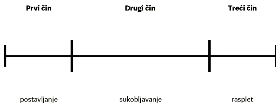
Slika 2.1 Princip tročinske strukture (gore) i slika 2.2 Junakov put Josepha Campbella (dolje)

Ovaj rad stavlja veći naglasak na alternativne načine strukturiranja koji su opširnije opisani u nastavku.