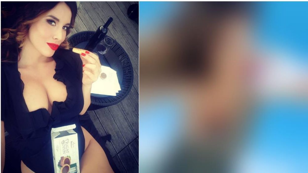
Slika 7.4.1. Namjerni clickbait – NewsBar.hr

analize – sama činjenica da je autor uočio uzorak redovitog ustupanja medijskog prostora na mainstream novinarskom portalu nečemu što se ni u kojem slučaju ne može okarakterizirati kao vijest i reagirao je dovoljna. Odabrao je pravi trenutak za komično te je isti iskoristio da nas na jedinstven način upozori na problematično stanje našeg medijskog prostora. Dodatno, valja spomenuti da je i fotografija koja je ubačena na početak teksta još jedan suptilan „udarac“ usmjeren prema klasičnim medijima, koji isti trik često koriste u kombinaciji s clickbait naslovima kako bi privukli što veći broj znatiželjnih čitatelja.