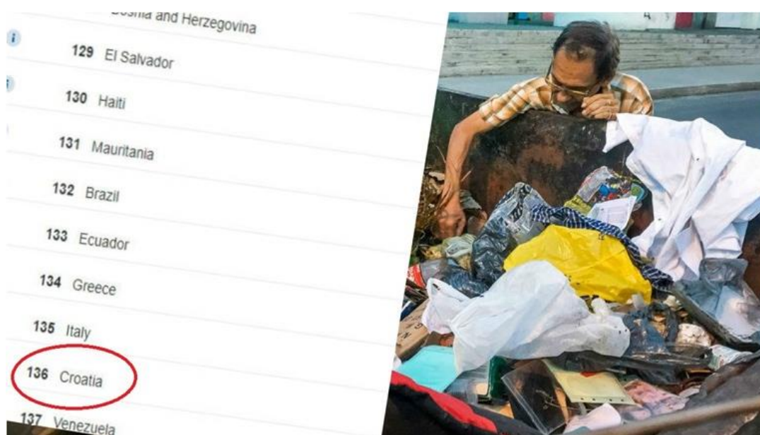
Slika 7.2.2. Propast Hrvatske