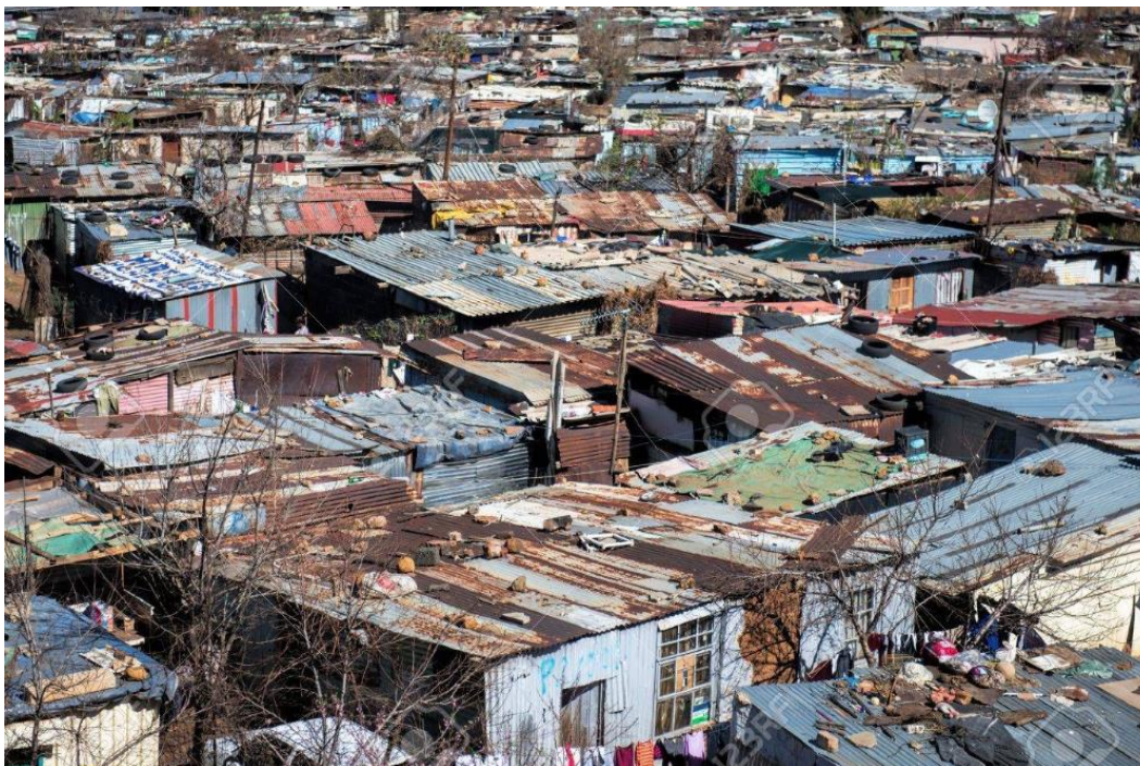
Slika 7.2.1.