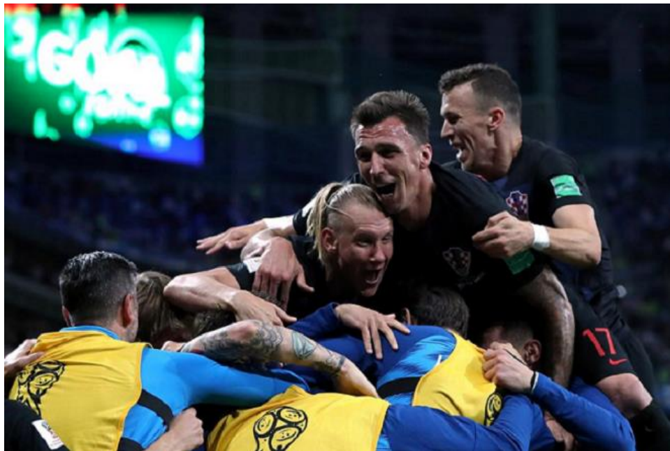
Slika 7.1.2. Slavlje Vatrenih

Ovo je jedna od fotografija koje su priložene uz tekst objavljen na portalu 24sata.hr.