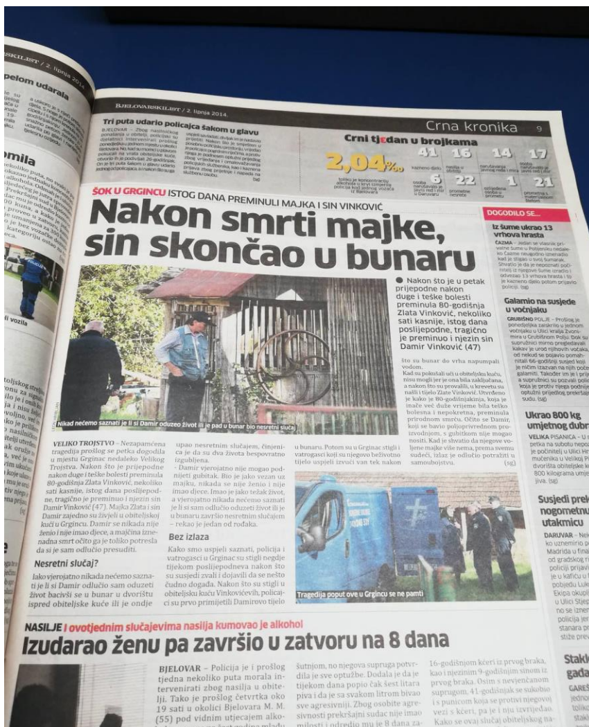
Slika 10: Bjelovarski list, objavljen dana 02. lipnja 2014. godine

2. lipnja naslovnica donosi naslov: „ Damir nije mogao živjeti bez majke, skočio u bunar “.