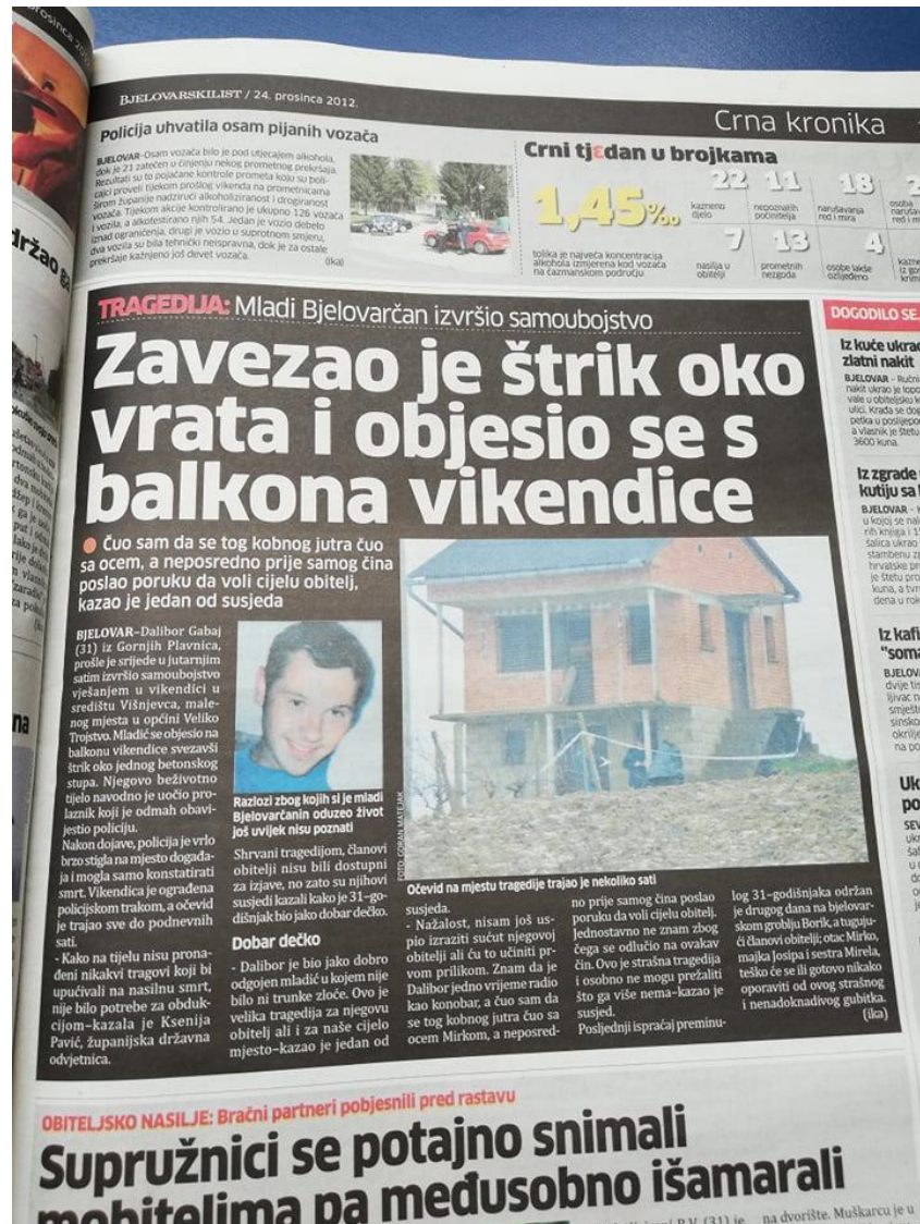
Slika 7: Bjelovarski list, objavljen dana 24. prosinca 2012. godine

Posljednja vijest u 2012. godini, govori o tragediji u kojoj je mladić izvršio samoubojstvo. Detalji su vidljivi na fotografiji ispod teksta. Na fotografiji je lako uočiti nedostatke i pogreške novinara Bjelovarskog lista.