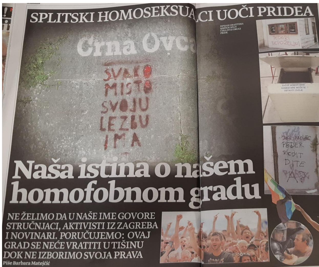
Slika 7.1.2. Naslovnica Subotnjeg izdanja Magazina Jutarnjeg lista 2012. godine