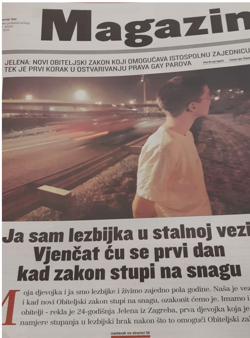
Slika 7.1.1. Naslovnica Subotnjeg izdanja Magazina Jutarnjeg lista 2002. godine

godine bio prvi u povijesti Hrvatske te smatra kako ljudi u Hrvatskoj „na homoseksualizam gledaju kao na bolest i vrlo su agresivni po tom pitanju“ (Appelt 2002: 35).