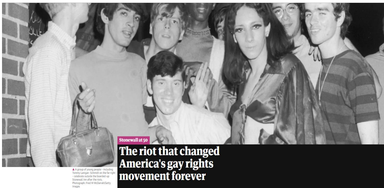
Slika 8.1.3. Naslovna fotografija publicističkog članka na Guardianu iz 2019. godine