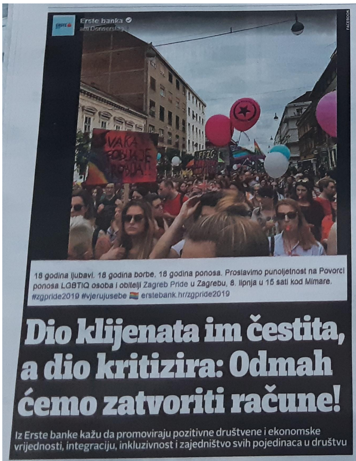
Slika 7.1.3. Naslov, fotografija i status koji je izazvao burne reakcije

Oni koji su zaprijetili da će zatvoriti račune, mogli su još prije dvije godine znati što Erste banka promovira zbog reklame koja se prikazivala na televiziji, ali i online kanalima, uključujući i društvene mreže. Naime, gledateljima je bio sporan kadar gdje se dvojica muškaraca drže za ruke,