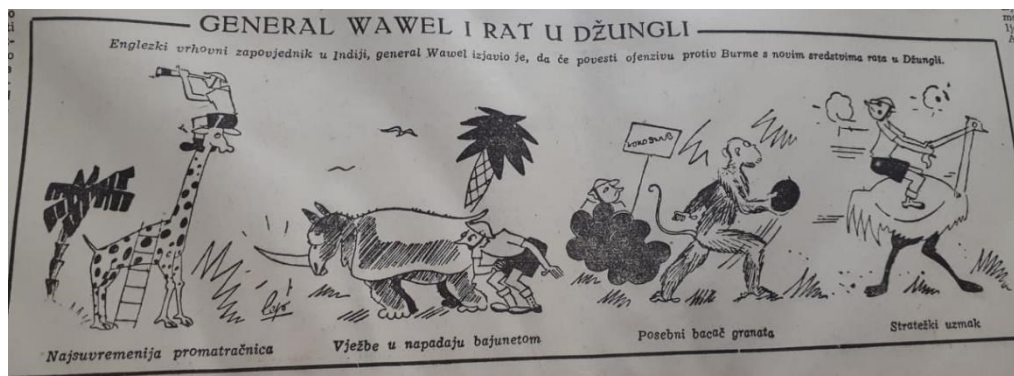
Slika 6.4 - Humoristična karikatura engleskog generala Wawela tijekom rata u Indiji ( Spremnost : br. 52., 21. veljače 1942. - vlastita presnimka)

Odjeci iz svijeta rubrika je koja, kako i sam naziv kaže, informira o važnijim događajima u svijetu, posebice o onima koji su mogli imati utjecaja i na NDH-a. Tako se u 122. broju na 4. i 5. stranici mogu vidjeti naslovi „Obrana ludosti Finske“, „Njemačka strategija u Italiji“ i Churchillov govor. Iako su kapitulacija Italije i iskrcavanje kod Normandije veliki i važni događaji za svijet, a samim time i NDH, u Spremnosti su ti događaji navedeni samo kao mogućnosti, a nakon njihova ostvarenja nema članaka koji ih opisuju. Primjerice, napravljen je izračun troškova potrebnih za prijevoz američke vojske do Normandije i dnevni troškovi potrebni za njeno održavanje, ali se kasnije nigdje ne spominje uspjeh tog vojnog pothvata kao ni njegovi detalji. U takvim se primjerima ponajbolje vidi da je list, unatoč navedenim uredničkim izmicanjima od krute službene politike, ipak bio pod snažnom režimskom kontrolom. Gledano iz današnjeg ugla, Spremnost je bila nešto liberalniji zagovornik ustaškog državotvornog ekskluzivizma, u kojem se nisu mogle afirmirati temeljne demokratske vrijednosti.