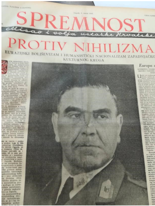
Slika 6.1 - Spremnost : srpanj 1943., br.71, str. 1