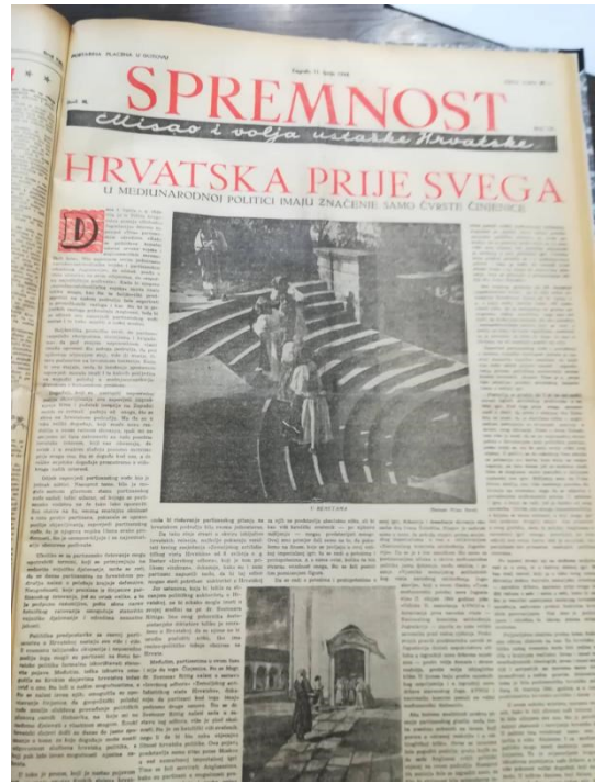
Slika 6.2- Spremnost : lipanj 1944., br. 121, str. 1 (vlastita fotografija)

Isto tako, kroz druge naslove uvidalo se uporno protivljenje velikosrpskoj politici, a velika pozornost davala se strahu od boljševizma i njegovoj sve uočljivijoj infiltraciji u hrvatsko društvo.