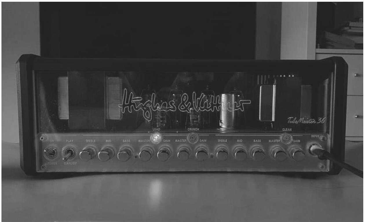
Slika 6. „Hughes & Kettner Tubemeister 36“