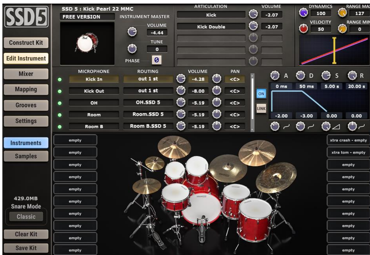
Slika 2. Vizualni prikaz SSD5 plugina

Razlika između ozvučenog akustičnog bubnja u studiju i virtualnog instrumenta poput SSD5 ne postoji jer se radi o potpuno identičnim procesima rada. Potpuno identična situacija je i u snimanju ostalih instrumenata, zbog čega se dovodi u pitanje egzistencija analognog glazbenog studija kao glavnog sredstva stvaranja glazbe i glazbene produkcije. [9]