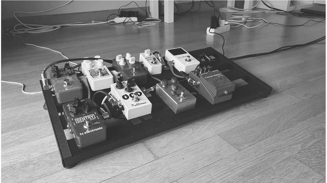
Slika 9. Efekt pedale korištene u „ FX loopu “ pojačala

Prilikom snimanja ovog materijala, koristio sam se „metodom četiri kablova“ („ four cable method “). Ova metoda nam omogućuje da istovremeno koristimo modulacijske pedale spojene u „ FX loop “ i distorzijske spojene ispred pojačala. Pedale koje sam koristio na ovom projektu su; „ TC Hall of Fame “ (reverb), „ TC Corona “ (chorus), „ TC Shark mini “ (boost), „ Electro Harmonix “ (delay), u „ FX loopu “, te „ TC Sentry “ (noise gate), „ OCD Fulltone “ (distortion), „ Archer “ (distortion), „ Boss CP-1X “ (compressor) ispred pojačala.