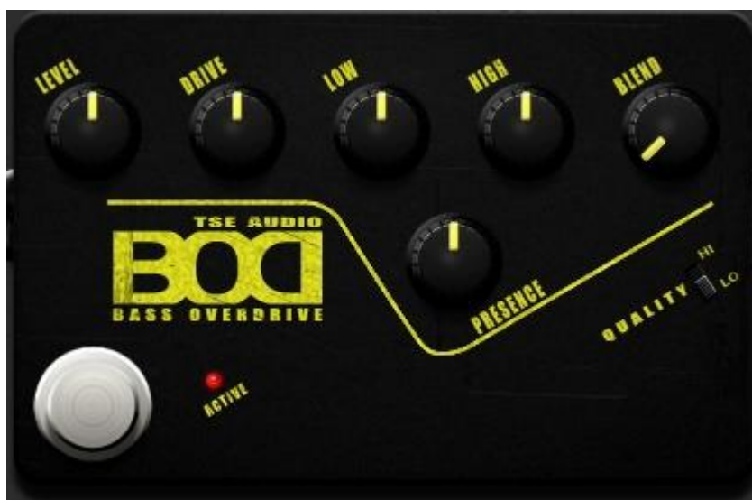
Slika 5. „TSE BOD“ plugin

frekvencije visokog pojasa, također sam smanjio i „Drive“ kako bi zadržao čisti zvuk gitare, te sam na duplu bass dionicu dodao isti plugin, ali s pojačanom „Drive“ opcijom kako bi zvuk gitare bio pitkiji.