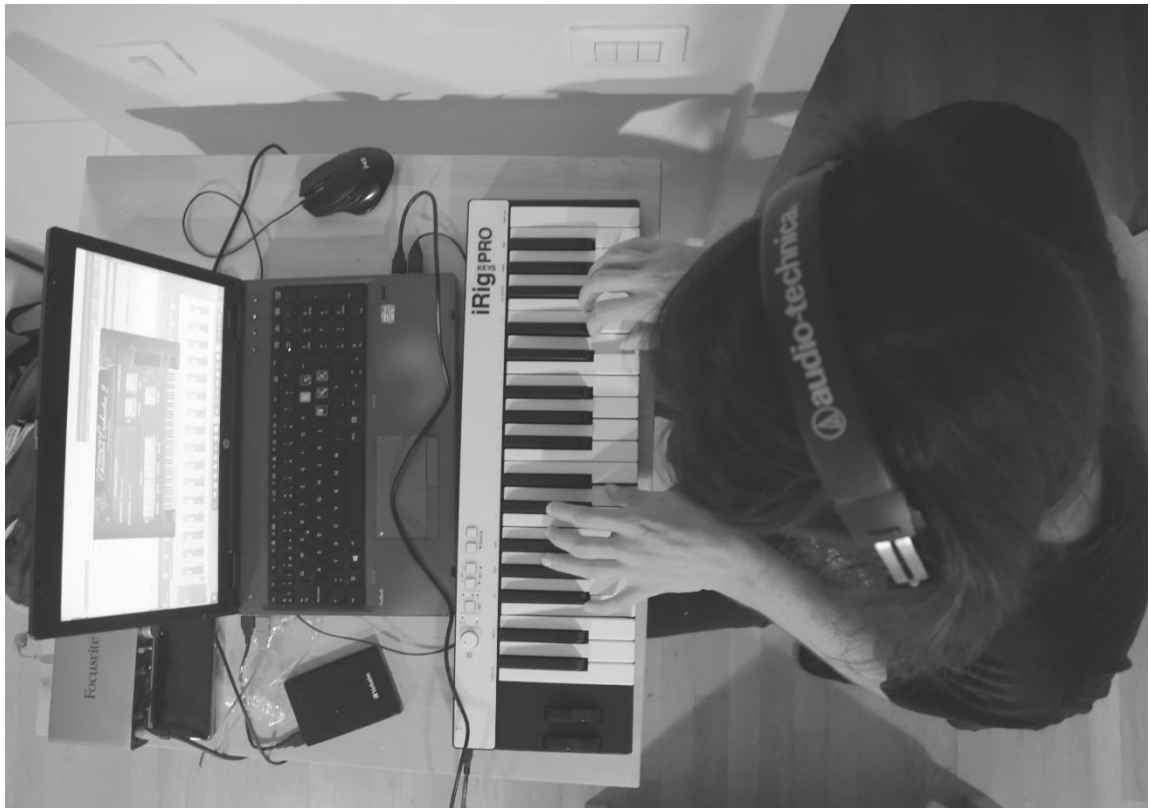
Slika 14. Skladanje orkestralnih dionica

Dobio sam zvuk koji sam želio, ali nešto je nedostajalo. Trebao sam neki ljudski faktor u cijelom orkestralnom zvuku pa sam dodao „ Sontinu “. To je modul koji simulira glasove mješovitog zbora. Unutar postavki plugina, pojačao sam prisutnost efekta te sam ga raširio po panorami koristeći iste postavke kao i kod žičanih instrumenta. Sve orkestralne dionice snimljene su pomoću „ iRig MIDI Pro “ klavijatura.