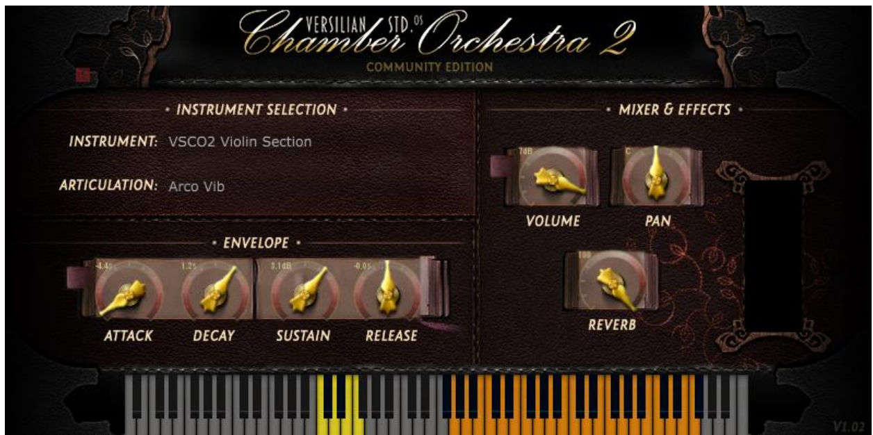
Slika 1. Vizualni prikaz CO2 plugina