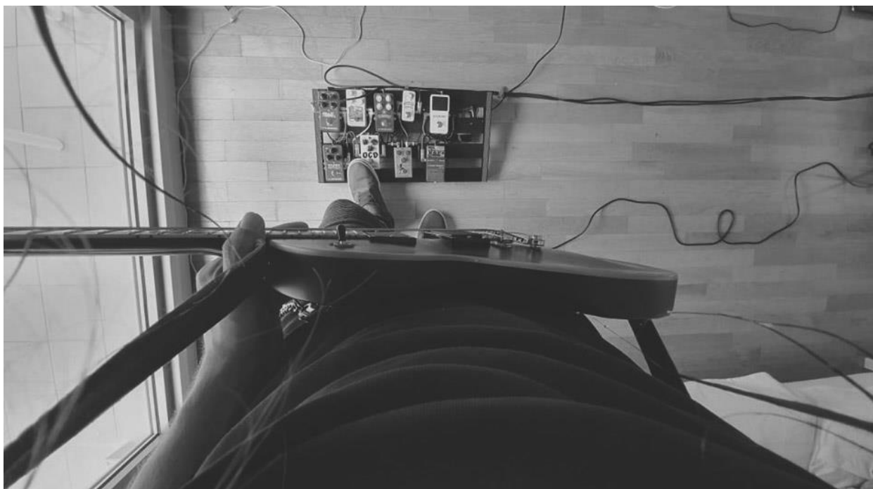
Slika 10. Kombinacija pedala u snimanju