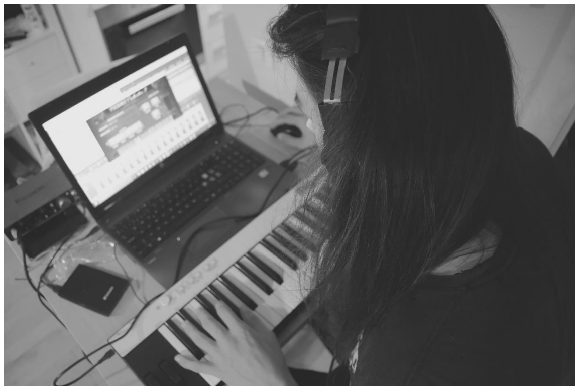
Slika 15. Snimanje orkestralnih dionica