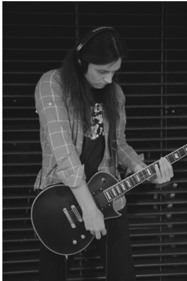
Slika 8. Snimanje gitarskih dionica