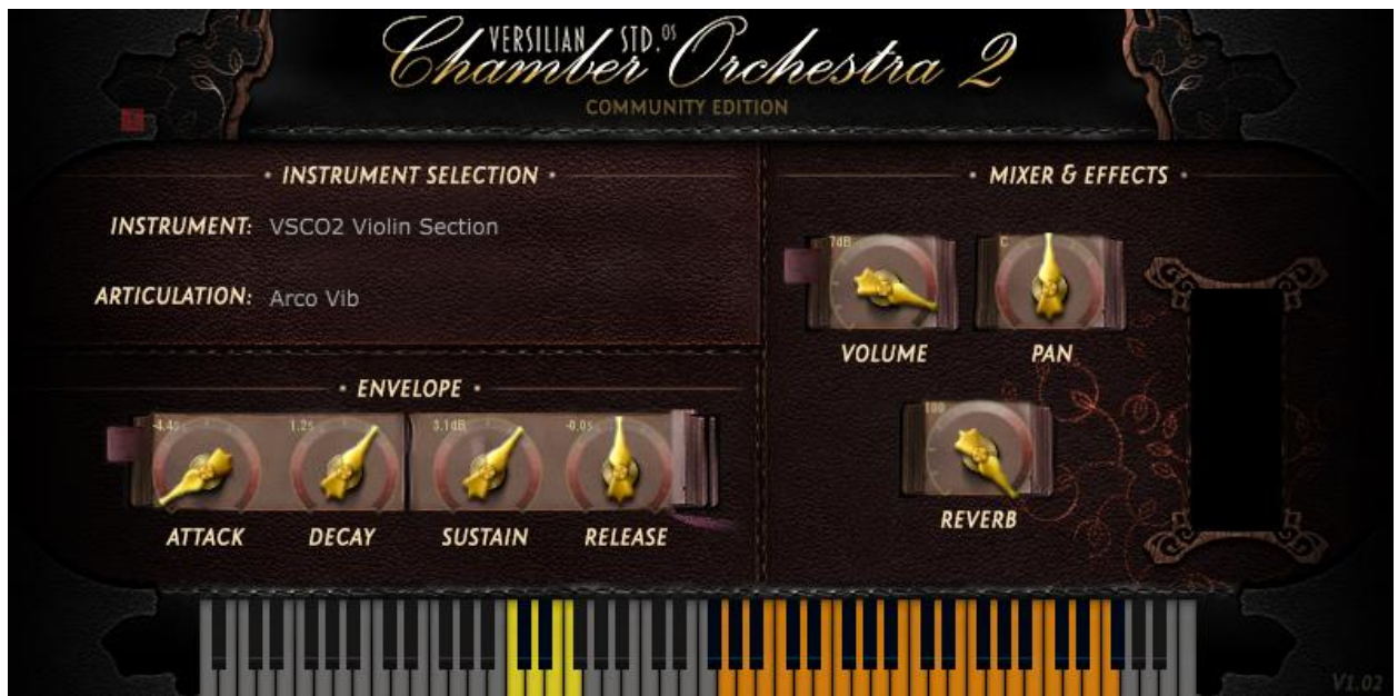
Slika 1. Vizualni prikaz CO2 plugina