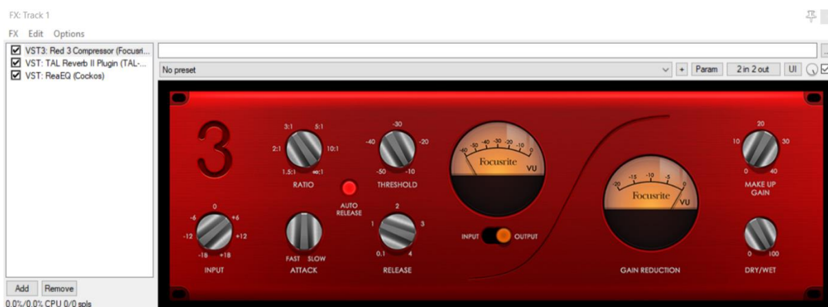
Slika 12. „Focusrite Red 3 compressor“

Na sve vokalne dionice dodao sam „Focusrite Red 3 compressor“ sa „thresholdom“ zadanim na -10 db, zbog razlike u količinama zraka koje se ispuštaju prilikom viših i nižih tonaliteta, dolazi do određenog razmjera u glasnoći određenih dijelova vokalnih melodija te vokalna dionica prelaze u „peak“. Uz kompresor sam koristio i „Focusrite Red EQ“ za kontroliranje određenih frekvencija u srednjem i visokom frekvencijskom pojasu. Uz navedene efekte, koristio sam i potpuno besplatan VST „TAL Reverb II“ . Radi se o odličnom reverbu koji uz široki spektar podesivih parametara ima i nekoliko odličnih „preseta“. Koristio sam ga u minimalnoj količini samo zbog boljeg panoramnog širenja u prostoru na „dry“ vrijednosti od -18,5dB.