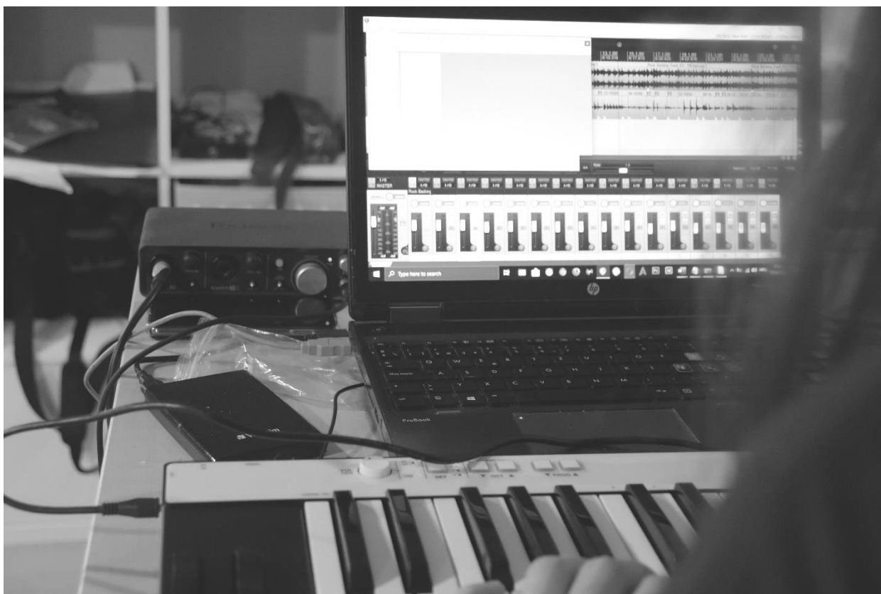
Slika 16. Miksanje svih snimljenih elemenata

Moj pristup u fazi miksa bio je jako jednostavan. U ovoj fazi sam upotrijebio sam dva besplatna VST plugina koji dolaze s besplatnom verzijom „Reapera“, DAW programa u kojem je čitav projekt realiziran. Koristio sam „ReaEQ“ i „ReaXcomp“, jednostavni pluginovi eq-a i kompresora s kojima sam svakom instrumentu „odrezao“ određene frekvencije. Kada je u pitanju bubanj, odreza sam višak dubokih i visokih frekvencija kako bi napravio više mjesta za bas i vokal, kod gitare sam odrezao visoke, niske i srednje frekvencije koje su činile zvuk „musavim“ i prigušenim, dok sam kod bas gitare upotrijebio blagi „Misic/noisegate“ sa trehsoldom od -30dB kako bi prigušio ulazni šum „TSE BOD“ plugina.