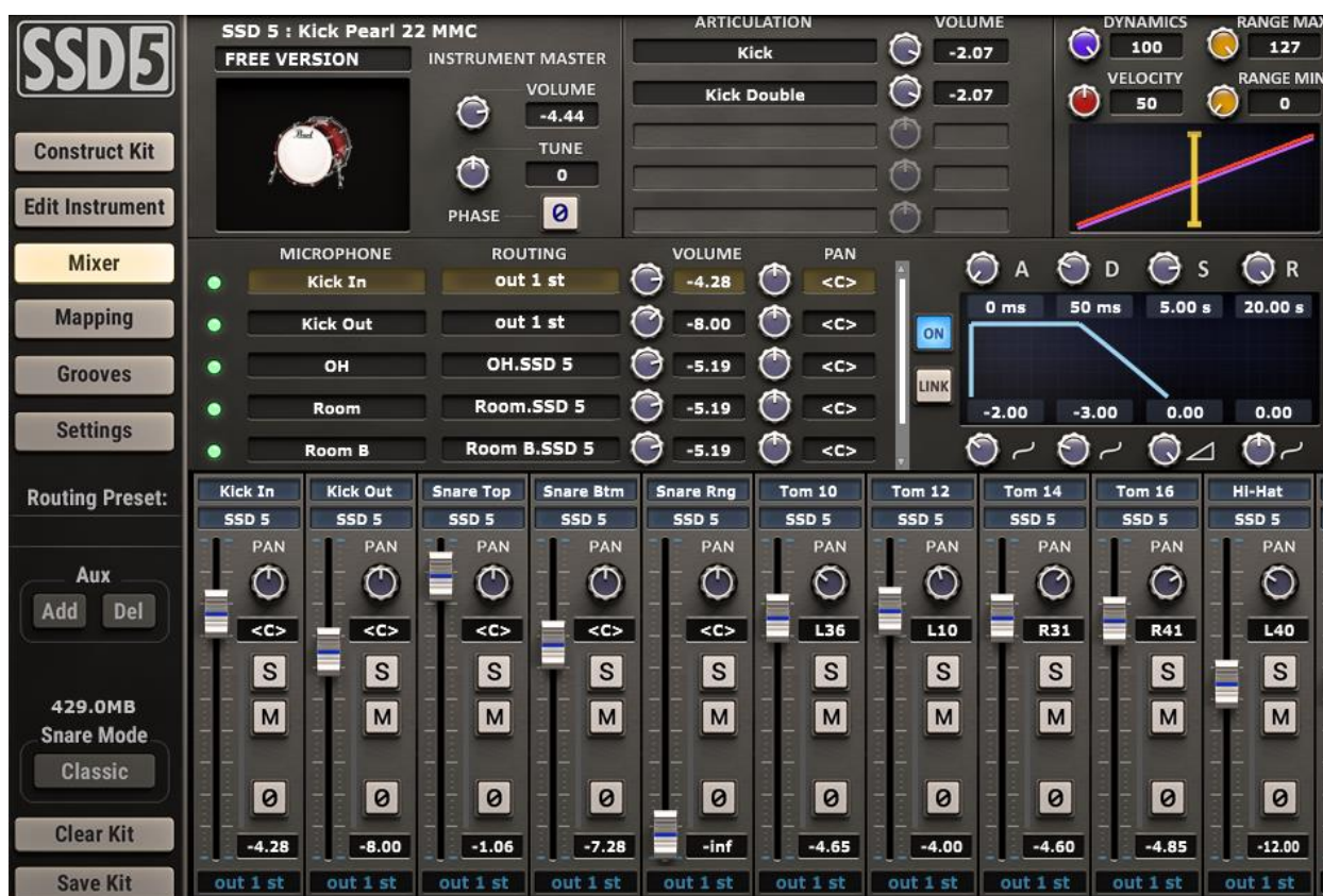
Slika 4. Vizualni prikaz „mixboara“ unutar SSD5 plugina

glasnoćom i tipom pojedinih udaraca („rimshot“ i „classic“) doprinio ograničenijem zvuku bubnja.