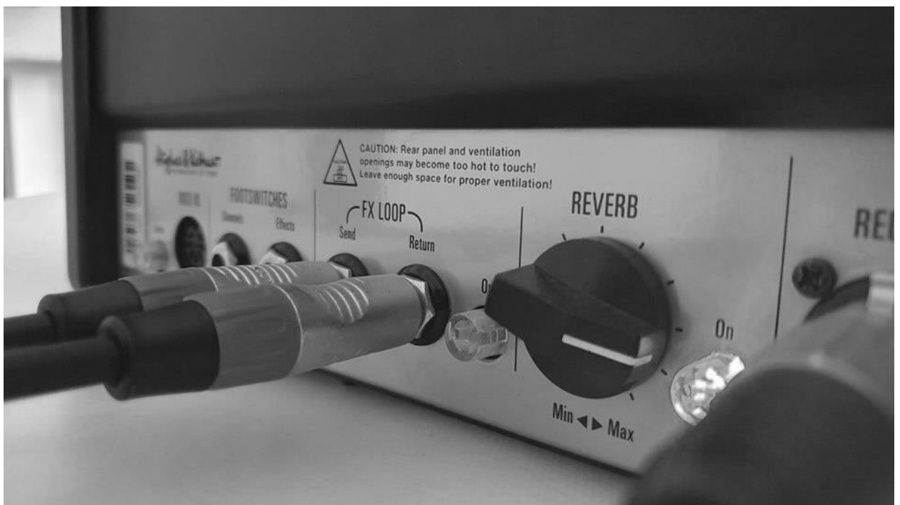
Slika 7. „Hughes & Kettner Tubemeister 36, FX loop“