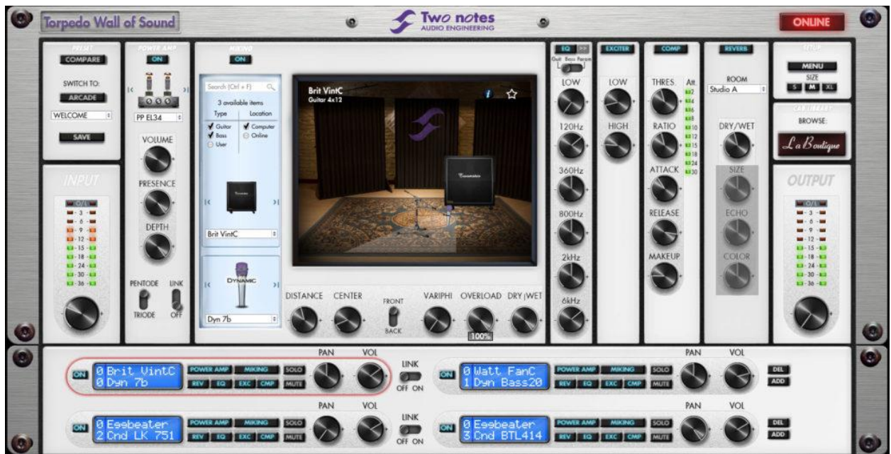
Slika 3. Vizualni prikaz „Torpedo Wall Of Sound“ plugina