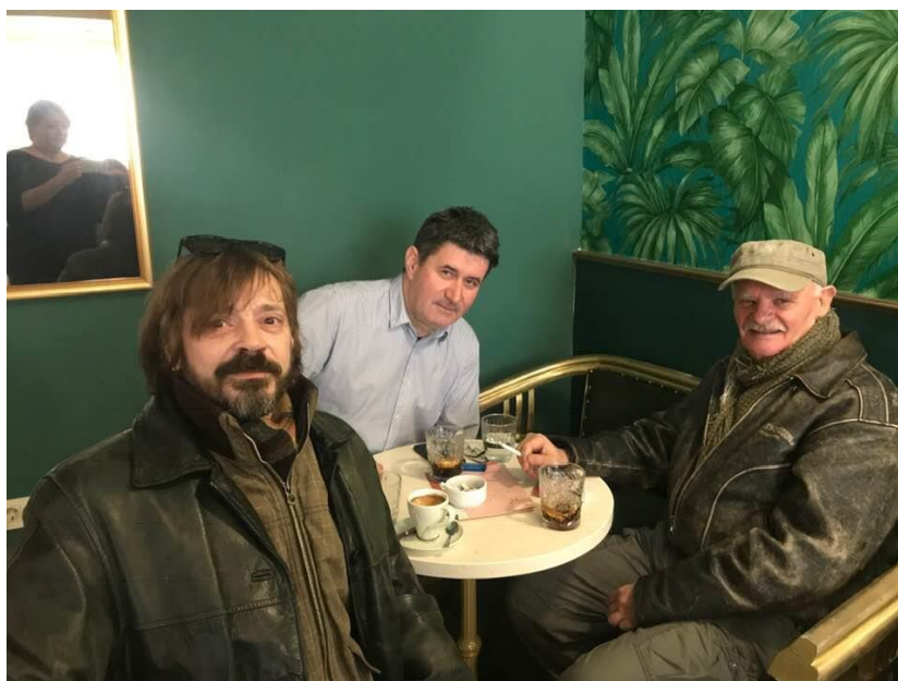
Slika 9. Posljednja fotografija Ive Gregurevića

Fabijana Šovagovića koji je bio Gregurevićev uzor.“ 43 Komemoracija za Ivu Gregurevića održana je 9. siječnja u zagrebačkom HNK, a Knjiga žalosti otvorila se u predvorju Hrvatskog narodnog kazališta u Zagrebu od 3. siječnja. Dijelovi In Memoriam „...Nastupao je u predstavama Teatra u gostima, na Splitskome ljetu i Dubrovačkim ljetnim igrama. S monDRAMOM Đuka Begović Ive Kozarca, koju je uprizorio 2002. kao svojevrsni hommage svojem uzoru i prerano preminulom kolegi i prijatelju Fabijanu Šovagoviću, obišao je cijelu Hrvatsku, odigravši više od 800 predstava, uvijek pred prepunim gledalištem. ... Najšira ga publika pamti po ulogama ostvarenim u tridesetak televizijskih serija i drama, a osobito po jednoj od posljednjih, duhovitoj, lucidnoj, ciničnoj i prepoznatljivo simpatičnoj ulozi oca obitelji u seriji Odmori se, zaslužio se autorskoga dvojca Gorana i Snježane Tribuson, koja se zaslužio reprizira do danas. ...U rodnome je Orašju, sjećajući se svih tamošnjih filmofila 1995. godine pokrenuo filmski festival, koji je prerastao u tradicionalno godišnje slavljenje hrvatskoga filma, gdje su se velikim veseljem okupljale njegove kolege i prijatelji iz filmskoga i kazališnog svijeta.“ 44