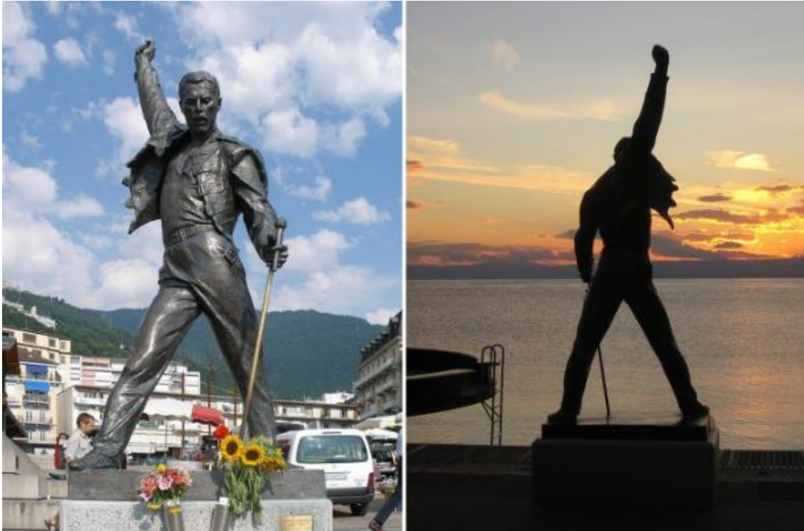
Slika 6. Brončana skulptura Freddie Mercuryja u Montreuxu