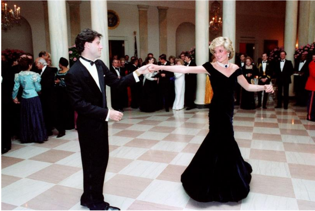
Slika 4. Princeza Diana i John Travolta