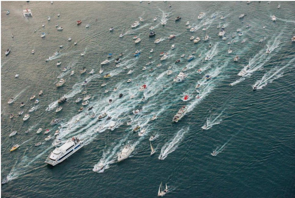
Slika 8. Ispraćaj Olivera prema Vela Luci

putem TV kanala uživo taj ispraćaj, mnogima najdražeg i omiljenog glazbenog umjetnika. Tisuće Splićana ispunilo je splitsku Rivu, a suza, pjesama i pljeska nije nedostajalo. Uz pjesmu „Galeb i ja“ katamaran s Oliverovim tijelom isplovio je iz splitske luke. Brodske sirene i stotine brodica Splićana išle su za katamaranom kojeg su također pratili brodovi Lučke kapetanije, MUP-a i Hrvatske ratne mornarice. Lijes s Oliverovim tijelom u Vela Luci su gotovo dočekali svi stanovnici uz klapu koja je pjevala njegovu pjesmu „Pismo moja.“ 39