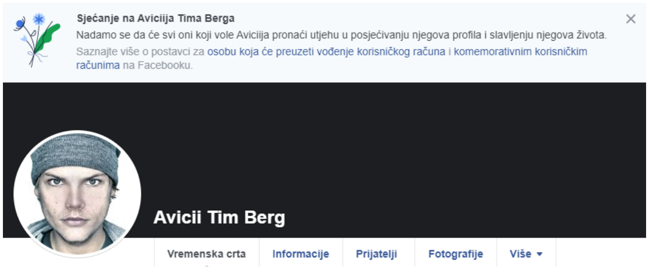
Slika 3. Facebook stranica Aviciiija Tima Berga

je danas, procijenjuje se, oko 30 milijuna profila preminulih osoba. Ponašanje njihovih prijatelja i korisnika MySpacea je proučavao student Jed Brudbaker te je objavio i znanstveni rad na temu ‘Smrt i društvene mreže’, piše Tehnoklik. – Ono što me posebno iznenadilo je to da smo vidjeli kako se ljudi vraćaju i nastavljaju komunicirati s mrtvim ljudima iz godine u godinu., 20 Facebook je upravo zato i pokrenuo mogućnost memorijskih profila. Na vrhu profila pisati će „Sjećanje na...“, a ovisno o postavkama privatnosti računa, osobe će na profil moći objavljivati svoje uspomene na tako zvanu komemorativnu vremensku crtu.