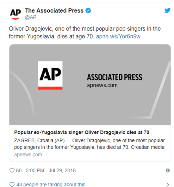
Slika 7. Vijest o smrti Olivera Dragojevića, The Associated Press

Na svakom portalu i društvenoj mreži tih dana mogli smo vidjeti vijest koja je, kako su svi i pisali, potresla Hrvatsku. No vijest se proširila i među brojnim svjetskim medijima. Associated Press, ugledna agencija, objavila je smrt Olivera Dragojevića, a vijest se proširila i do New York Timesa i Washington Posta.