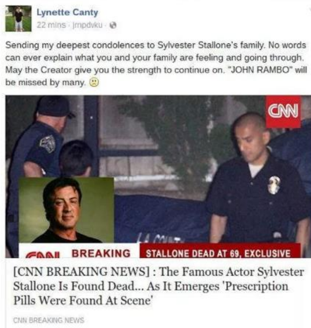
Slika 2. Objava vijesti o lažnoj smrti

oni pozitivan uređaj za liječenje i prihvaćanje gubitka.“ 19 Već spomenute lažno objavljene smrti doživjeli su i Jeff Goldblum, Natalie Portman, George Clooney, Britney Spears, Harrison Ford i Rick Astley i to kako CNN-ova stranica navodi, par dana nakon prave smrti Michaela Jacksona, Farraha Fawcetta i Eda McMahona. Takve lažne vijesti uglavnom se pojavljuju na društvenim mrežama poput Twittera ili Facebooka. Kako se dobar glas daleko čuje, a loš još i dalje, tako je nekada teže saznati radi li se o istini ili tek još jednom internetskom trolu jer mnogi će povjerovati u nadi da netko tako ozbiljnu situaciju ne bi izmislio.