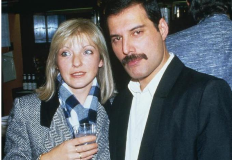
Slika 5. Mary Austin i Freddie Mercury

radi. Preminuo je u svom domu uz najbliže, a njegova smrti pogodila je i šokirala svijet, posebice zato što se sve za javnost odigralo u kratkom roku. Nastavio je snimati nedugo prije smrti, ne gubeći snagu i glas.