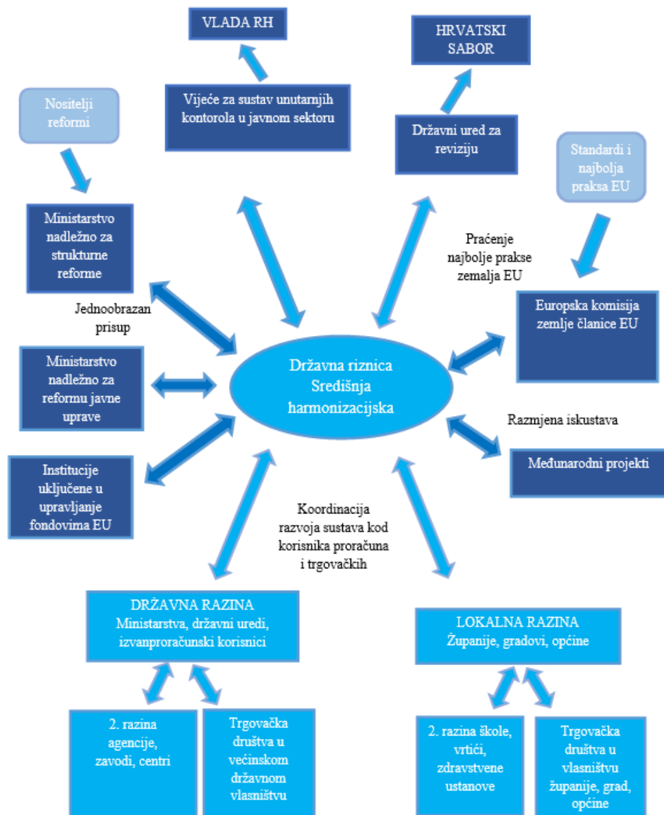
Slika 1: Koordinacijska uloga Državne riznice odnosno SHJ-a u razvoju sustava unutarnjih kontrola