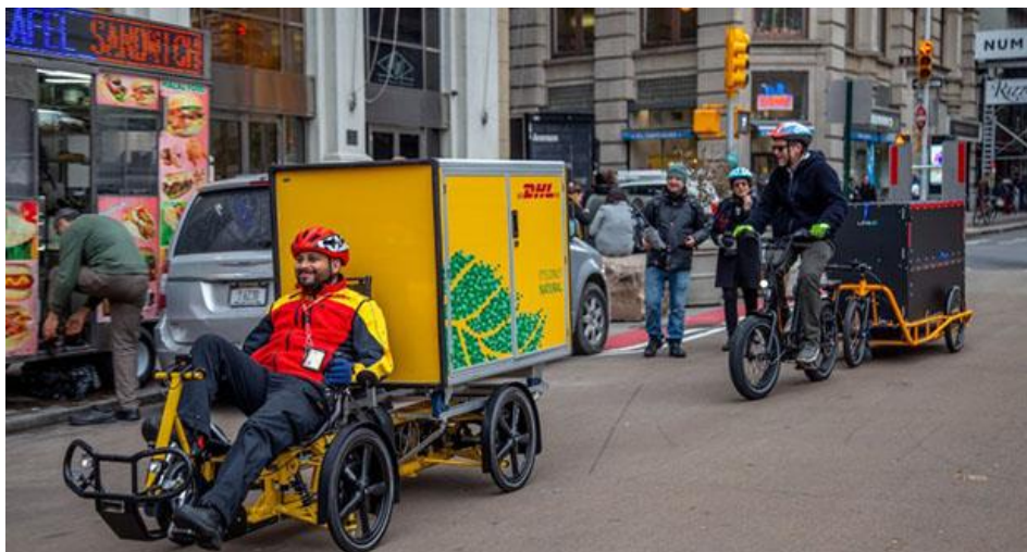
Slika 3. Primjer organizacijskih mjera i novih tehnologija- primjerna teretnih bicikala [13]