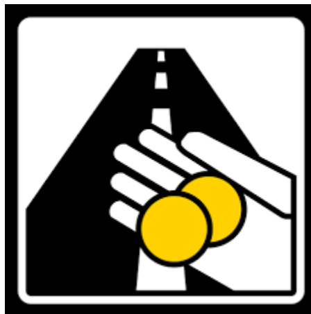
Slika 2. Primjer tržišno orijentiranih ili fiskalnih mjera- naplata prometa [12]