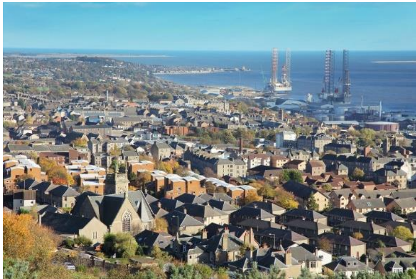
Slika 7. Pogled na Dundee s najvišeg vrha [8]

Sulp Dundee-a je razvijen iz organizacije Inteligentne europske organizacije i Energetske efikasnosti u gradskim logističkim sustavima za male i srednje europske povijesne gradove, tj. ENCLOSE projekt, kojemu je cilj postizanje energijski optimalnije logistike te posljedično smanjenje emisija ugljika vezanih za teretni promet. Počela se voditi briga za ekološku svijest, a najviše na očuvanje kvalitete zraka. Sulp je bio usmjerene da izgradi sve potrebne mjere za čim veće produljenje mjera očuvanja okoliša i očuvanje okoliša od štetnih plinova. Isto tako, Sulp brine da i ostale regije počnu razmišljati o okolišu i raditi na njegovom očuvanju. [9]