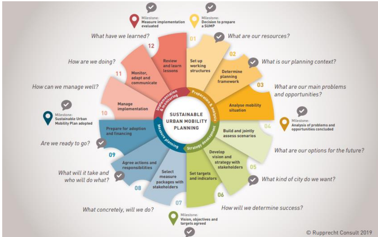
Slika 4. Prikaz smjernica za izradu SUMP plana [10]