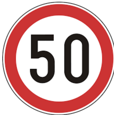
Slika 1. Primjer regulatornih mjera- ograničenje brzine [11]

Kao primjer možemo navesti da je grad Ljubljana u Sloveniji uveo ograničenja za dostavu tereta u pješačku zonu i zonu užeg centra u centru grada kako slijedi: