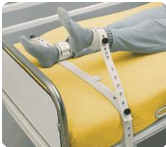
Slika 7.2.1. 3. Magnetni pojas za noge