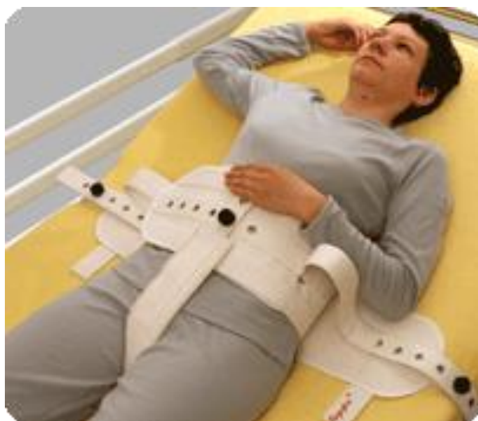
Slika 7.2.1. 1. Magnetni pojas za trup

Izvor: https://medivita.hr/medicinska-oprema/proizvodi/sigurnosni-pojasevi-za-pacijenta/