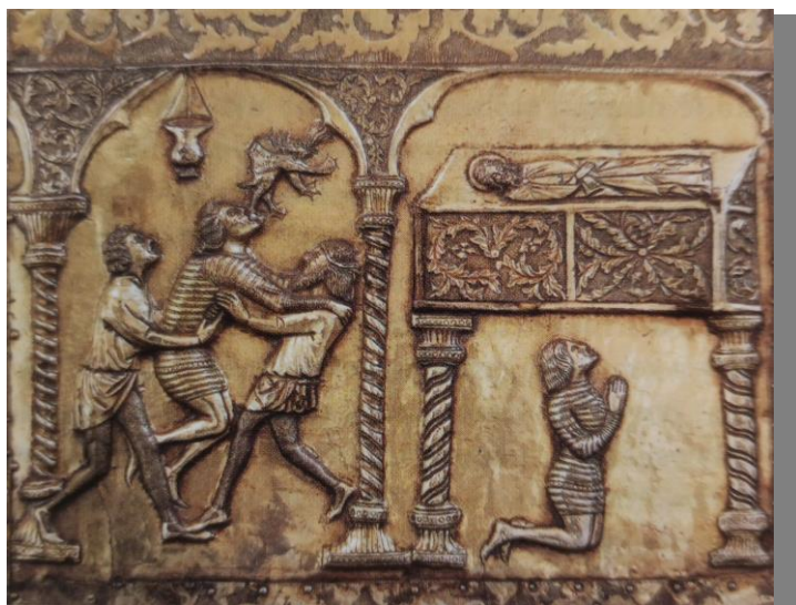
Slika 2.1. 1. Prikaz opsjednutog čovjeka sa škrinje svetog Šimuna

Prostori današnje države tijekom većeg dijela povijesti bili su pod utjecajem medicine mnogih naroda. Iako je razvoj psihijatrijske grane medicine u Hrvatskoj kasnio naspram drugih razvijenijih zemalja, ipak su određeni revolucionarni tretmani, poput tadašnje elektrokonvulzivne terapije, uvedeni u praksu gotovo odmah. Najznačajniji predmet iz Srednjeg vijeka je škrinja svetog Šimuna iz Zadra. Sadrži prikaz bolesnika u psihomotornom nemiru, u praksi često praćen agresivnim ponašanjem, kojeg pridržavaju dva čovjeka. Na slici je vidljivo da iz bolesnika izlazi demon, što govori o značajnom utjecaju Crkve na tadašnju medicinu (Slika 2.1.1.) [1].