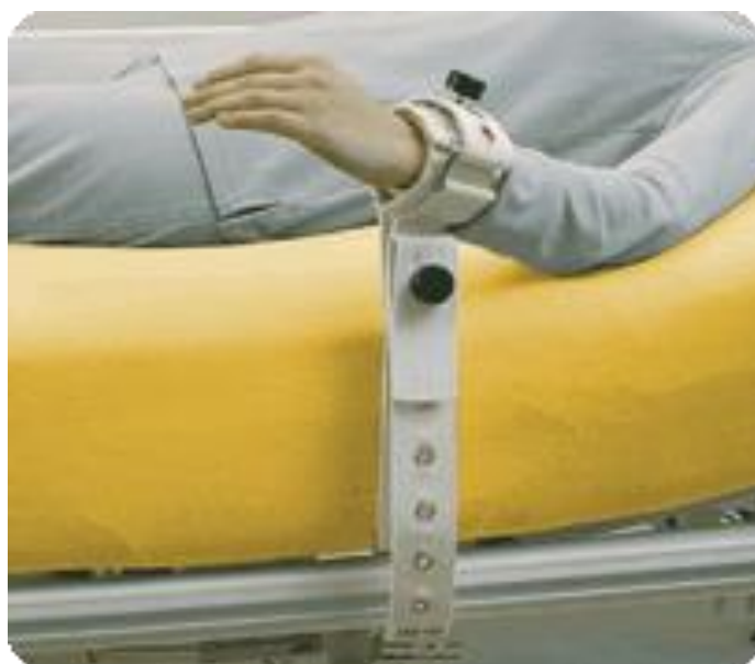
Slika 7.2.1. 2. Magnetni pojas za ruke

Izvor: https://medivita.hr/medicinska-oprema/proizvodi/sigurnosni-pojasevi-za-pacijenta/