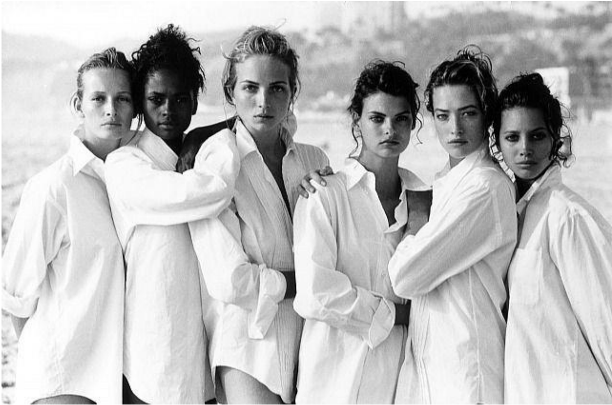
Slika 3.2.1.: Peter Lindbergh, Estelle Lefébure, Karen Alexander, Rachel Williams, Linda Evangelista, Tatjana Patitz, Christy Turlington, Santa Monica, California, SAD, 1988. godine