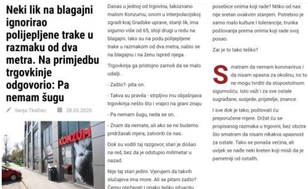
Slika 4.2.1. Tekst na portalu Virovitica.net