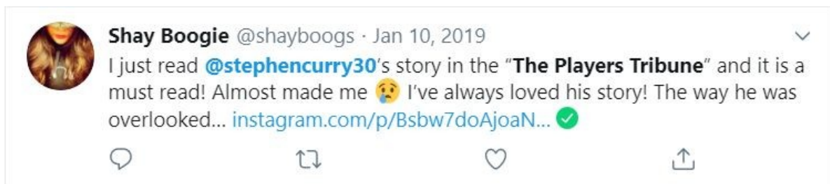
Slika 4.1.5 Reakcija čitateljice na Curryjev tekst