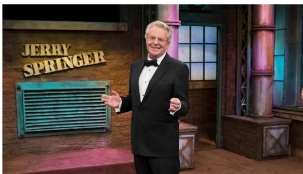
Slika 3.4.2. Jerry Springer Show

Iznošenje intimnih podataka na televiziji također može imati i negativne posljedice. Prije Velikog brata u 90-im godinama tabloidni talk-show Jerry Springer uvelike je popularizirao ispovjedničku kulturu. Isprva politički orijentirana emisija, 1994. je godine dobila zaokret kada je format izmijenjen u senzacionalističku emisiju u kojoj su gosti bili obični ljudi i gdje su se javno, pred kamerama i publikom, sukobili s članovima vlastite obitelji, prijateljima, bivšim supružnicima na temelju kontroverznih tema poput bračne nevjere, homoseksualnosti, prostitucije, transvestitizma i slično. Emisija bi najčešće započinjala predstavljanjem problematične teme i gosta koji bi pričao o njoj. Zatim bi, u drugom dijelu emisije, pozvali drugog gosta (najčešće blisku osobu prvog gosta) koji bi se suprotstavio prvom gostu. 4