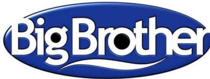
Slika 3.4.1. Prepoznatljivi logo Velikog Brata

Svoj je zamah striptiz kultura dobila najviše u televizijskim formatima, od raznih talk showova , tzv. „dokumentarnih sapunica“ do tzv. reality showova pa čak i kvizova, a pravi boom doživjela je 2000-ih godina. Reality showovi postajali su sve popularniji i na neki način „normalizirali“ teme koje bi se do tog vremena smatrale neprikladnima za televizijske emisije. Iako su kasnovječernji termini odavno bili prihvatljivi za filmove za odraslu publiku, one s prikazom golotinje, seksa i nasilja, priliku za egzibicionizam su konačno dobili obični ljudi iz naše svakodnevice, a emisije poput Big Brothera ( Veliki Brat ) i drugih upravo su to omogućavale.