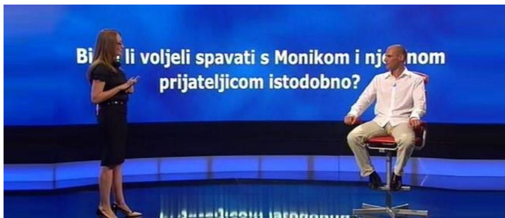
Slika 3.4.3. Trenutak istine , hrvatsko izdanje (Nova TV)

Nastavno na kulturu ispovijedanja, posebne kontroverze svojevremeno izazivala je kviz emisija Trenutak istine (izvorno Moment of truth ). Natjecateljima su se u toj emisiji postavljala vrlo intimna pitanja koja su ulazila u detalje iz privatnog života za novčanu nagradu, a poligraf bi odlučio je li natjecatelj bio iskren ili je lagao. Natjecatelji su tako, osim detalja iz intimnog života, znali priznavati i kaznena djela, nakon čega su u pojedinim državama gdje je emisija prikazivana natjecatelji dobili kaznene prijave, dok je možda najkontroverzniji slučaj zabilježen u Kolumbiji gdje je natjecateljica priznala da je naručila ubojstvo svog vlastitog supruga, nakon čega su emisiju i ukinuli. 6