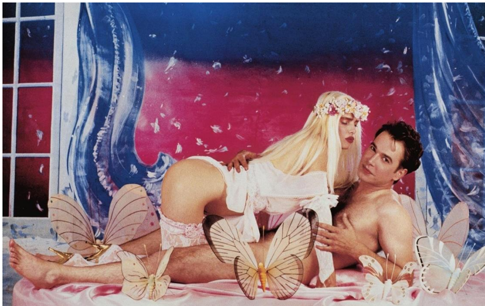
Slika 3.3.1. Made in Heaven , fotografija iz serije autora Jeffa Koonsa

Porno-šik je u javnu sferu ušao na vrata umjetnosti. Iako je naznaka porno-šika u umjetničkom izražavanju postojala već u 60-ima, tek kao kulturni trend je prihvaćen u razdoblju kraja 80-ih, odnosno početka 90-ih. McNair spominje seriju fotografija i skulptura Made in Heaven američkog umjetnika Jeffa Koonsa kao jedan od prvih primjera umjetničkih porno-šikova, a koja je prikazivala njega i njegovu suprugu Cicciolinu (poznatu talijansku porno zvijezdu) u spolnom odnosu (McNair 2004: 73). Iako seksualno eksplicitna i bez obzira što mašti ostavlja malo toga, ova serija vrednuje se kao umjetnička, a u javnosti je imala dovoljno odjeka da se u medijima često koristi kao ilustracija uz prikladne tekstove i članke u novinama i časopisima. Tako Made in Heaven možemo slobodno uvrstiti kao datum početka poigravanja elementima pornografije u kulturnoj i medijskoj sferi (McNair 2004: 74).