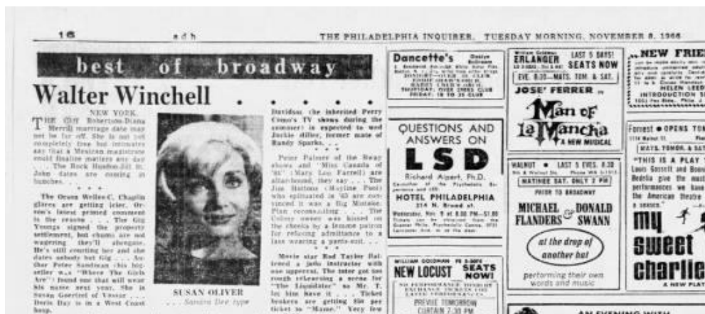
Slika 3.4.4. Kolumna Waltera Winchella

To je samo primjer javnog zanimanja za seksualni život slavnih koji se nije pojavio tada u tim okolnostima, već je postojao vjerojatno oduvijek: McNair spominje primjere novinskih članaka iz 18. stoljeća koji razotkrivaju skandalozne ljubavne veze aristokracije Europe, a iz samih početaka „žutog novinarstva“ iz 1920-ih godina spominje trač-kolumnu novinara Waltera Winchella u kojima se pozivao na „demokratizirajuću moć razotkrivanja elite“ (McNair 2004: 107).