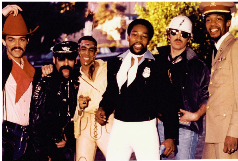
Slika 4.2.1. Village People

Pokraj filmske umjetnosti, prikaz homoseksualnosti važnu je ulogu imao u imidžu tadašnje glazbene scene, koja je kulminirala s disco skupinom Village People . Za razliku od stereotipa feminiziranosti, Village People su ipak bili prikaz „supermuškosti“, s obzirom na to da su na nastupima članovi grupe obavezno nosili kostime koji su naglašavali maskuliziranost, a i sami su bili izraženo muževni i mišićavi (isto).