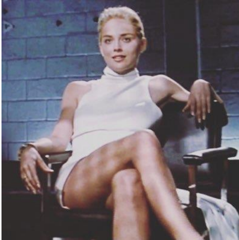
Slika 5.2.1. Sharon Stone u ulozi Catherine Trammel ( Sirove strasti , 1992.)

Feministički povoljnijem prikazu žena na filmu nastavlja redatelj Aliena , Ridley Scott, i to filmom Thelma i Louise (1991), gdje se priča vrti oko dvije žene koje su odlučile ubiti muške zlostavljače i pobjeći od njih. U filmu se pojavljuje tada mladi glumac u usponu Brad Pitt, koji je angažiran ubrzo nakon reklame za Levi's u kojoj je seksualno objektiviran, dok su glavne protagonistice ovdje prikazane kao odmetnice u borbi protiv patrijarhalnih sila, što se u svakom slučaju može nazvati revolucionarnim obratom u filmovima takvog žanra. Film je zbog takvog obrata i postao prepoznatljiv kao feministička ikona nove politike spolova (isto).