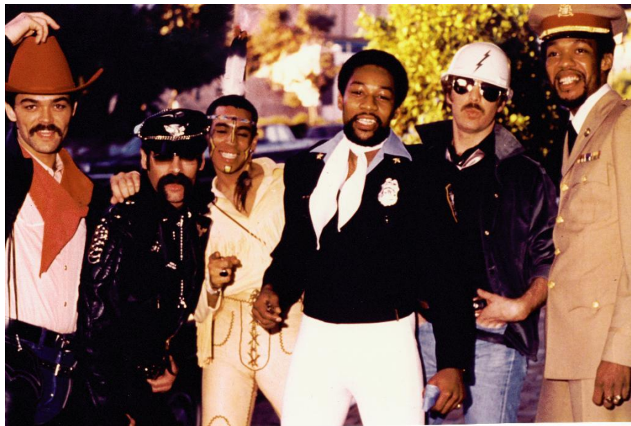
Slika 4.2.1. Village People

Pokraj filmske umjetnosti, prikaz homoseksualnosti važnu je ulogu imao u imidžu tadašnje glazbene scene, koja je kulminirala s disco skupinom Village People . Za razliku od stereotipa feminiziranosti, Village People su ipak bili prikaz „supermuškosti“, s obzirom na to da su na nastupima članovi grupe obavezno nosili kostime koji su naglašavali maskuliziranost, a i sami su bili izraženo muževni i mišićavi (isto).