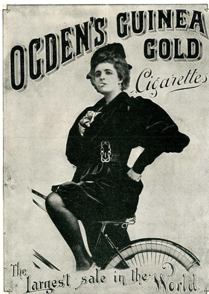
Slika 2.2.1. Reklamni plakat kampanje „Baklje slobode“

oko prodaje cigareta marke Phillip Morris upravo ženama, koja se odvijala pod nazivom Torches of freedom ( baklje slobode ). 1