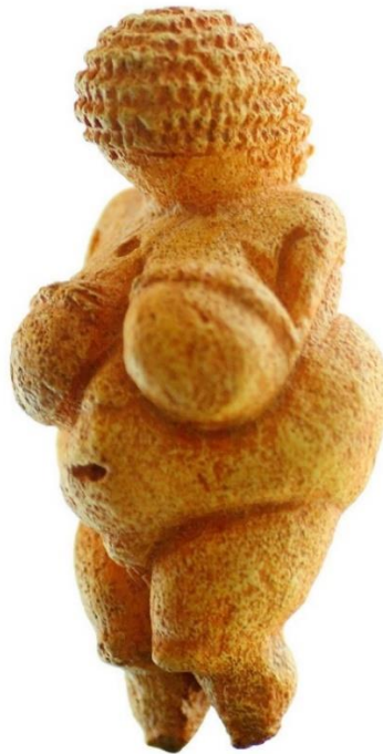
Slika 5.1.1. Venere iz Willendorfa

Prikaz nagog tijela postoji otkako je umjetnosti, a primjere toga nalazimo još iz razdoblja prapovijesti. Možda je najpoznatiji primjer arheološki nalaz skulpture Venere iz Willendorfa iz razdoblja paleolitika (28 000-25 000 godina pr. n. e.), koja prikazuje nugu ženu, a naglasak na njezina obilježja sugeriraju prikaz plodnosti, totema za sreću ili pak majke božice. 9 Ne isključuje se mogućnost da se radi o primjeru afrodisijaka za muškarce, što bi pak sugeriralo da bi ovo mogao biti prehistorijski primjer ako ne idealnog, onda svakako privlačnog ženskog tijela. Posebna pozornost dana je prikazu trupa, dok facijalnih ekspresija ni nema, budući da glavu pokriva neka vrsta kape ili vela. Ruke i noge prikazane su samo u naznakama. Veličina skulpture ne prelazi 11 cm, što govori da stane u dlan ruke i time je bila lako prenosiva.