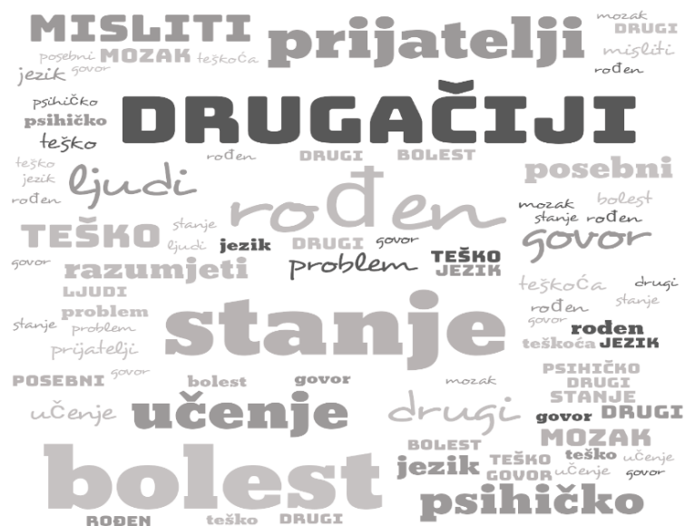
Slika 6.1. Prikaz interpretacije 11-godišnjaka o djeci s poremećajima iz autističnog spektra [56]

Dillenburger i sur. (2017) proveli su istraživanje u kojem su ispitali znanje djece i mladih o autizmu. U istraživanju je ukupno sudjelovalo 3 343 djece i mladih, a rezultati istraživanja pokazali su da je 50% 11-godišnjaka i 80% 16-godišnjaka bilo upoznato s dijagnozom autizma. Većina djece koja su točno odgovorila na pitanja vezana uz autizam već poznaje nekog tko ima poremećaj iz autističnog spektra. Slika 6.1. prikazuje termine i riječi koje su 11-godišnjaci koristili za opisivanje autizma [56].