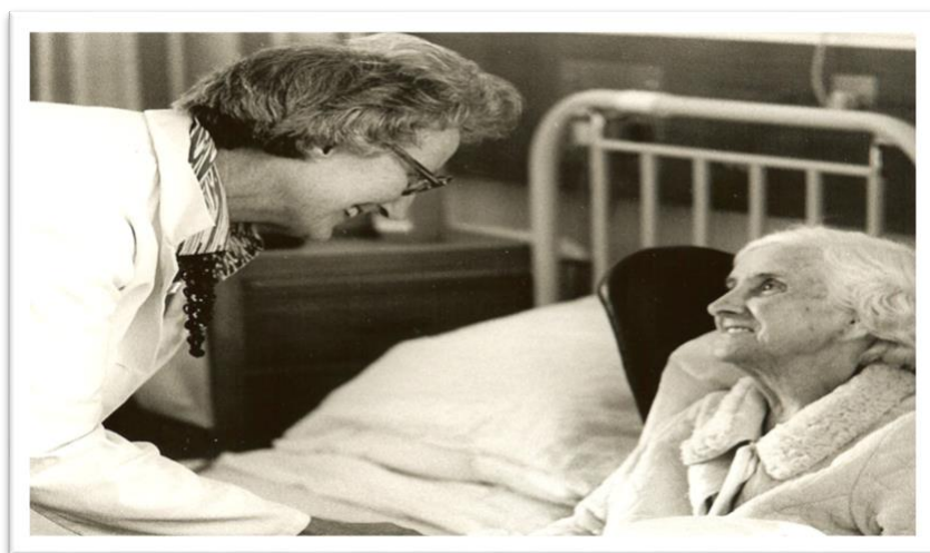
Slika 3.3.1. Cicely Saunders

Razvoj palijativne medicine započeo je u šezdesetim godinama sa početkom u Velikoj Britaniji, dok se sedamdesetih godina javlja u Sjedinjenim Američkim Državama (SAD) i u Kanadi. Hospicijski pokret je imao glavni međunarodni utjecaj kada je u pitanju promicanje palijativne medicine, a zatim i palijativne skrbi. Cicely Saunders prikazana je na slici 3.3.1., a ostala je upamćena kao engleska medicinska sestra, socijalni radnik, liječnik i pisac. Isticala je važnost palijativne skrbi u modernoj medicini [5].